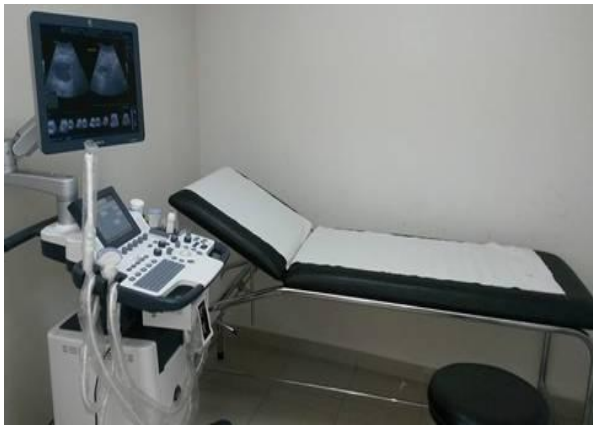
Εικόνα 1 Συμβουλευτικό Κέντρο Ιατρικής Φροντίδας