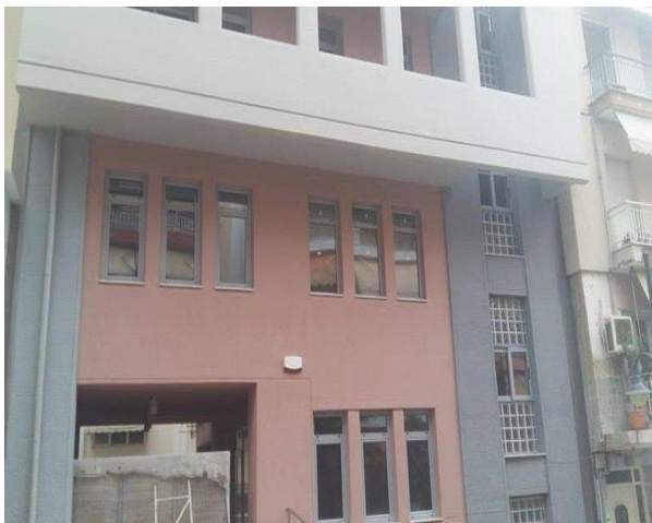
Εικόνα 2 Δημοτικά Ιατρεία Κοινότητας Τριανδρίας