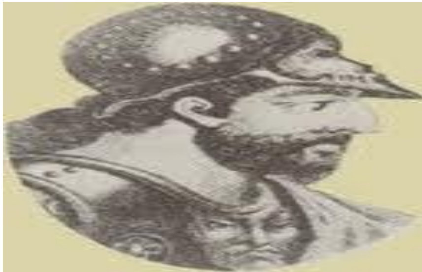
Εικόνα 4: Ο βασιλιάς Αγησίλαος (Πηγή: Βούλγαρης, 2013)