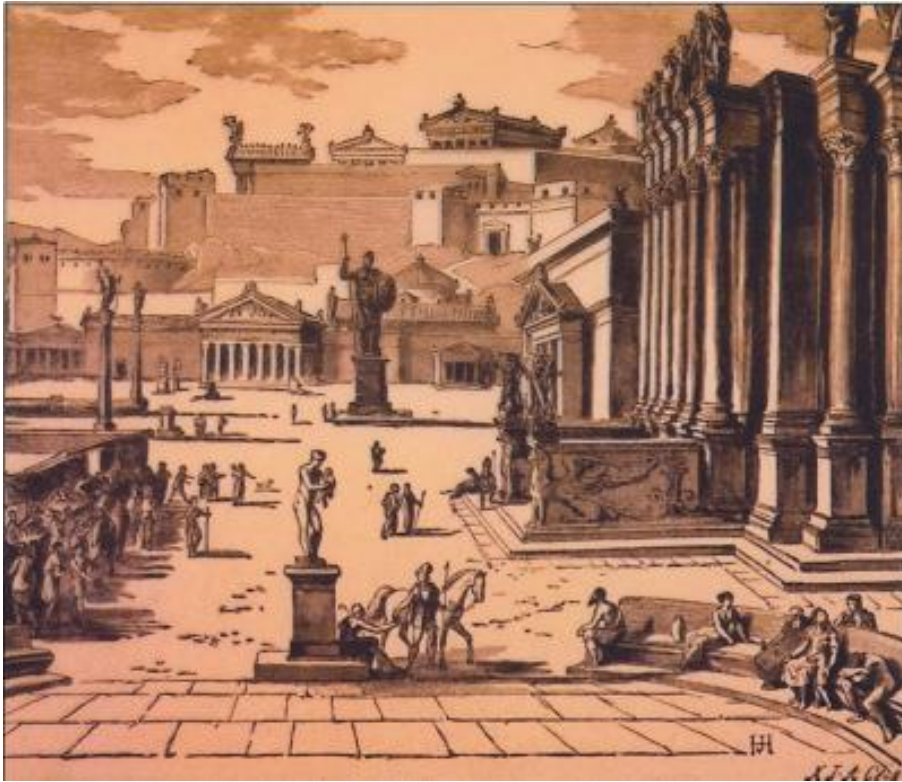
Εικόνα 5: Η αρχαία Αγορά της Σπάρτης

Για το σύνολο των αιχμαλώτων που έμεναν πίσω λόγω του ότι ήταν μεγάλοι, ο Αγησίλαος φρόντιζε να τους προσέχει κάποιος για να μη κατασπαραχθούν από τα σκυλιά και από τους λύκους. Αυτό τον έκανε συμπαθή όχι μόνο για όσα είχαν μάθει γι αυτόν αλλά και για όσα είχε κάνει γι αυτούς. Ακόμη, και στο πλήθος των πόλεων που είχε με το μέρος του, είχε καταργήσει το πλήθος των υπηρεσιών που είχαν προσφερθεί από τους δούλους στους αφέντες και είχε δώσει διαταγή να υπάρχει αμοιβαίος σεβασμός από τους ελεύθερους πολίτες προς τους άρχοντες και το αντίστροφο.