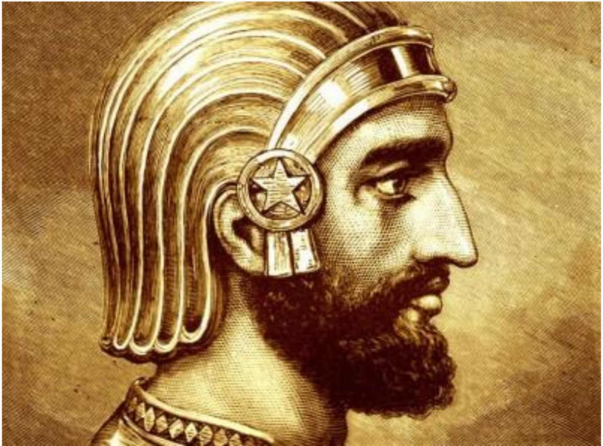
Εικόνα 2: Ο Κύρος ο Μέγας

Το όνομα Κύρος έχει Λατινική προέλευση. Η Λατινική λέξη Cyros προέρχεται από την ελληνική λέξη κύρο. Παρεμφερή ονόματα έχουν καταγραφεί και σε άλλες γλώσσες, με τη σημασία τους να αλλάζει σε κάθε μία από αυτές. Οι πρώτοι που μελέτησαν την σημασία του ονόματος ήταν οι αρχαίοι Έλληνες ιστορικοί Πλούταρχος και Κτησίας. Οι ιστορικοί αυτοί ανέφεραν ότι ο Κύρος είναι ένα όνομα που προέρχεται από το Kuros , που σημαίνει ήλιος. Η άποψη τους αυτή εξηγείται βάσει της ετοιμολογία. Στα λατινικά ο ήλιος είναι Khor , μια λέξη που έχει ίδια ρίζα με τον Kuros . Σε αυτό το σημείο είναι σωστό να αναφερθεί ότι ο πρώτος βασιλιάς της Περσία ονομάζονταν Sun , δηλαδή Ήλιος, επομένως έχει άμεση συσχέτιση με τον Κύρο τον Μέγα καθώς τα ονόματά τους έχουν την ίδια σημασία.