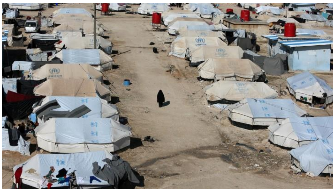
Εικόνα 9 : Στρατόπεδο Αλ Χολ, 2019, Πηγή : Reuters

Οι σταθμοί γάλακτος ήταν το σημαντικότερο έργο του Ερυθρού Σταυρού, καθώς ήταν απολύτως υπεύθυνος για τη σωτηρία χιλιάδων παιδιών (Βικιπαίδεια).