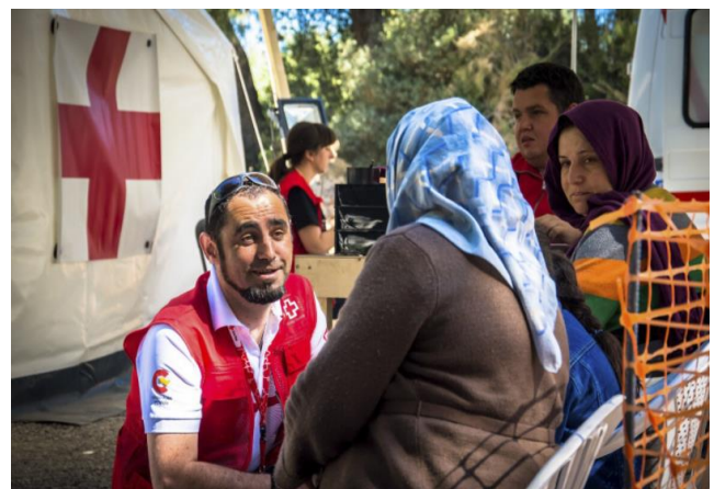
Εικόνα 3 : Αποστολή ανθρωπιστικής βοήθειας από τον Γερμανικό και Δανέζικο Ε.Σ. στην Λέσβο, 14 Οκτωβρίου 2020

Η έκκληση που έχει απευθύνει ο Ελληνικός Ερυθρός Σταυρός για την κάλυψη των αυξημένων αναγκών των προσφύγων/μεταναστών που διαβιούν στο Καρά Τεπέ της Λέσβου, εξακολουθεί να αποτελεί μια από τις προτεραιότητες εθνικών συλλόγων