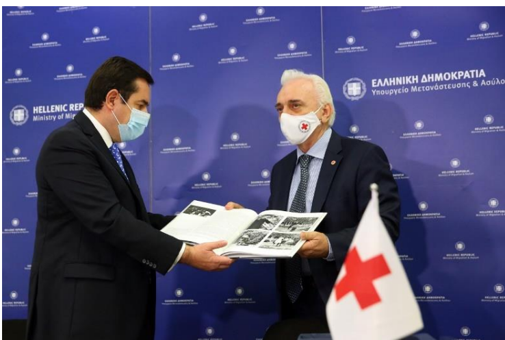
Εικόνα 7: Υπογραφή Μνημονίου Συνεργασίας μεταξύ Υπουργείο Μετανάστευσης και Ασύλου και Ε.Σ.Σ., 2 Νοεμβρίου 2020

Στις 9 Σεπτέμβρη ξέσπασε μια καταστροφική πυρκαγιά στην Μόρια της Λέσβου, η οποία κατέστρεψε τον καταυλισμό, στον οποίο διέμεναν παραπάνω από 13.000 πρόσφυγες και μετανάστες. Η πολιτεία κλήθηκε να αντιμετωπίσει άμεσα την κατάσταση, παράλληλα με την συνθήκη της πανδημίας, με τον πρωθυπουργό να αναφέρει σε διάγγελμά του πως πρόκειται για «ζήτημα δημόσιας υγείας, ανθρωπισμού αλλά και εθνικής ασφάλειας».