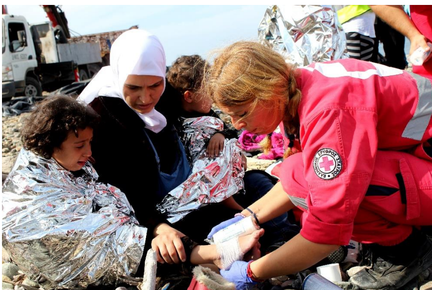
Εικόνα 4 : Παροχή πρώτων βοηθειών από Εθελόντρια του Ε.Ε.Σ.

Έτσι, πακέτα ανθρωπιστικής βοήθειας έφτασαν στις 14 Οκτωβρίου στις αποθήκες του Ε.Ε.Σ στο νησί από τον Γερμανικό Ερυθρό Σταυρό, αλλά και από τον Δανέζικο Ερυθρό Σταυρό. Παραδόθηκαν στον Ε.Σ.Σ. 2.000 πακέτα προσωπικής υγιεινής (απορρυπαντικά ρούχων και πιάτων, σαμπουάν, οδοντόβουρτσες, οδοντόκρεμες, ξυραφάκια, πετσέτες, σερβιέτες κλπ.), από 1.000 απέστειλε έκαστος Ε.Σ., τα οποία θα διανεμηθούν στους ωφελούμενους εντός της εβδομάδος.