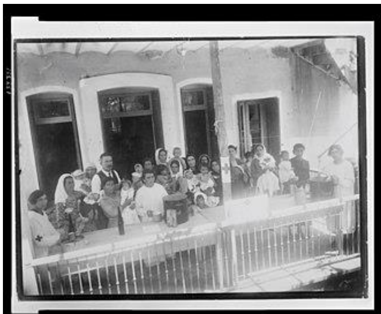
Εικόνα 8 : Σταθμός Γάλακτος για Παιδιά, 1922

Οι σταθμοί γάλακτος ήταν το σημαντικότερο έργο του Ερυθρού Σταυρού, καθώς ήταν απολύτως υπεύθυνος για τη σωτηρία χιλιάδων παιδιών (Βικιπαίδεια).