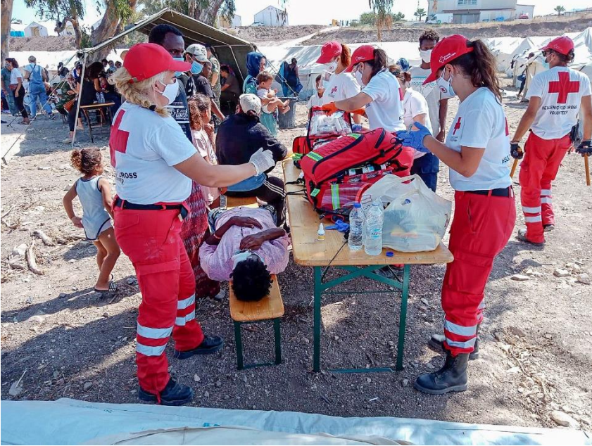
Εικόνα 6 : Πρώτες βοήθειες σε πρόσφυγες κατά την πυρκαγιά στην Μόρια, 10 Οκτωβρίου 2020, Πηγή : Παρατηρητής της Θράκης ( https://www.paratiritis-news.gr/article/230106/Stin-aixmi-tou-doratos-oi-Samareites-tou-parartimatos-Komotinis-tou-Eruthrou-Staurou?fbclid=IwAR0GEsm9avEDS-mGbtWP4XnKJaC-y8vWYtHJwOOAfVrajZK2YaOCY8416Vk )

Στις 9 Σεπτέμβρη ξέσπασε μια καταστροφική πυρκαγιά στην Μόρια της Λέσβου, η οποία κατέστρεψε τον καταυλισμό, στον οποίο διέμεναν παραπάνω από 13.000 πρόσφυγες και μετανάστες. Η πολιτεία κλήθηκε να αντιμετωπίσει άμεσα την κατάσταση, παράλληλα με την συνθήκη της πανδημίας, με τον πρωθυπουργό να αναφέρει σε διάγγελμά του πως πρόκειται για «ζήτημα δημόσιας υγείας, ανθρωπισμού αλλά και εθνικής ασφάλειας».