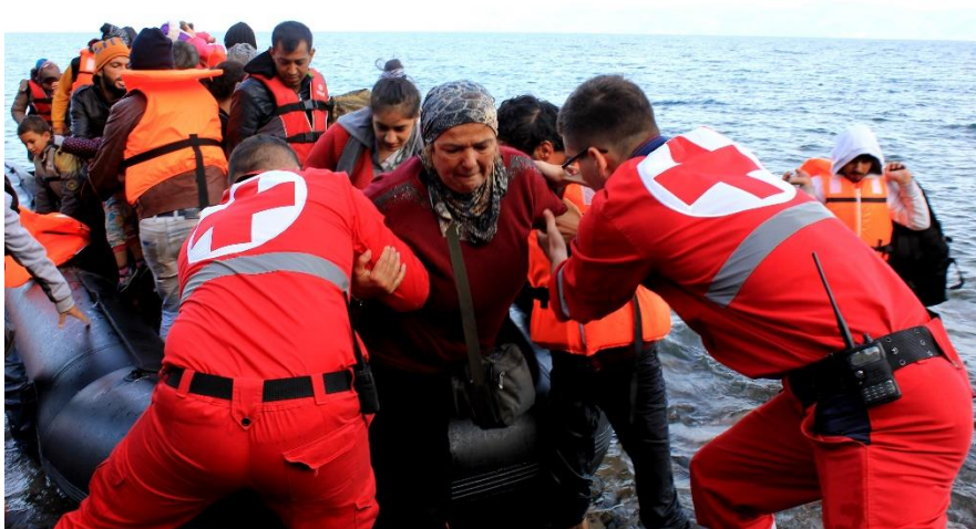
Εικόνα 5 : Διάσωση προσφύγων κατά την άφιξη τους στην Λέσβο