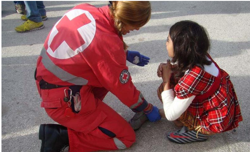
Εικόνα 2 : Παγκόσμια Ημέρα Προσφύγων

Ένας στους 97 ανθρώπους στον κόσμο έχει εκτοπισθεί λόγω διώξεων ή συγκρούσεων. Έως το τέλος του 2019, περίπου 80 εκατομμύρια άνθρωποι αναγκάστηκαν να εγκαταλείψουν τα σπίτια τους. Στον αριθμό αυτό περιλαμβάνονται σχεδόν 26 εκατομμύρια πρόσφυγες, 4,2 εκατομμύρια αιτούντες άσυλο, περίπου 45,7 εκατομμύρια εσωτερικά εκτοπισμένα άτομα και 3,6 εκατομμύρια πολίτες της Βενεζουέλας που εκτοπίστηκαν στο εξωτερικό (EuropeanUnion, 2010).