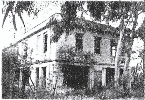
Εικ. 118. Το απομεινάρι του Στρατιωτικού Νοσοκομείου.