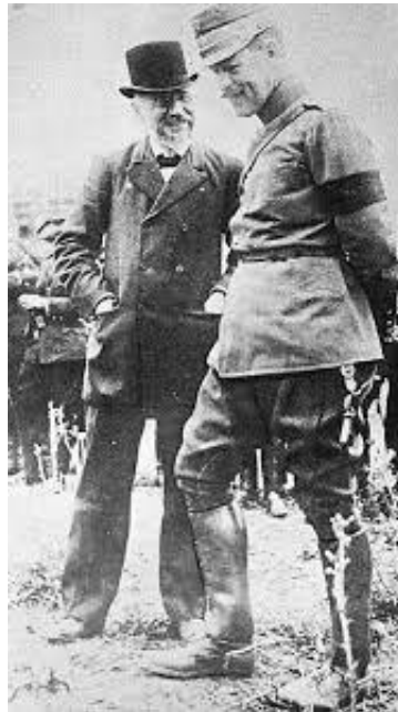
Βενιζέλος και Κωνσταντίνος συνομιλούν.

Η διαταγή επιστράτευσης με την υπογραφή του Γεωργίου Α'