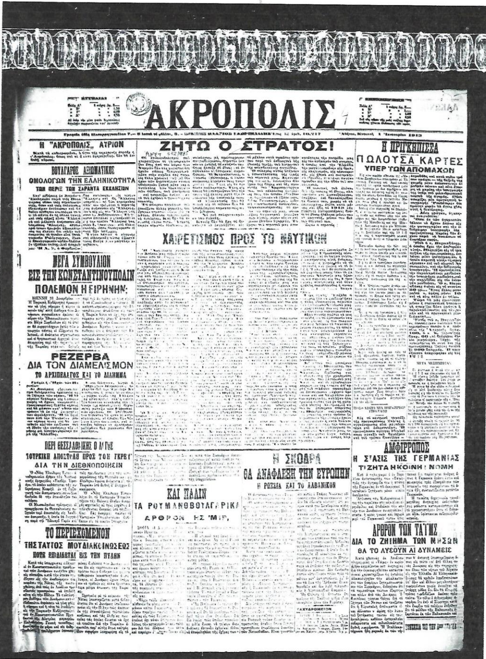
Η εφημερίδα «Ακρόπολις», με την έλευση του 1913, επευφημεί τον στρατό και χαιρετίζει το ναυτικό.