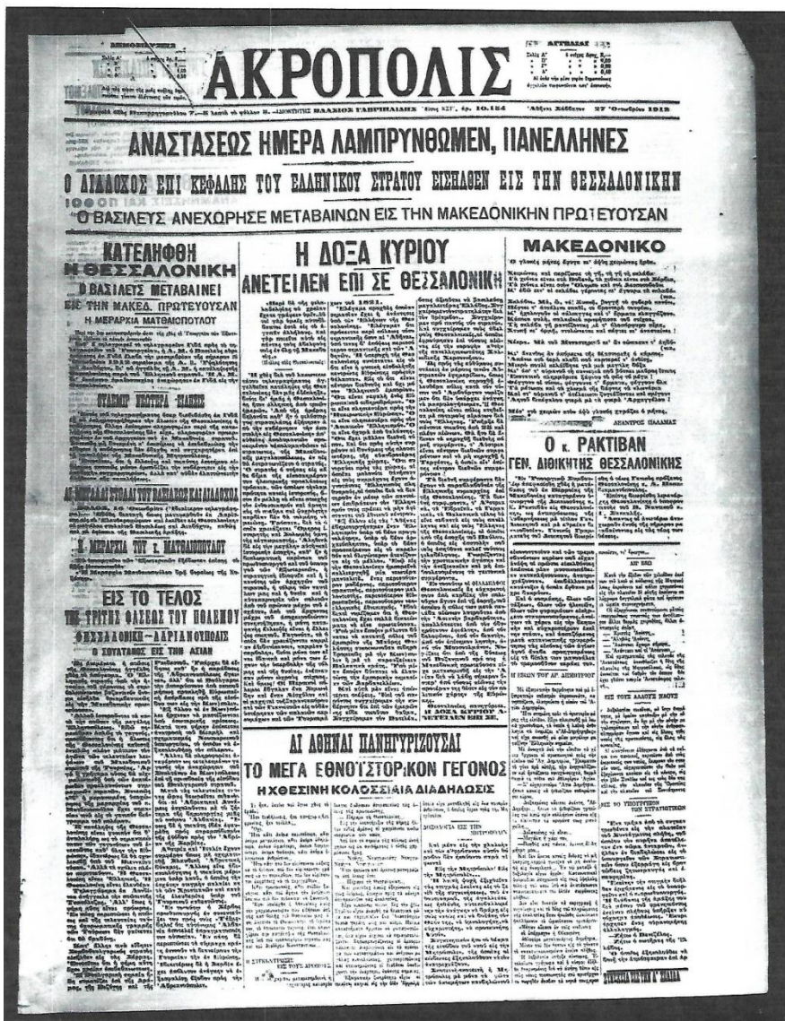
Στο πρωτοσέλιδο της 27ης Οκτωβρίου 1912, η εφημερίδα «Ακρόπολις» αναγγέλλει την κατάληψη της Θεσσαλονίκης από τους Έλληνες.