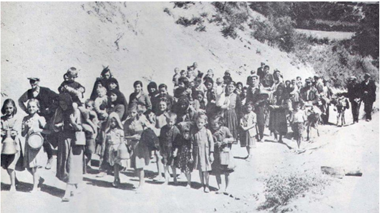
Εικόνα 5: Τα παιδιά στον Εμφύλιο Πόλεμο