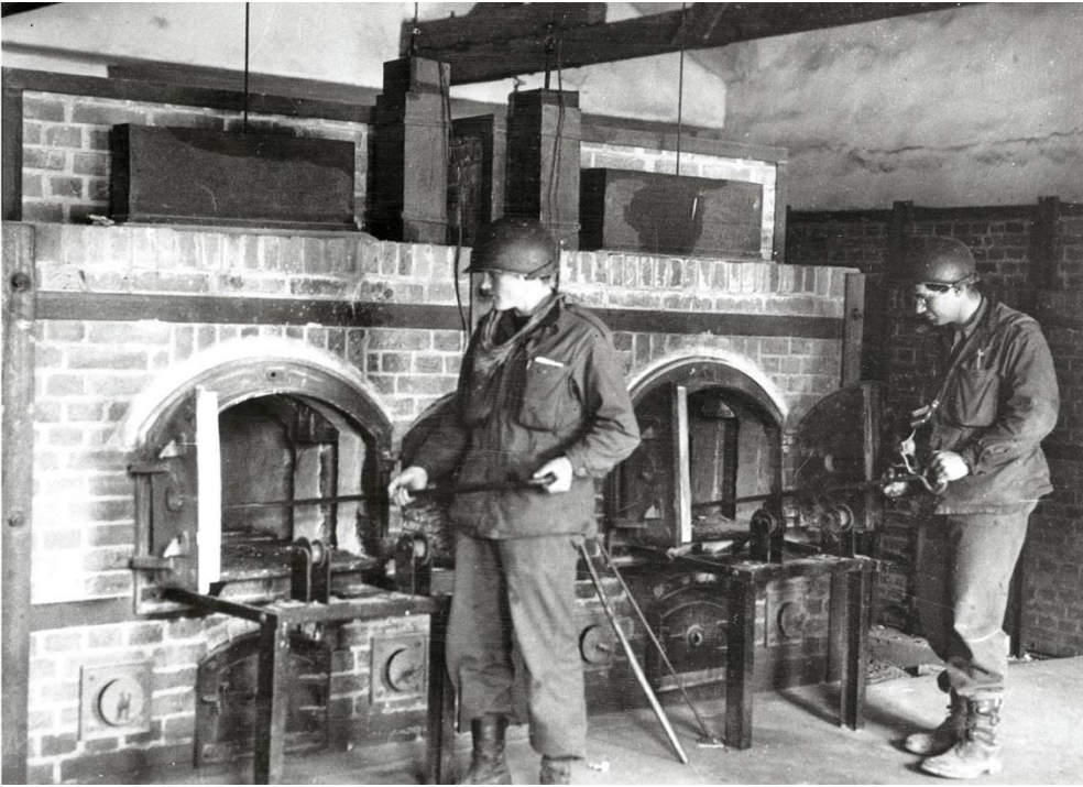
Εικόνα 6: Επιθεώρηση των φούρνων στα στρατόπεδα από τους στρατιώτες. Εκεί οδηγούνταν τα σώματα των νεκρών μετά την εκτέλεσή τους.

( https://athjcom.gr/headlines/%CF%80%CF%81%CE%BF%CE%B5%CF%84%CE%BF%CE%B9%CE%BC%CE%AC%CE%B6%CE%BF%CE%BD%CF%84%CE%B1%CF%82-%CF%84%CE%BF-%CE%BF%CE%BB%CE%BF%CE%BA%CE%B1%CF%8D%CF%84%CF%89%CE%BC%CE%B1/ )