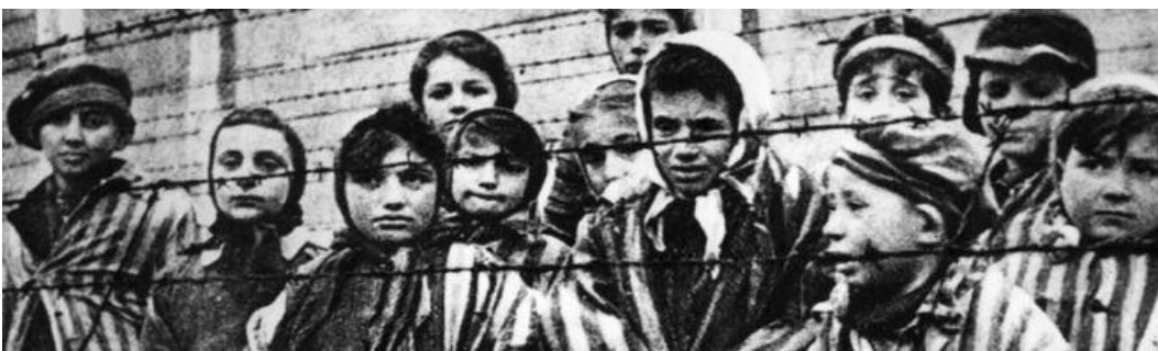
Εικόνα 5: Παιδιά στα συρματοπλέγματα που χώριζαν το στρατόπεδο από τον έξω κόσμο. Αρχικά τα παιδιά νόμιζαν ότι πηγαίνουν σε κάποια εκδρομή, ωστόσο σύντομα έρχονταν αντιμέτωπα με την σκληρή πραγματικότητα.

( https://encyclopedia.ushmm.org/content/el/gallery/auschwitz-photographs )