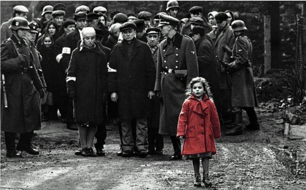
Εικόνα 8: Η Λίστα του Σίντλερ.

Το κοριτσάκι με το κόκκινο παλτό περιφέρεται ανάμεσα σε "γκρίζους" ανθρώπους. Τόσο ολοφάνερο και ξεκάθαρο όσο τα εγκλήματα των Ναζί κατά της ανθρωπότητας.