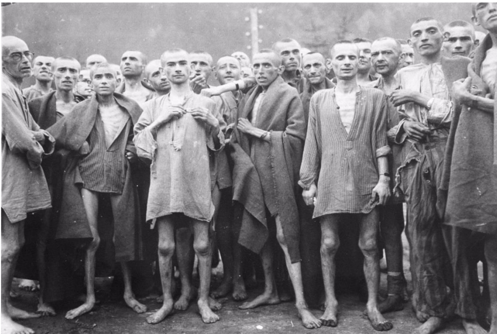
Εικόνα 7: Κρατούμενοι στα στρατόπεδα συγκέντρωσης. Στα σώματα και τα πρόσωπά τους είναι φανερός ο πόνος και η εξάντληση.

( https://athjcom.gr/headlines/%CF%80%CF%81%CE%BF%CE%B5%CF%84%CE%BF%CE%B9%CE%BC%CE%AC%CE%B6%CE%BF%CE%BD%CF%84%CE%B1%CF%82-%CF%84%CE%BF-%CE%BF%CE%BB%CE%BF%CE%BA%CE%B1%CF%8D%CF%84%CF%89%CE%BC%CE%B1/ )