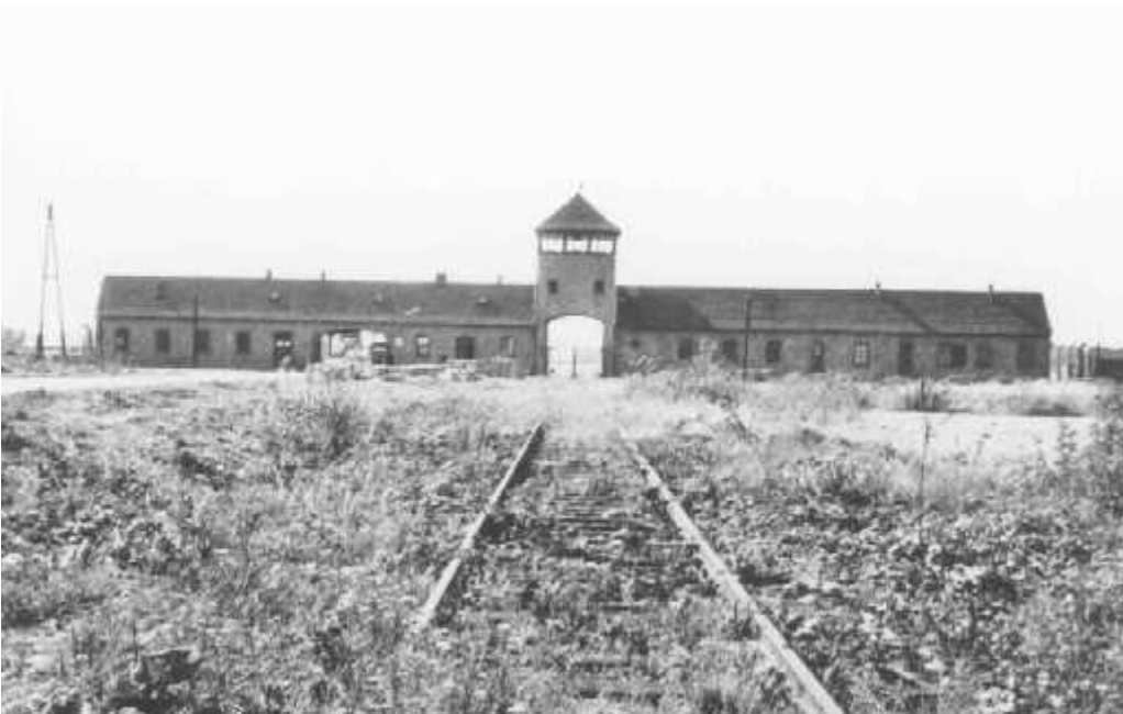
Εικόνα 1: Η είσοδος του Λουσβιτς Μπιρκενάου ( https://encyclopedia.ushmm.org/content/el/gallery/auschwitz-photographs )