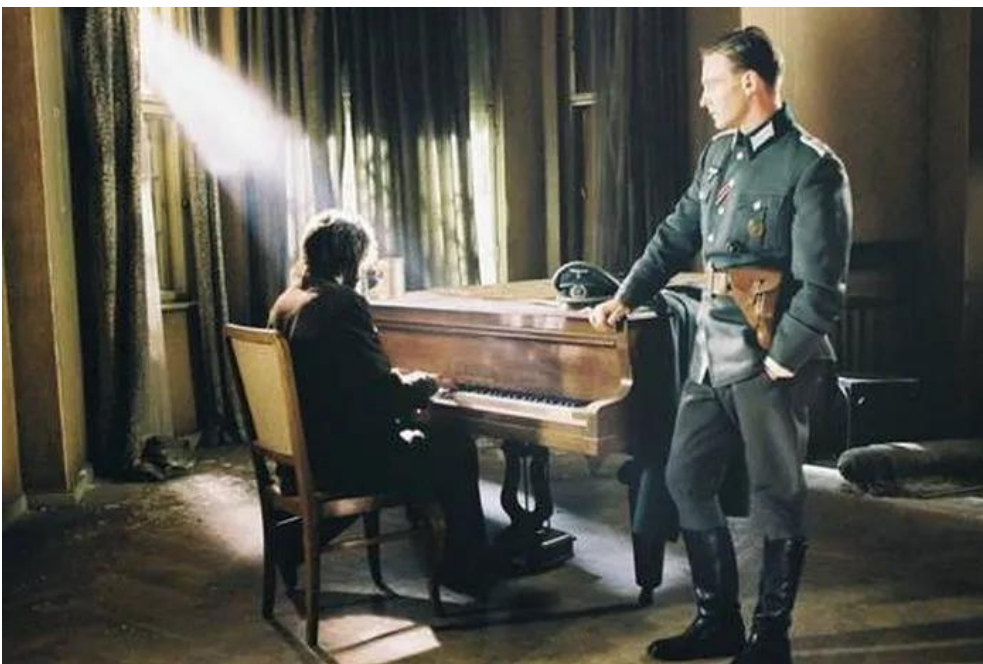
Εικόνα 9: Ο Πιανίστας.

( https://www.cinemagazine.gr/nea/arthro/schindler_s_list-130987523/ )