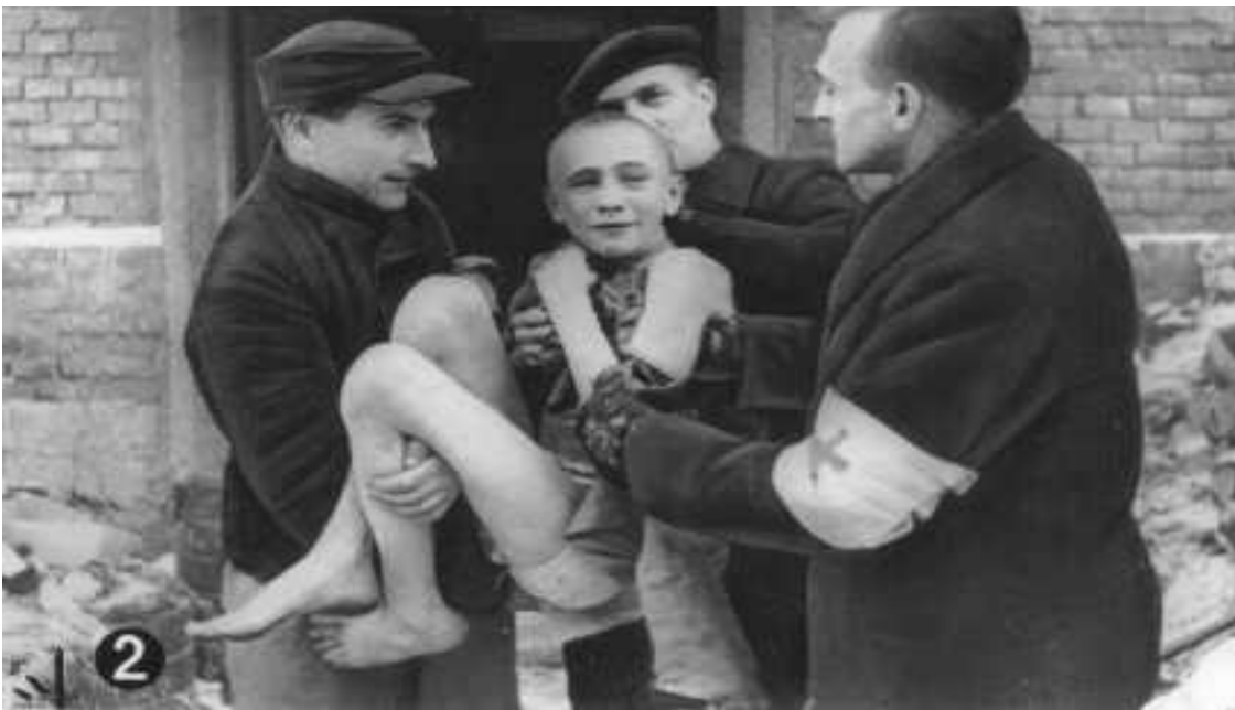
Εικόνα 4: Απελευθέρωση παιδιού που επέζησε από το Ολοκαύτωμα.

( https://encyclopedia.ushmm.org/content/el/gallery/auschwitz-photographs )