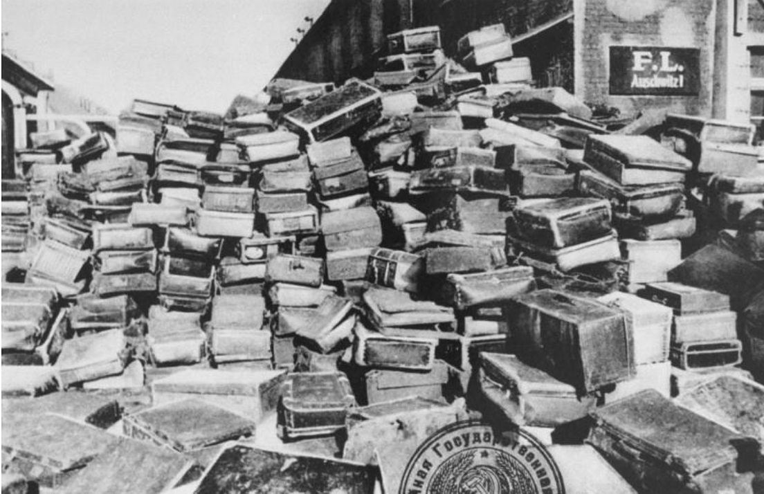
Εικόνα 3: Αποσκευές κρατουμένων που έχασαν τη ζωή τους στο στρατόπεδο. Ύστερα από τον θάνατό τους, τα υπάρχοντα περνούσαν στα χέρια των στρατιωτών, οι οποίοι είτε τα ιδιωτικοποιούνταν, είτε τα εμπορεύονταν.

( https://encyclopedia.ushmm.org/content/el/gallery/auschwitz-photographs )