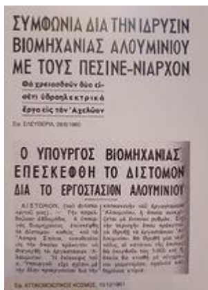
Εφ. Αττικοβωιωτικός Κόσμος-10/12/1961- Πηγή: «Μισός αιώνας Αλουμίνιο-Επετειακή Έκδοση της Αλουμίνιον Α.Ε., Μέλος του Ομίλου Επιχειρήσεων Μυτιληναίος», Έρευνα-Κείμενα Γιώργος Χ. Θεοχάρης, Αθήνα 2010, σ. 17