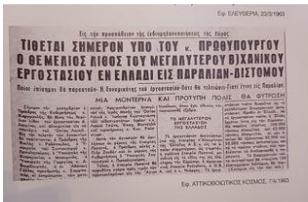
Εφ. Αττικοβωιωτικός Κόσμος -7/4/1963-Πηγή: «Μισός αιώνας Αλουμίνιο-Επετειακή Έκδοση της Αλουμίνιον Α.Ε., Μέλος του Ομίλου Επιχειρήσεων Μυτιληναίος», Έρευνα-Κείμενα Γιώργος Χ. Θεοχάρης, Αθήνα 2010, σ. 27