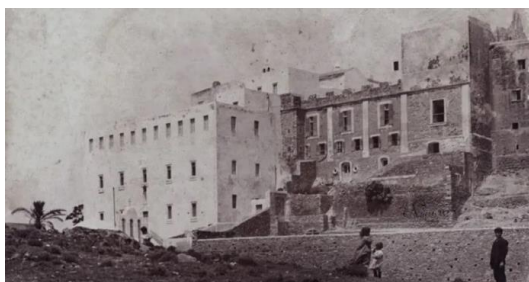
Εικ. 1 Γαλλική Σχολή Ουρσουλινών στη Νάξο

https://naxospress.gr/exodos/ellada-sholi-oyrsoylinon-350-hronia-zois-kai-epeteiaki-ekdilosi/