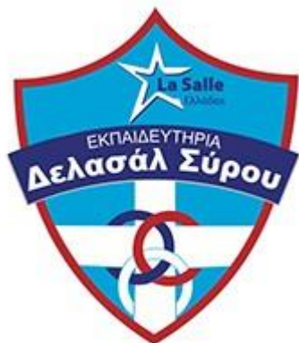
Εικ. 8. Έμβλημα εκπαιδευτηρίων Δελασάλ Σύρου

https://mlp-blo-g-spot.blogspot.com/2010/12/SaintPaulPiree.html