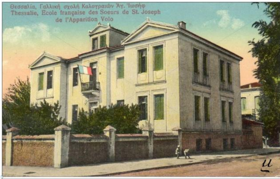
Εικ. 4. Γαλλική Σχολή καλογραιών Saint-Joseph Βόλου