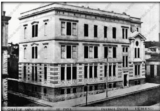
Εικ. 7. Ελληνογαλλική Σχολή Πειραιά Saint-Paul

4CCyQEqv4A:1692768499413&q=%CE%B5%CE%BB%CE%BB%CE%B7%CE%BD%CE%BF%CE%B3%CE%B1%CE%BB%CE%BB%CE%B9%CE%BA%CE%AE+%CF%83%CF%87%CE%BF%CE%BB%CE%AE+%CE%BA%CE%B1%CE%BB%CE%B1%CE%BC%CE%B1%CF%81%CE%AF&tbm=isch&source=lnms&sa=X&sqi=2&ved=2ahUKEwiHveClhvKAAxXX3AIHHSptDrgQ0pQJegQIDBAB&biw=1536&bih=707&dpr=1.25#imgrc=IHjxuvqisjUsVM&imgdii=0k_B2jTc0w31RM