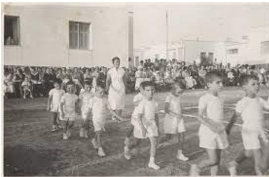
Εικ. 5. Ελληνογαλλική Σχολή Ουρσουλινών Αθήνα

https://www.google.gr/search?sca_esv=559287649&sxsrf=AB5stBga3hbxqfUYgcxCke4f0-n26km7HQ:1692767937720&q=%CE%B5%CE%BB%CE%BB%CE%B7%CE%BD%CE%BF%CE%B3%CE%B1%CE%BB%CE%BB%CE%B9%CE%BA%CE%AE+%CF%83%CF%87%CE%BF%CE%BB%CE%AE+%CE%BF%CF%85%CF%81%CF%83%CE%BF%CF%85%CE%BB%CE%B9%CE%BD%CF%8E%CE%BD+%CE%B1%CE%B8%CE%B7%CE%BD%CE%B1+%CF%80%CE%B1%CE%BB%CE%B9%CE%B5%CF%82+%CE%B5%CE%B9%CE%BA%CF%8C%CE%BD%CE%B5%CF%82&tbm=isch&source=Inms&sa=X&ved=2ahUKEwi3p_X8g_KAAxV42wIHHapRBDMQ0pQJegQIDBAB&biw=1536&bih=707&dpr=1.25#imgcr=LNKhAUVNdN-9QM