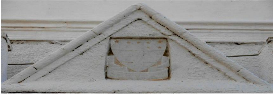
Εικόνα 12. Έμβλημα των μαθητριών της Σχολής Ουρσουλινών-Μονής στο Κάστρο της Χώρας Νάξου