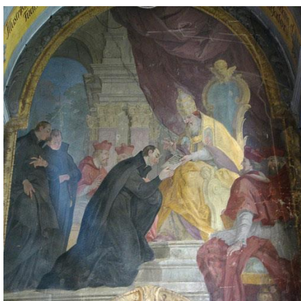
Εικ. 11. Ο Ιγνάτιος Λογίολα, ιδρυτής του τάγματος Ιησουϊτών, μαζί με τους πρώτους συντρόφους .

https://www.facebook.com/neasmyrni.leonteios/photos/a.386295074716709/4423891994290310/