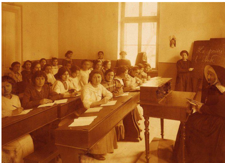
Εικ. 2 Ελληνογαλλική Σχολή «Άγιος Ιωσήφ»-École «Saint Joseph»

https://naxospress.gr/exodos/ellada-sholi-oyrsoylinon-350-hronia-zois-kai-epeteiaki-ekdilosi/