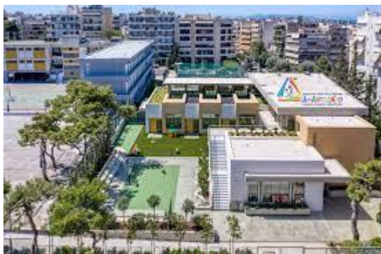
Εικ. 10. Λεόντειο Λύκειο Νέας Σμύρνης

https://eall.gr/%CE%BB%CE%B5%CF%8C%CE%BD%CF%84%CE%B5%CE%B9%CE%BF-%CE%BB%CF%8D%CE%BA%CE%B5%CE%B9%CE%BF/