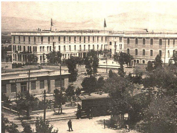
Εικ. 9. Λεόντειο Λύκειο Πατησίων

https://sgschool.gr/%CE%B4%CE%B7%CE%BC%CE%BF%CF%84%CE%B9%CE%BA%CF%8C/