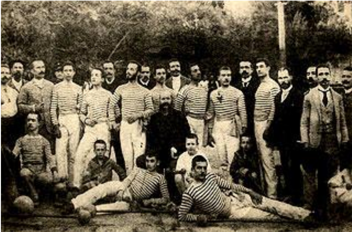
Ο Ιωάννης Φωκιανός, ιδρυτής του Πανελληνίου Γυμναστικού Συλλόγου, μαζί με αθλητές στο Κεντρικό Γυμναστήριο το 1889. Αθήνα, Αθλητικό Μουσείο ΟΝΑ Δήμου Αθηναίων. Η δόξα του αθλητισμού. Η ιστορία του ελληνικού αθλητισμού και οι διεθνείς του επιτυχίες, Δήμος Αθηναίων-Πολιτισμικός Οργανισμός, Αθήνα 2002, σ. 44-45, εικ. 38