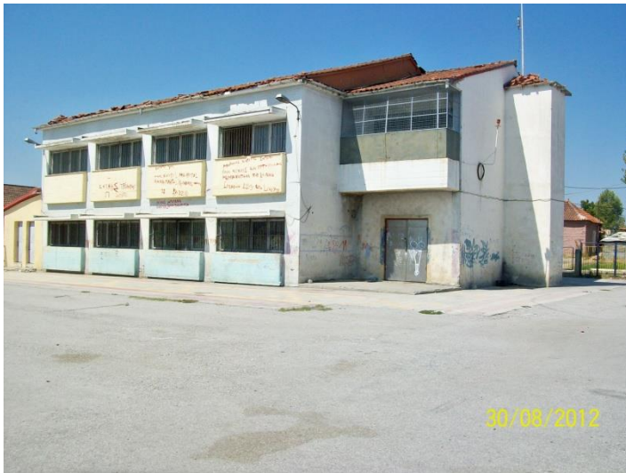
4 ο Δημοτικό Ρομά.