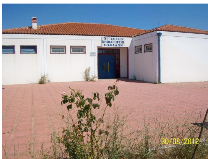
5° Νηπιαγωγείο Ρομά.