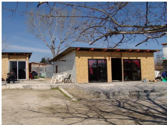
Κατοικία των Ρομά από νοβοπάν, αλουμίνιο & τσιμεντένια βάση.