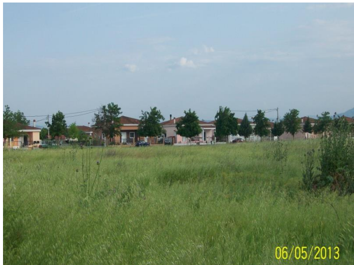
Τσιγγάνικος οικισμός «Νέα Ζωή».