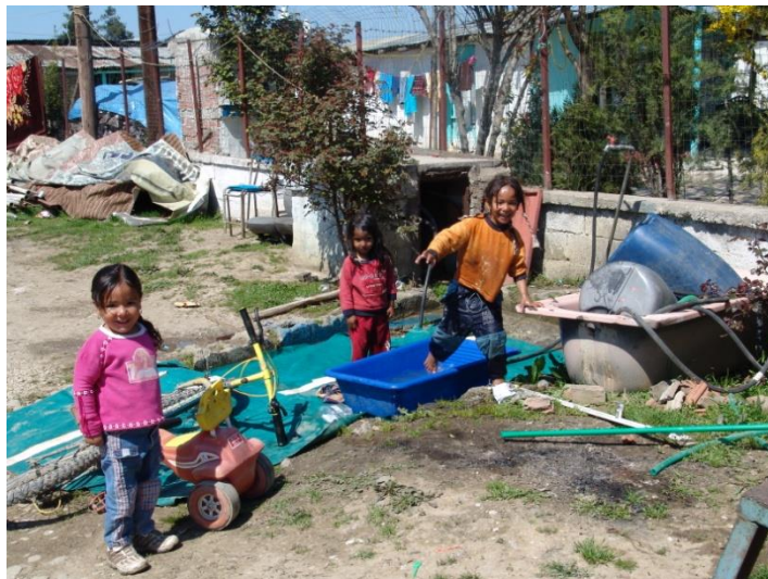
Εικόνες από την καθημερινή ζωή των τσιγγανοπαίδων.