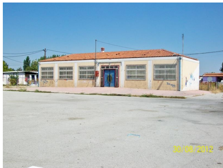
4ο Νηπιαγωγείο Ρομά.