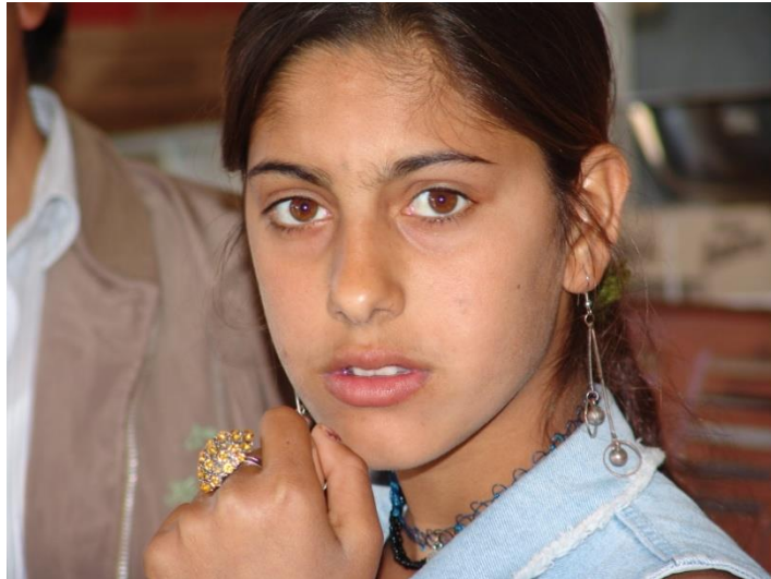
Φυσική ομορφιά ρόμισσας.