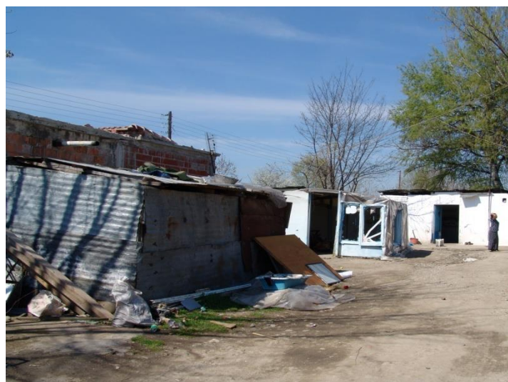
Εγκαταλελειμμένες αυτοσχέδιες κατοικίες.