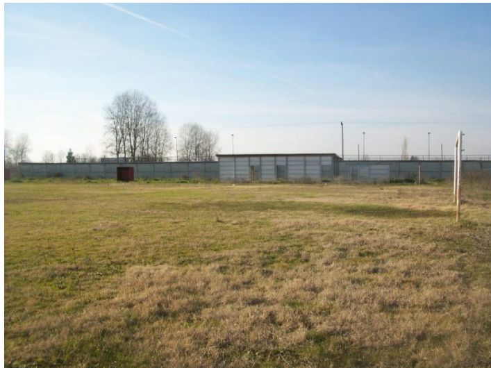
Εγκαταλελειμμένο γήπεδο Ρομά.