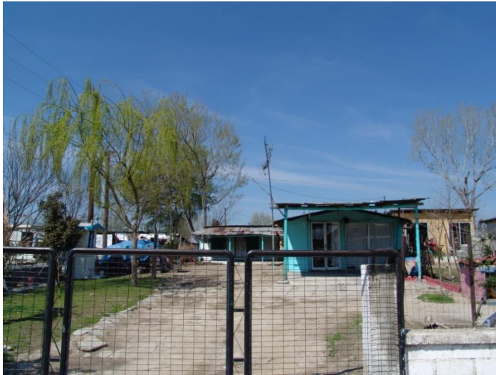
Ορισμένα παραπήγματα διαθέτουν & μια στοιχειώδη περίφραξη.