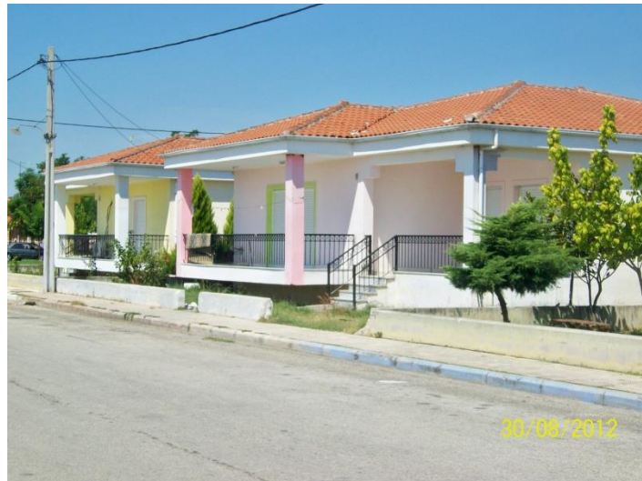
Όλες οι κατοικίες στον νέο οικισμό έχουν την ίδια αρχιτεκτονική κατασκευή.