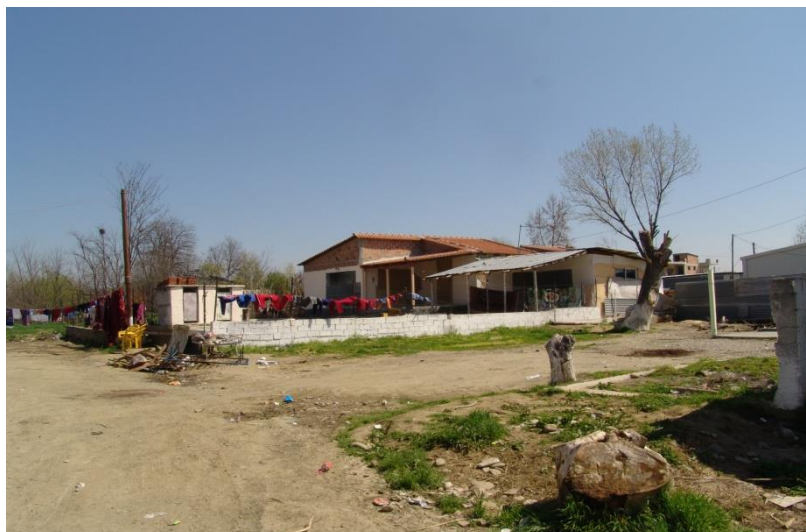
Όσο απομακρύνεται κανείς από το κέντρο του οικισμού συναντάει μόνο χωματόδρομους.