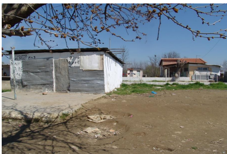
Αυτοσχέδια κατοικία από αλουμίνιο & τσιμεντένια βάση.