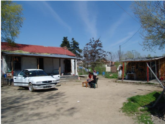
Δίπλα από το χαμόσπιτο ζουν συνήθως οι γονείς του συζύγου.