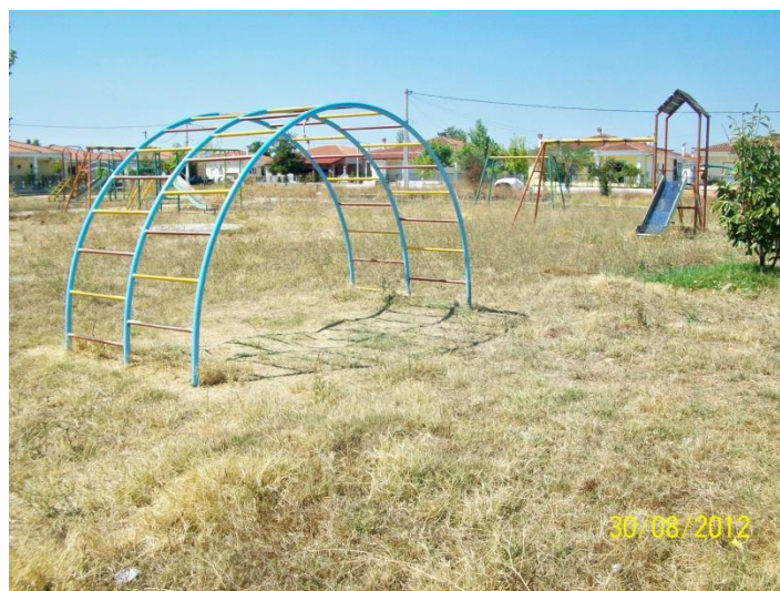
Παιδική χαρά οικισμού.