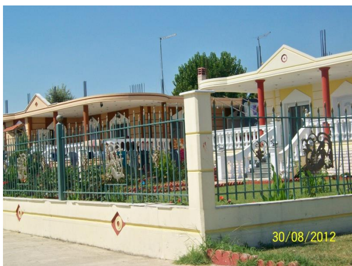
Σύγχρονες κατοικίες των Ρομά.