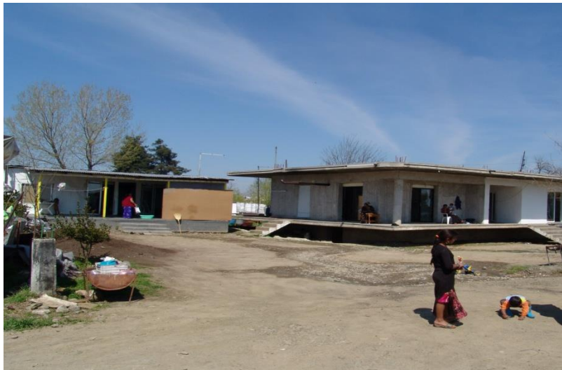
Οι γειτονικές κατοικίες είναι κατοικίες συγγενών.