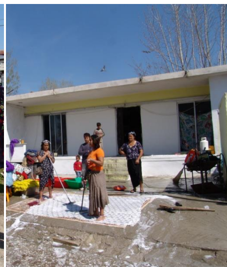
Το πλύσιμο των χαλιών & γενικά του νοικοκυριού γίνεται στην αυλή του σπιτιού.