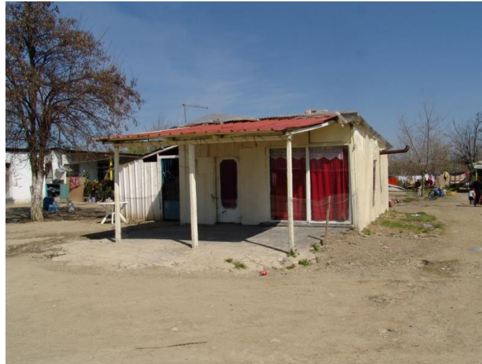
Στις αυτοσχέδιες κατοικίες των Ρομά απουσιάζει η σύγχρονη αυλή.