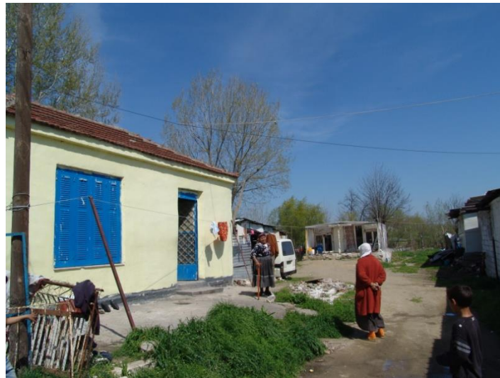
Οι γερρόντισσες του οικισμού βρίσκουν πάντα χρόνο για να συζητήσουν στον εξωτερικό χώρο.