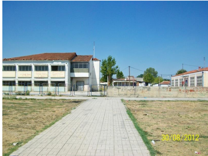
Το 5ο Δημοτικό & το 4ο Νηπιαγωγείο των Ρομά στεγάζονται στον ίδιο χώρο.