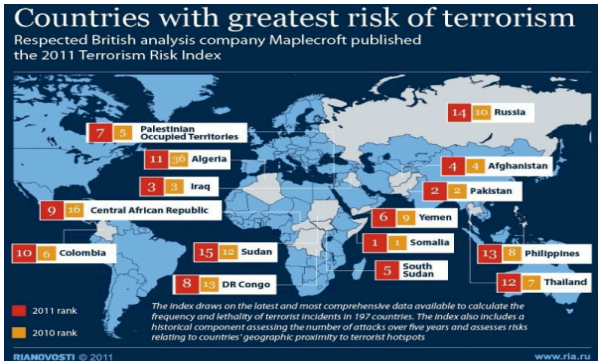
Εικόνα 3 Χώρες με το μεγαλύτερο κίνδυνο τρομοκρατικών επιθέσεων 2011.