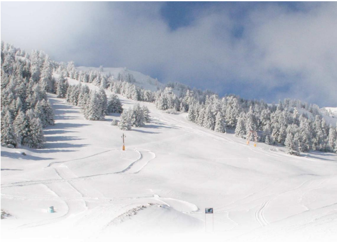
Εικ.12 Το χιονοδρομικό κέντρο του Μαινάλου.