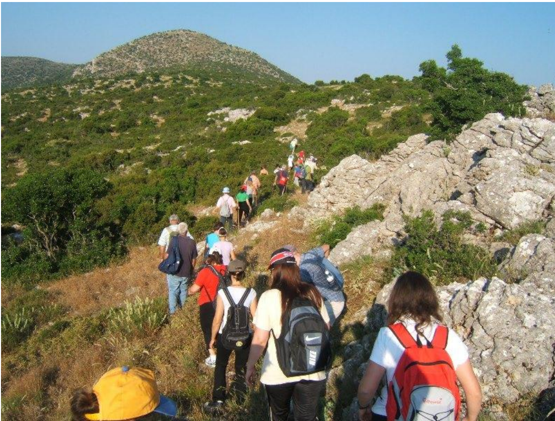
Εικ.14 Στιγμιότυπο πεζοπορίας στο Μαίναλο.