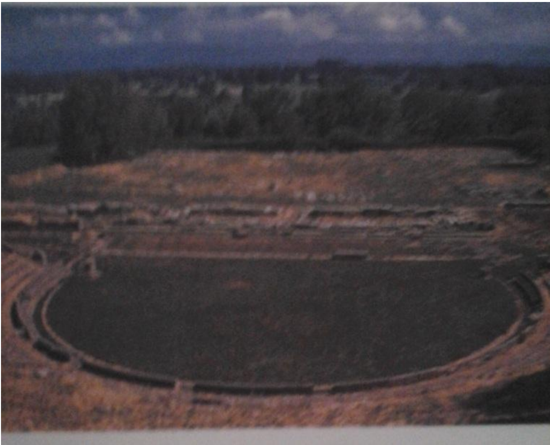
Εικ.3 Το αρχαίο θέατρο της Μεγαλόπολης.