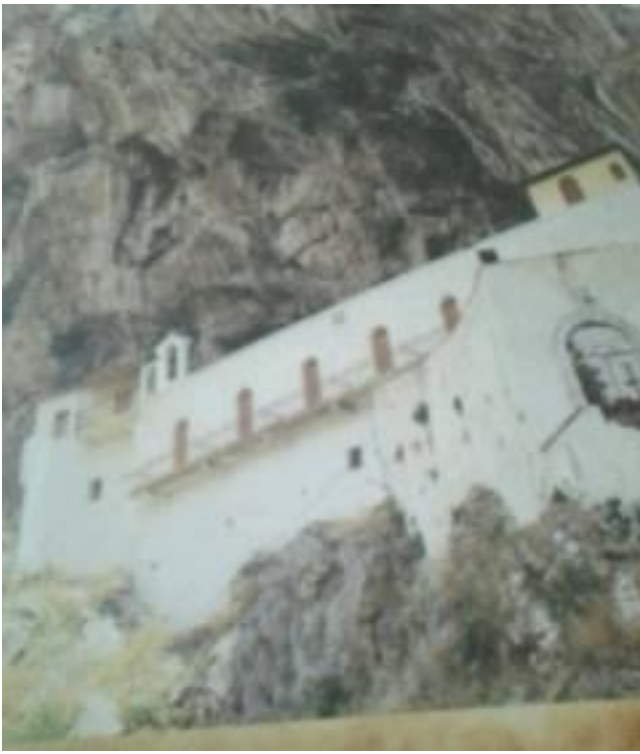
Εικ.6 Η Ιερά Μονή Παναγίας στην Κανδήλα (δήμος Τρίπολης).