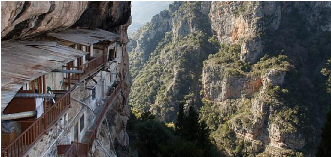
Εικ.8 Η Ιερά Μονή Τιμίου Προδρόμου Γορτυνίας.