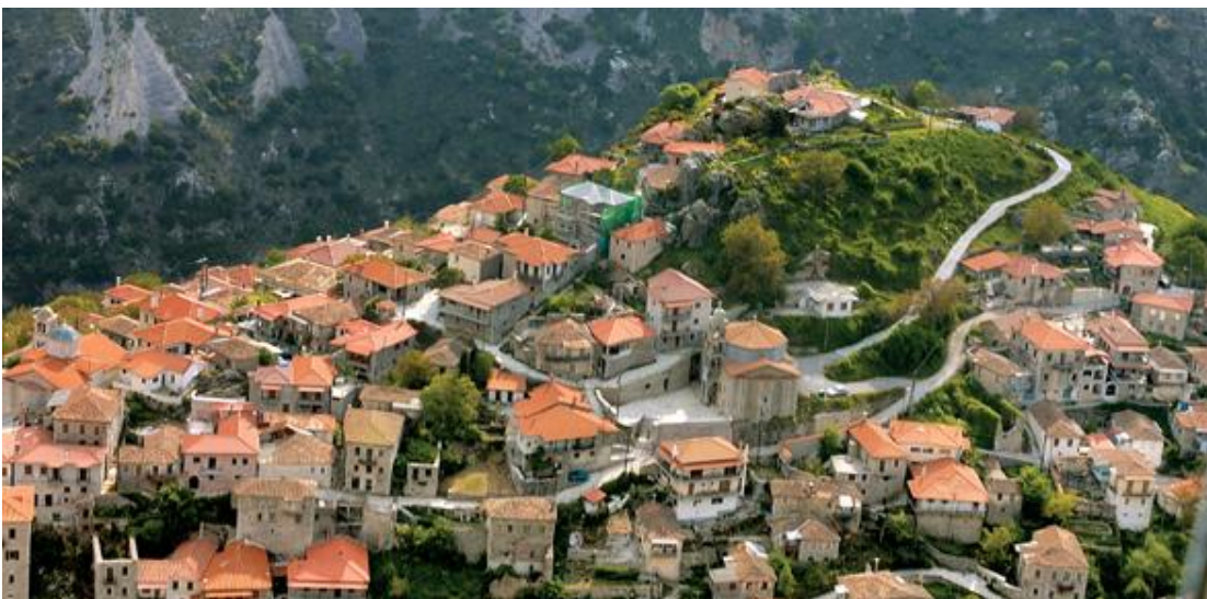
Εικ.9 Ο παραδοσιακός οικισμός Δημητσάνας (δήμος Γορτυνίας).