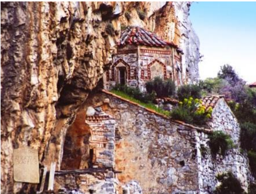
Εικ.7 Η Ιερά Μονή Φιλοσόφου Γορτυνίας.