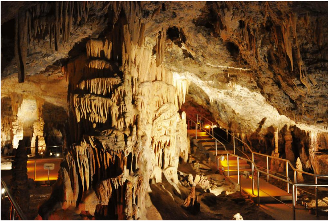
Εικ.15 Το εσωτερικό του Σπηλαίου Κάψια.