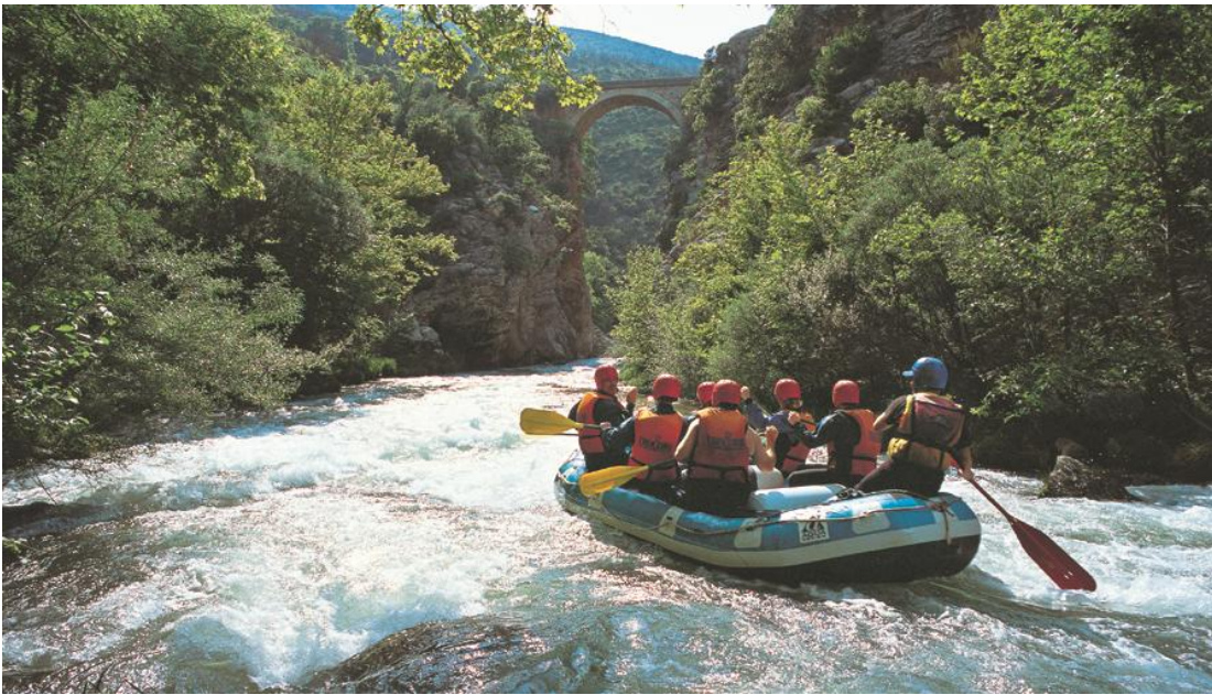
Εικ.13 Δραστηριότητα ράφτινγκ στον ποταμό Λούσιο, Γορτυνία.