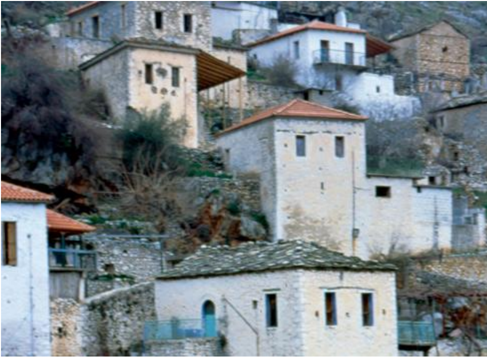
Εικ.10 Τσακόνικα αρχοντικά, Πραστός, χωριό Πάρνωνα.