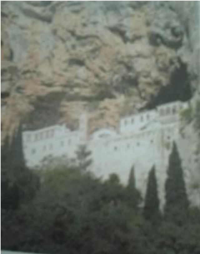
Εικ.5 Η Ιερά Μονή Αγίου Νικολάου Σίτζας στο Λεωνίδιο.