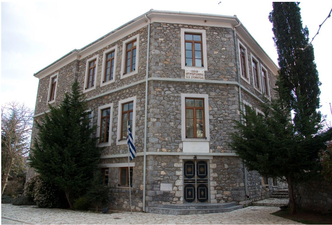
Εικ.11 Η Σχολή Αργυροχρυσοχοΐας στην Στεμνίτσα.