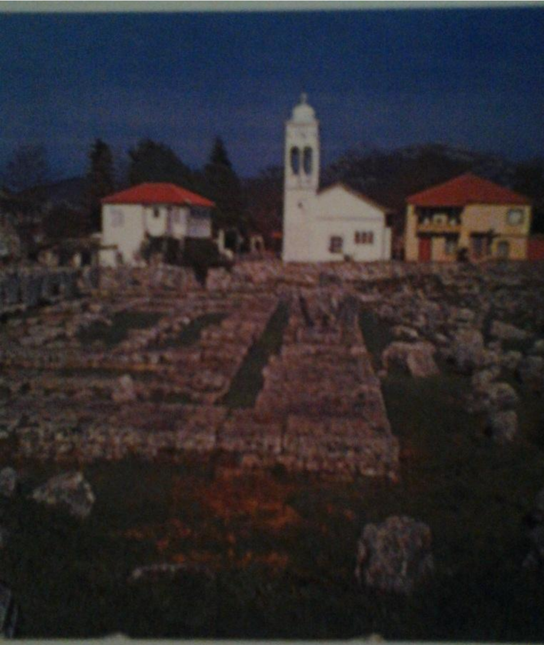
Εικ.1 Ο ναός της Αλέας Αθηνάς στην Τεγέα.