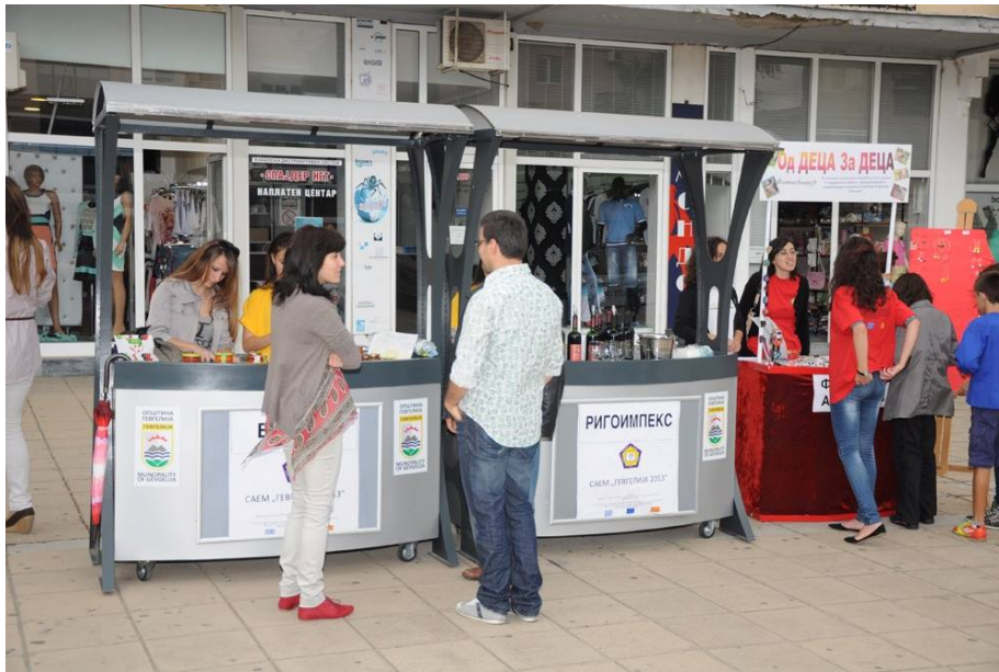
Εικόνα 6: Καμπάνιες προώθησης & ενημέρωσης με επιχειρηματίες και από τις δύο χώρες συνεργασίας

Οι δράσεις του έργου οργανώνονται σε πέντε πακέτα εργασιών όπως αναλύονται παρακάτω: