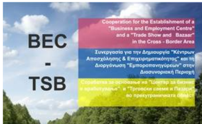
Εικόνα 5: Η αφίσα του Έργου

Είναι ευρέως αποδεκτό ότι ο επιχειρηματικός τομέας είναι ο πρώτος που ενώνει άτομα από διαφορετικές ομάδες και τους διδάσκει να συνεργάζονται και να αποδέχονται ο ένας τον άλλον. Ταυτόχρονα, επιφέρει ανάπτυξη και ευημερία ενώ ταυτόχρονα μπορεί να ενδυναμώσει τις εμπορικές σχέσεις αλλά και την κουλτούρα κοινής ανάπτυξης. Οι Δήμοι Genvelija και Παιονίας διαθέτουν μακρά εμπειρία και συνεργασία αναφορικά με την υποστήριξη της επιχειρηματικότητας και της απασχόλησης στην περιοχή η οποία τους οδήγησε στο συμπέρασμα ότι για τη βελτίωση της υφιστάμενης οικονομικής κατάστασης στη διασυνοριακή περιοχή θα πρέπει να εισάγουν θεσμούς και φορείς που θα υποστηρίζουν την προσπάθεια σε συστηματική βάση.