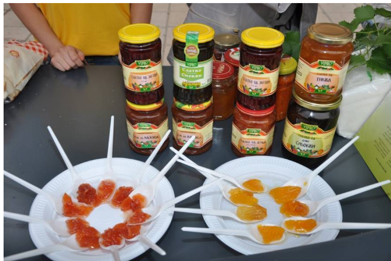
Εικόνα 7: Εκθέσεις τοπικών προϊόντων

Μετά την ολοκλήρωση της υλοποίησης του έργου έχει αναπτυχθεί ένα σχέδιο διαχείρισης και συντονισμού με πλατφόρμα IT, μέσα από την οποία οργανώθηκαν με επιτυχία σεμινάρια και workshop για τη βελτίωση των γνώσεων σχετικά με τη διαχείριση των ανθρώπινων πόρων όπως: