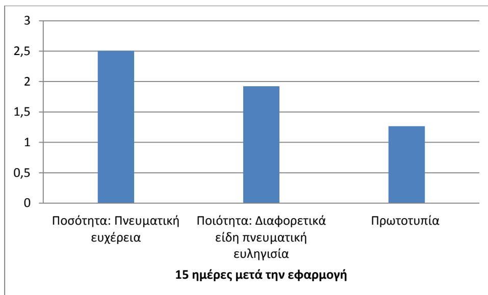
Σχεδιάγραμμα 2: Εφαρμογή 2 ου ερωτηματολογίου (μετά από δεκαπέντε ημέρες)

Συγκρίνοντας τα στατιστικά αποτελέσματα όσο αφορά το αρχικό ερευνητικό ζήτημα και την κύρια υπόθεση, την υπόθεση 1 ότι : Η Δραματική Τέχνη στην Εκπαίδευση αναμένεται να έχει θετικά αποτελέσματα στην ενίσχυση του δημιουργικού γραψίματος /δημιουργική γραφή των μαθητών της Δ' τάξης του Δημοτικού σχολείου. Η οποία επιβεβαιώνεται, αφού θετικά αποτελέσματα ή μικρή απόκλιση στην σύγκριση των υπό –ερωτημάτων, δηλαδή η υπόθεση 1.1: Η Δραματική Τέχνη στην Εκπαίδευση μέσω της Δημιουργικής Γραφής αναμένεται να έχει θετικά αποτελέσματα στην ποσότητα των ιδεών (νοητική ευχέρεια) των μαθητών της Δ' τάξης του Δημοτικού σχολείου. Όπου έχουμε τα αρχικά αποτελέσματα 2,313253 έναντι του 2,506329114. Η υπόθεση 1.2: Η Δραματική Τέχνη στην Εκπαίδευση μέσω της Δημιουργικής Γραφής αναμένεται να έχει θετικά αποτελέσματα στην ποικιλία των ιδεών (νοητική ευελιξία) των μαθητών της Δ' τάξης του Δημοτικού σχολείου. Εδώ είχαμε στο πρώτο ερωτηματολόγιο 2,072289, ενώ στο δεύτερο έχουμε 1,924050633. Η υπόθεση 1.3: Η Δραματική Τέχνη στην Εκπαίδευση μέσω της Δημιουργικής Γραφής αναμένεται να έχει θετικά αποτελέσματα στην πρωτοτυπία των ιδεών των μαθητών της Δ' τάξης του Δημοτικού σχολείου. Στο υποερώτημα αυτό εμφανίσθηκαν τα αρχικό ποσοστό 1,253012 έναντι του τελικού 1,265822785.