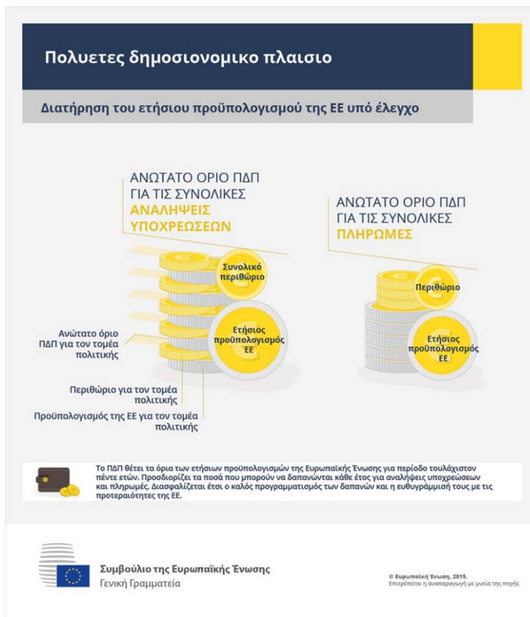
Εικόνα 1 – Πολυετές δημοσιονομικό πλαίσιο

Κατανοώντας, λοιπόν, τη σημασία της Αστικής Ατζέντας, η συγκεκριμένη μελέτη θα διερευνήσει και θα αξιολογήσει τον ρόλο της, μέσα από την παρουσίαση των πρακτικών χρηματοδότησης των ΟΤΑ και τη μελέτη περίπτωσης του Δήμου Αγίου Δημητρίου. Ειδικότερα, στο πρώτο κεφάλαιο θα παρουσιαστεί και θα αναλυθεί η περιφερειακή πολιτική, ενώ θα αξιολογηθεί η ιστορική εξέλιξη της πολιτικής συνοχής έως την εποχή μας και θα παρουσιαστεί η χωρική/εδαφική διάσταση στην νέα προγραμματική περίοδο 14-20, με απώτερο στόχο την κατανόηση του περιεχομένου και του ρόλου της. Στο επόμενο κεφάλαιο θα δοθεί έμφαση στην ανάλυση του περιεχομένου και του ρόλου της Αστική Ατζέντα και των ΟΤΑ σε ευρωπαϊκό επίπεδο και θα παρουσιαστεί η περίπτωση της Habitat 3.