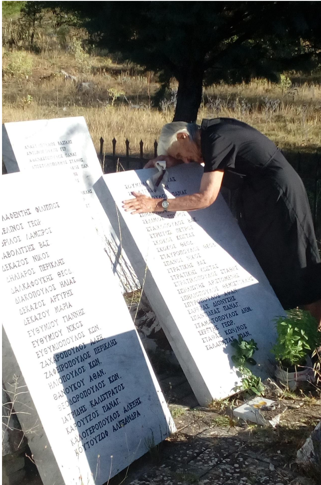
Εικ.4: Η γιαγιά μου αντικρίζοντας για πρώτη φορά το όνομα του πατέρα της στη μαρμάρινη πλάκα.