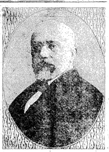
Ο ΠΡΩΤΑΓΟΝΙΣΤΗΣ ΤΗΣ ΤΟΥΡΚΙΚΗΣ ΣΥΝΘΗΚΗΣ