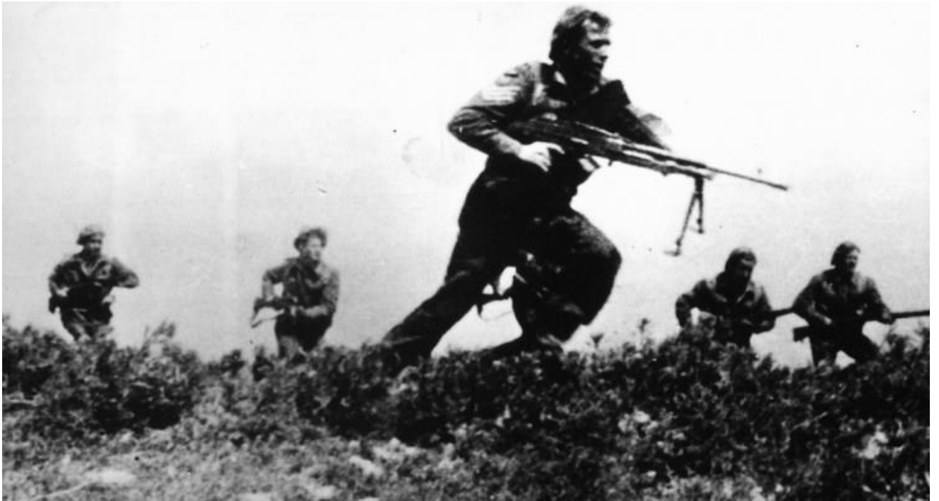
Έλληνες αγωνιστές σε πολεμικές επιχειρήσεις στη Μέση Ανατολή