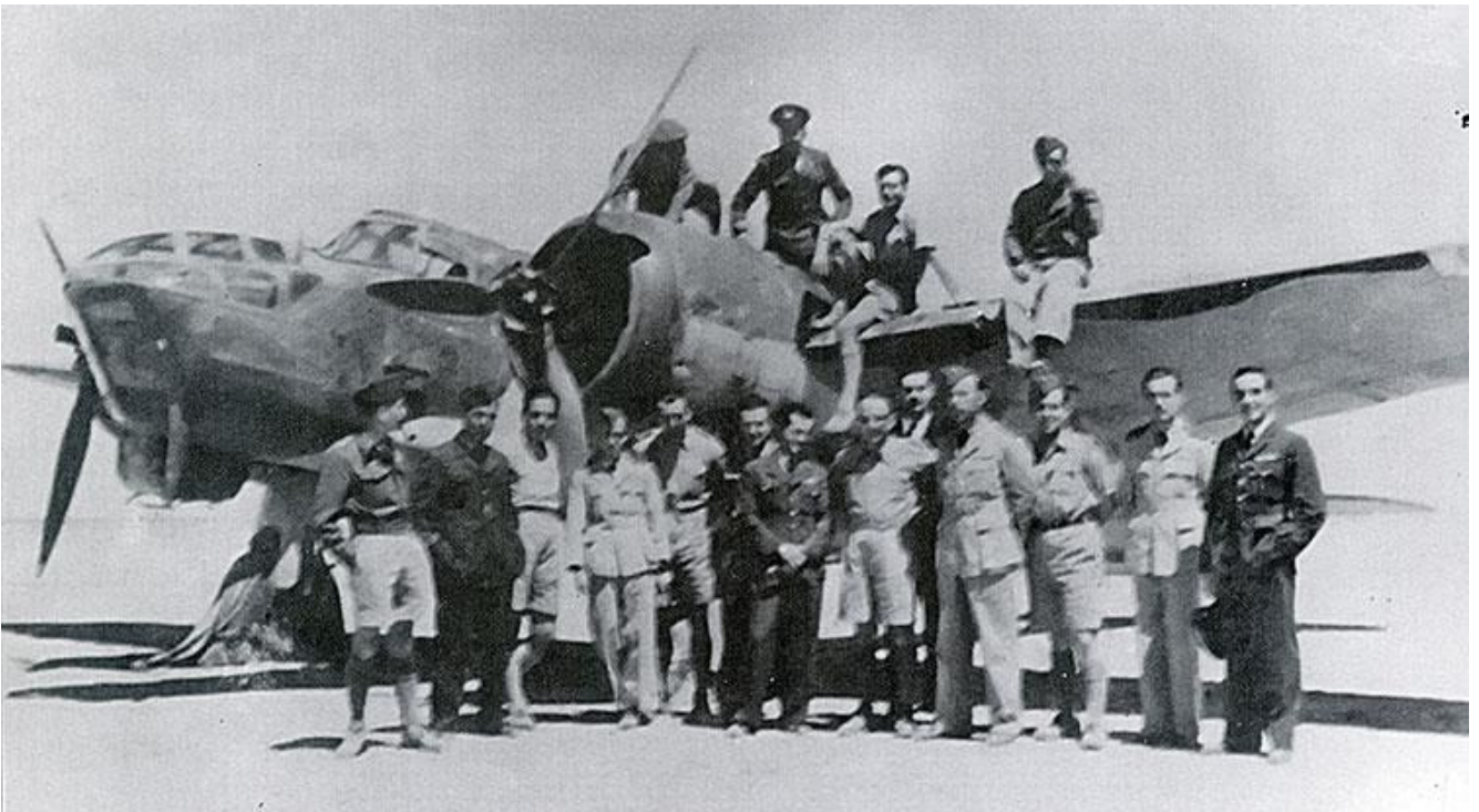
Μέλη της ελληνικής πολεμικής αεροπορίας στη Μέση Ανατολή