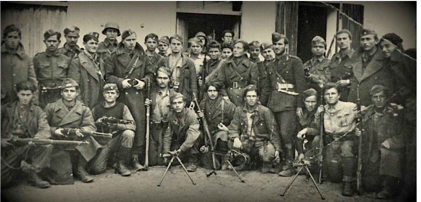
Έλληνες αγωνιστές της Εθνικής Αντίστασης