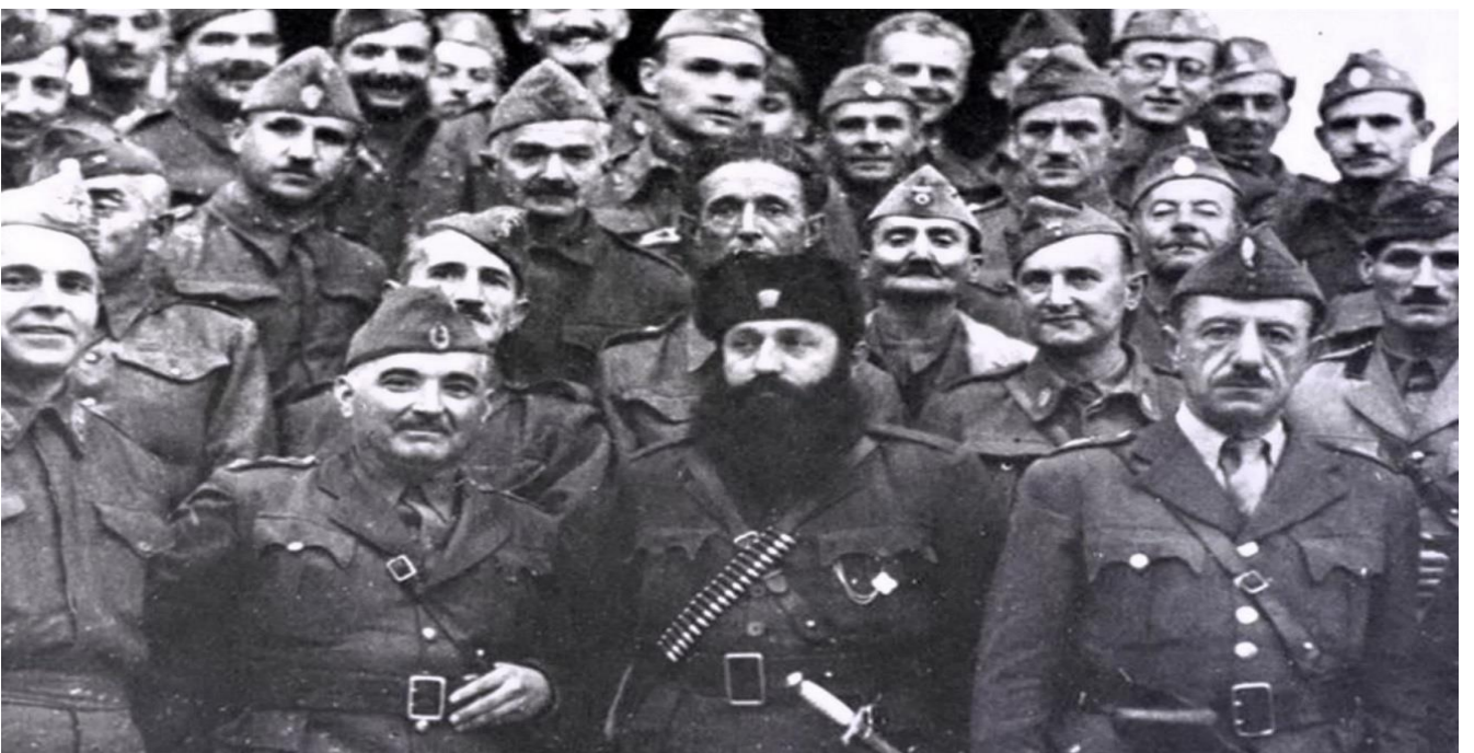
Ο Άρης Βελουχιώτης, μαζί με μέλη του ΕΑΜ