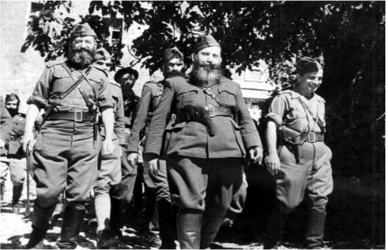
Ο Ναπολέων Ζέρβας, συνοδευόμενος από μέλη του ΕΔΕΣ