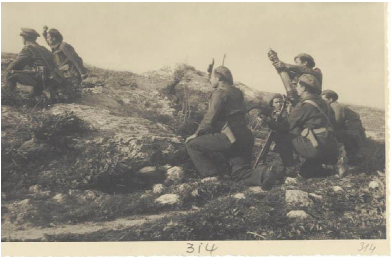
Συμμετέχοντες Έλληνες στην θρυλική μάχη του Ελ Αλαμείν