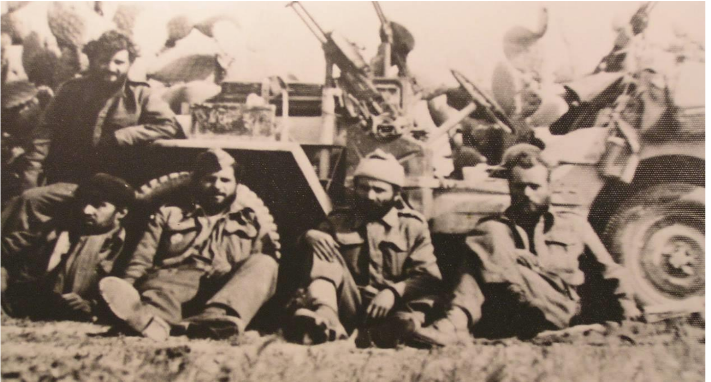
Ιερολοχίτες, οι πρώτοι Έλληνες κομάντος της εποχής