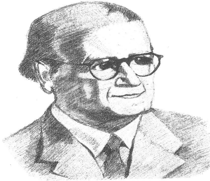
Μανόλης Τριανταφυλλίδης (1883 - 1959)