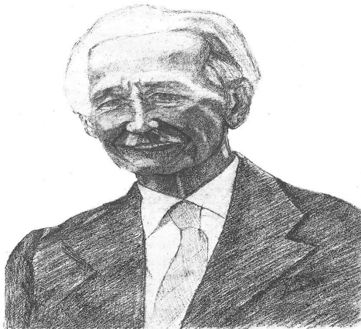
Αλέξανδρος Δελμούζος (1880 - 1956)