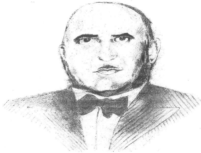
Δημήτρης Γληνός (1882 - 1943)