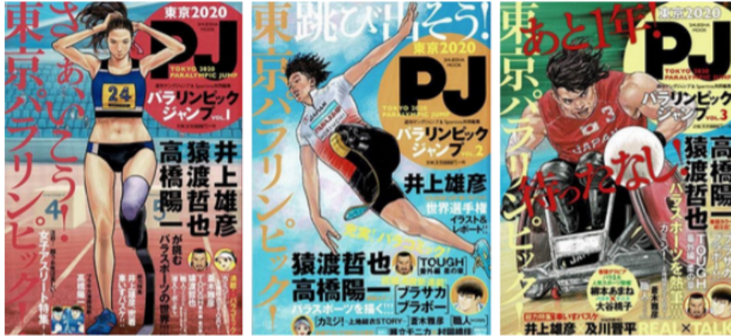
Εικόνα 3.3: Ιαπωνικά κόμικ (PJ) με πρωταγωνιστές αθλητές Παραολυμπιακών Αγώνων.

συγγραφέας εξηγεί ότι απαιτούνται πολλές προσπάθειες με συμμετοχή ατόμων με αναπηρία και των οργανισμών που σχετίζονται με τους Π.Α και τα ΑμεΑ ώστε να δημιουργηθεί η κατάλληλη Παραολυμπιακή κληρονομιά (Veere, 2020) .