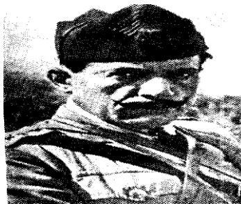
Εικόνα 5: Ο Κονδύλης Συνταγματάρχης το 1920

Πηγή: Στ. Μερκούρης, Γεώργιος Κονδύλης, ο κεραυνός 1879-1936 , Θεσσαλονίκη 2009, σ. 297