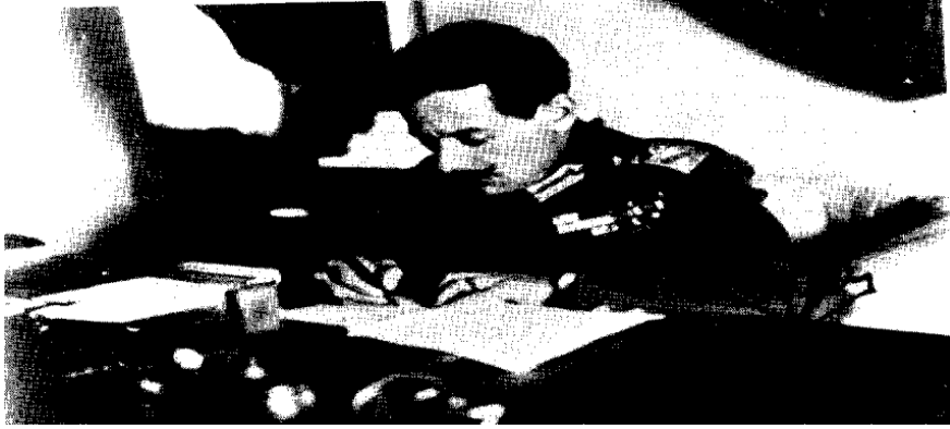
Εικόνα 6: Ο Γ. Κονδύλης αμέσως μετά την ανατροπή του Θ. Πάγκαλου