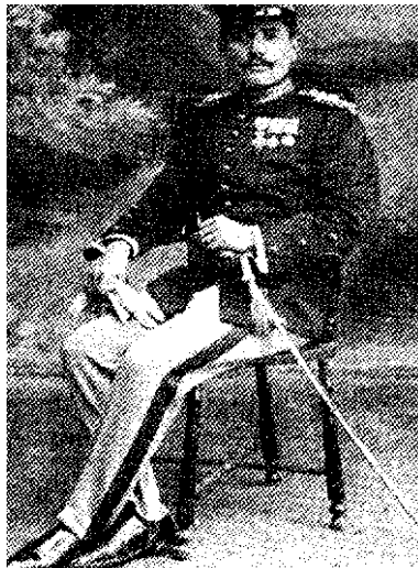
Εικόνα 4: Ο Λοχαγός Γ. Κονδύλης το 1916