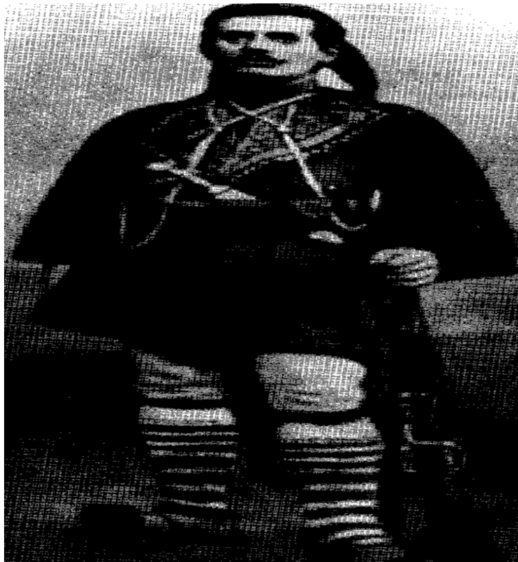
Εικόνα 2: Ο Γ. Κονδύλης στον Μακεδονικό Αγώνα