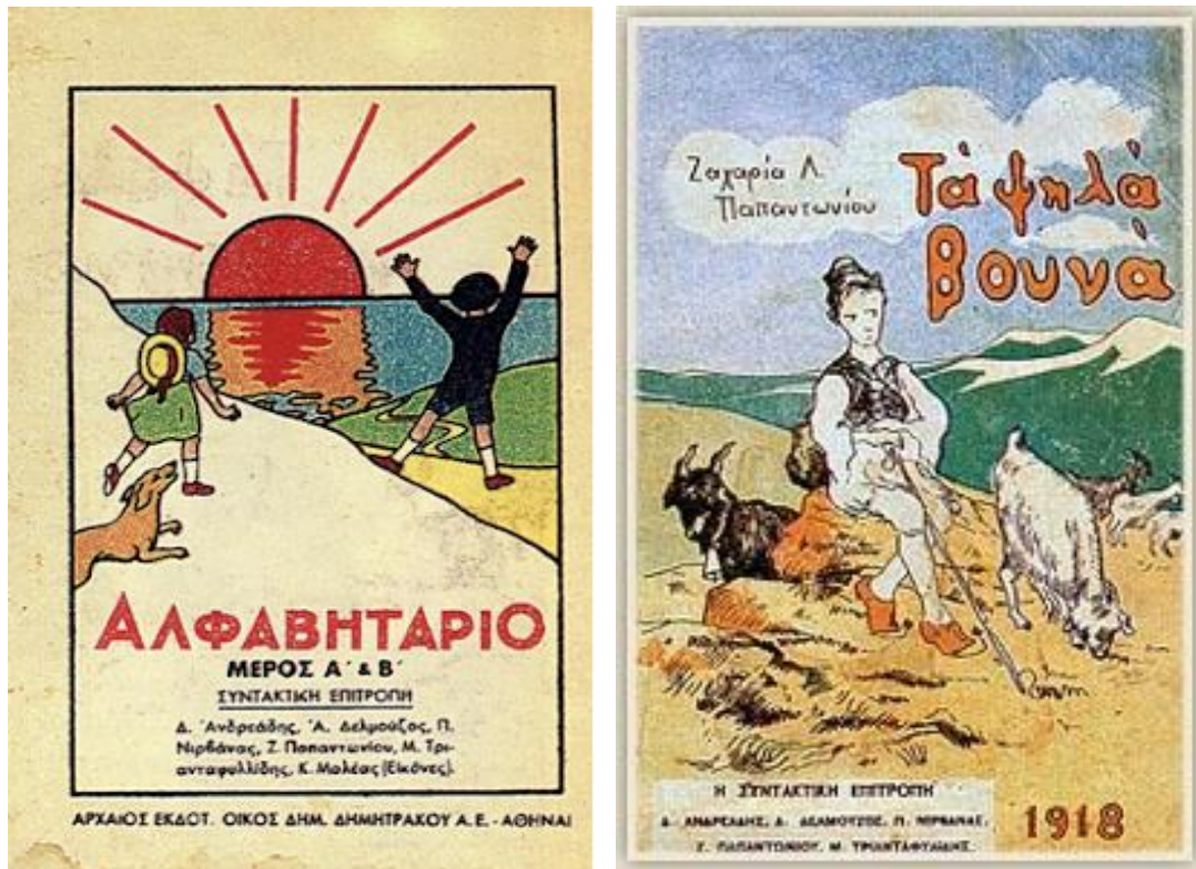
Εικόνες 13 και 14: Τα νέα αναγνωστικά μετά τη μετορρόθμιση του 1917