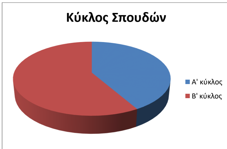
Γράφημα 3: Κύκλος σπουδών που παρακολουθούν οι συμμετέχοντες

Κύκλος σπουδών: Από το σύνολο των συμμετεχόντων, πέντε παρακολουθούσαν τον Α' κύκλο σπουδών, ενώ επτά παρακολουθούσαν τον Β' κύκλο σπουδών.