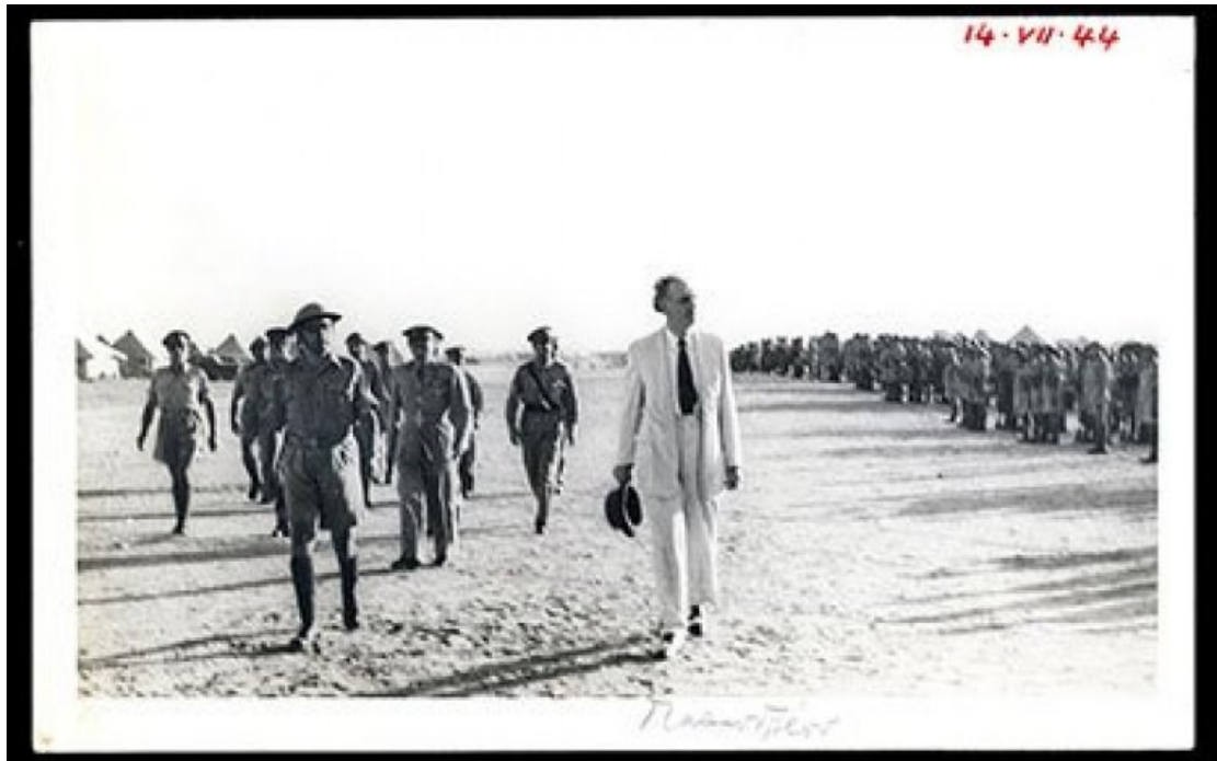
Ο Γεώργιος Παπανδρέου, πρωθυπουργός της εξόριστης ελληνικής κυβέρνησης επιθεωρεί τα ελληνικά στρατεύματα στη Μέση Ανατολή στις 14 Ιουλίου του 1944. Δωρεά της Πόπης Βεντήρη. Ιστορικά Αρχεία 269/27