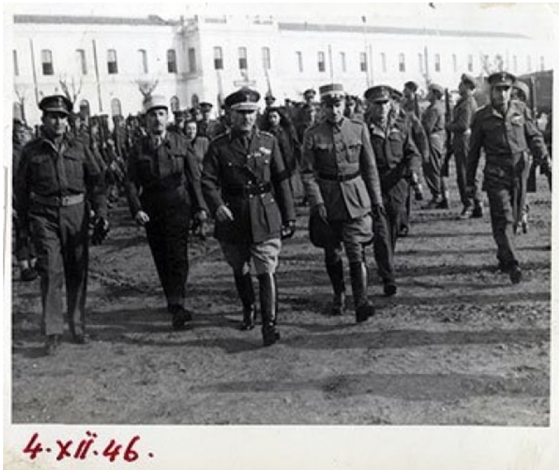
Επιθεώρηση στρατιωτικού τμήματος από τον Κωνσταντίνο Βεντήρη στις 4 Δεκεμβρίου του 1946. Φωτογραφία από το Αρχείο της Πόπης Βεντήρη. Ιστορικά Αρχεία 269/49