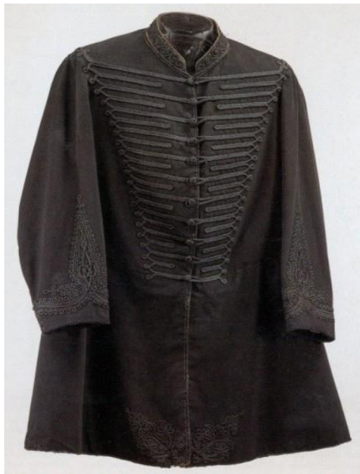
Το χιτώνιο από την ολόμαυρη στολή του Ιερού Λόχου που συστήθηκε τον Μάρτιο του 1821 από τον Αλέξανδρο Υψηλάντη στη Μολδοβλαχία