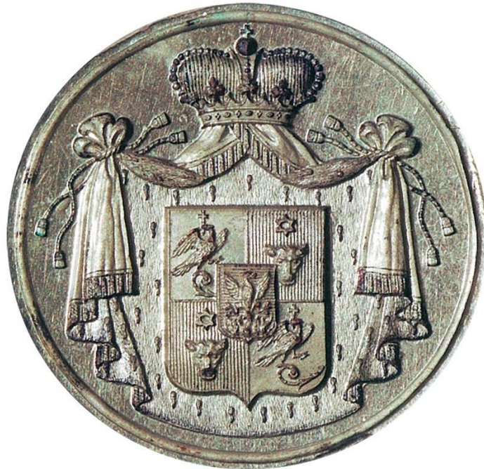
Σφραγίδα της οικογένειας Υψηλάντη, μέλη της οποίας διετέλεσαν ηγεμόνες της Μολδοβλαχίας