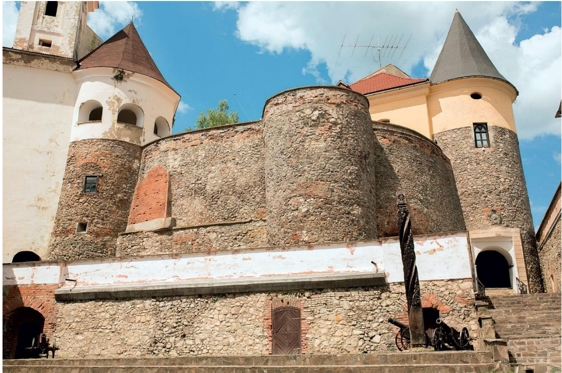
Το κάστρο του Μουνκάτς, στο οποίο φυλακίστηκε ο Αλέξανδρος Υψηλάντης από τον Ιούλιο του 1821 έως το 1823