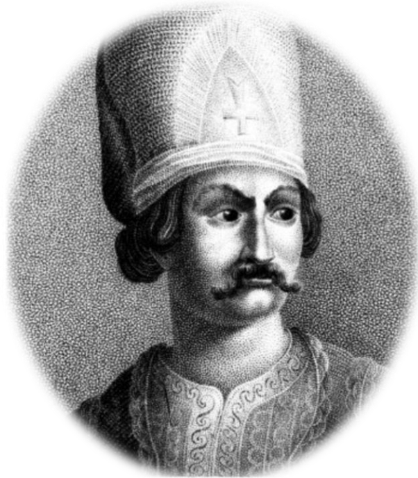
Αλέξανδρος Υψηλάντης: ο παππούς του πρωτεργάτη της Ελληνικής Επανάστασης