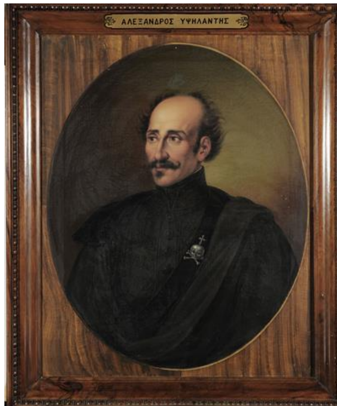
Προσωπογραφία του Αλεξάνδρου Υψηλάντη, ελαιογραφία σε μουσαμά του Διονυσίου Τσόκου, 1862