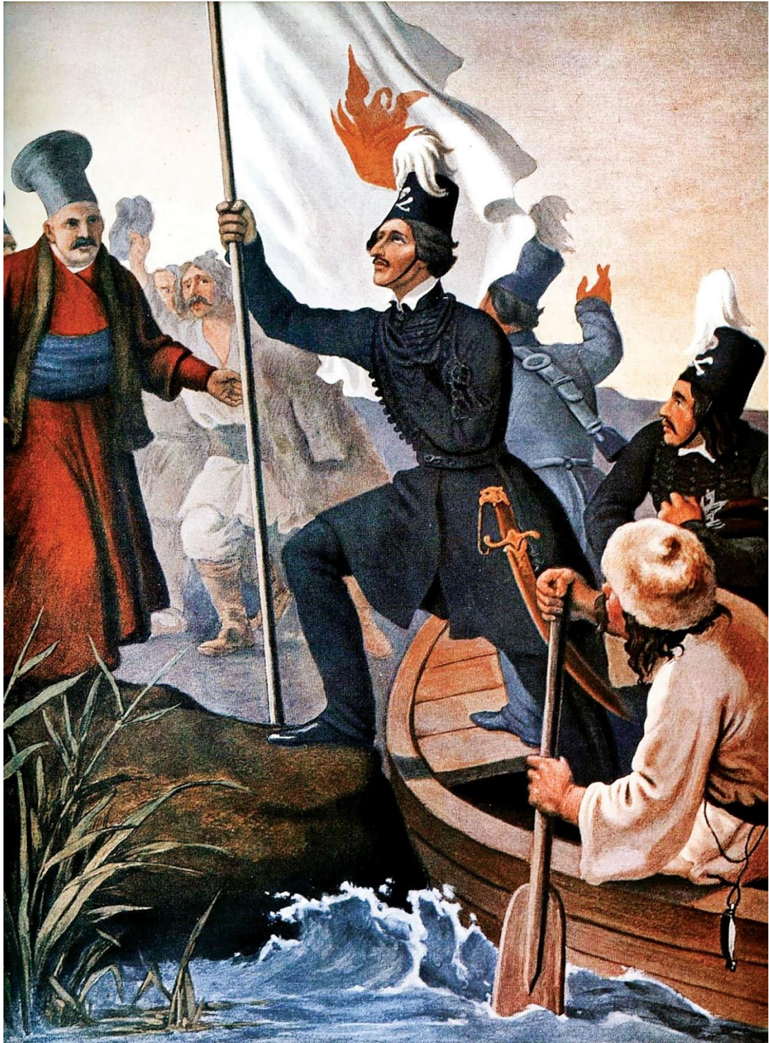
Peter von Hess, «Ο Αλέξανδρος Υψηλάντης περνά τον Προύθο ποταμό»