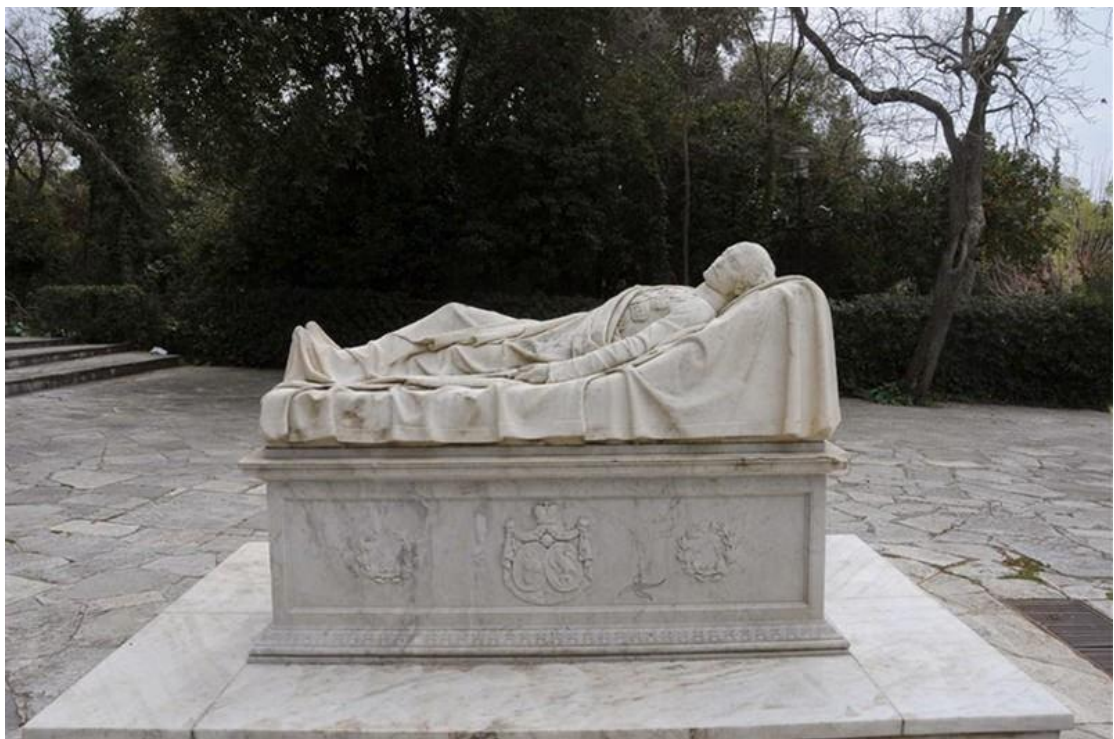
Το μνημείο του Αλέξανδρου Υψηλάντη στο Πεδίον του Άρεως