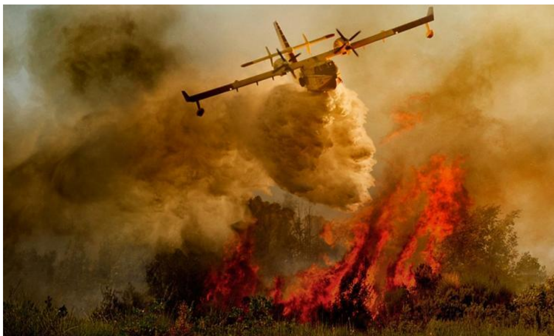
Εικόνα 3 https://www.evima.gr/eidiseis-evvoia/fotia-stin-evvoia-2021-2024-tria-chronia-meta-ton-pyrino-efialti/

Η πυρκαγιά στη βόρεια Εύβοια θεωρείται πλέον η μεγαλύτερη στην ιστορία της σύγχρονης Ελλάδας, με εκτιμήσεις να αναφέρουν ότι κάηκαν περίπου 600.000 στρέμματα δάσους. Από τις προκαταρκτικές εκτιμήσεις προέκυψε ότι σε αρκετές τοπικές κοινότητες, πάνω από το 80 % —και σε ορισμένες περιπτώσεις έως και το 100 %— της συνολικής έκτασης επλήγησαν. Από τα 512 031,54 στρέμματα που επλήγησαν από την πυρκαγιά, περίπου 379 392,82 στρέμματα ήταν δασώδη, αντιπροσωπεύοντας το 74,1 % της συνολικής καμένης έκτασης. Η τραγωδία συμβολίστηκε με ισχυρές εικόνες, ιδιαίτερα με μια φωτογραφία που κυκλοφόρησε ευρέως, στην οποία μια ηλικιωμένη γυναίκα στέκεται μέσα στην καταστροφή, με το πρόσωπό της χαραγμένο από την απόγνωση, τον φόβο και την αγανάκτηση — μια στοιχειωτική απεικόνιση του ανθρώπινου κόστους και του συναισθηματικού τραύματος που προκάλεσαν οι πυρκαγιές (EVIMATEAM, 2024).