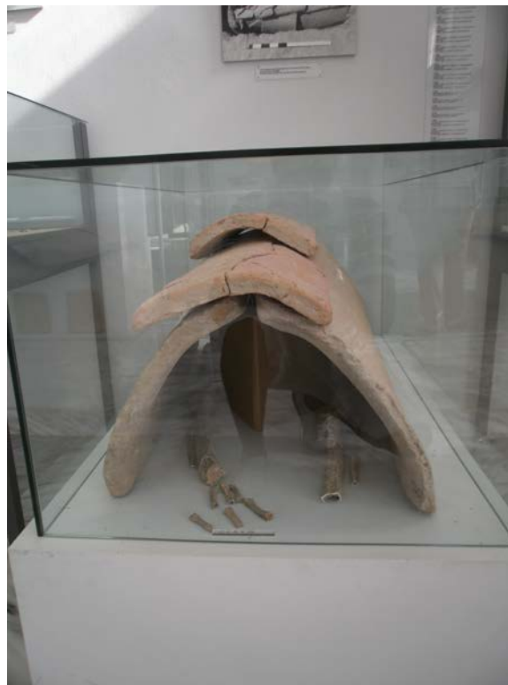
Εικ. 17: Προθήκη εντός του μουσείου με δείγμα ταφής νεκρού.