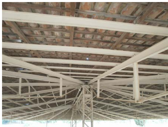
Εικ. 5: Στέγαστρο της περιοχής των Λουτρών. Είναι κατασκευασμένο από επαναχρησιμοποιημένες κεραμίδες που βρέθηκαν στην περιοχή.