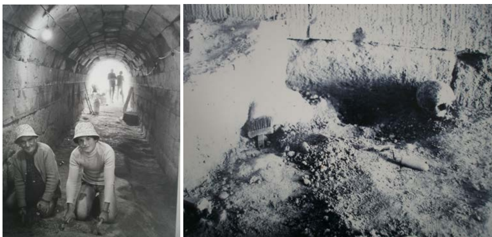
Εικ. 21: Φωτογραφίες από την διάρκεια των ανασκαφών εντός της στοάς του Σταδίου και της ανεύρεσης των ανθρώπινων λειψάνων του «τελευταίου παλαιοχριστιανού». Οι φωτογραφίες βρίσκονται αναρτημένες στους τείχους εντός του Μουσείου.