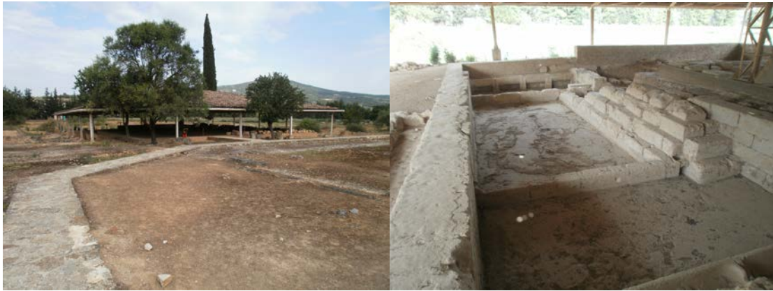
Εικ. 4: Φωτογραφίες από την περιοχή των Λουτρών.