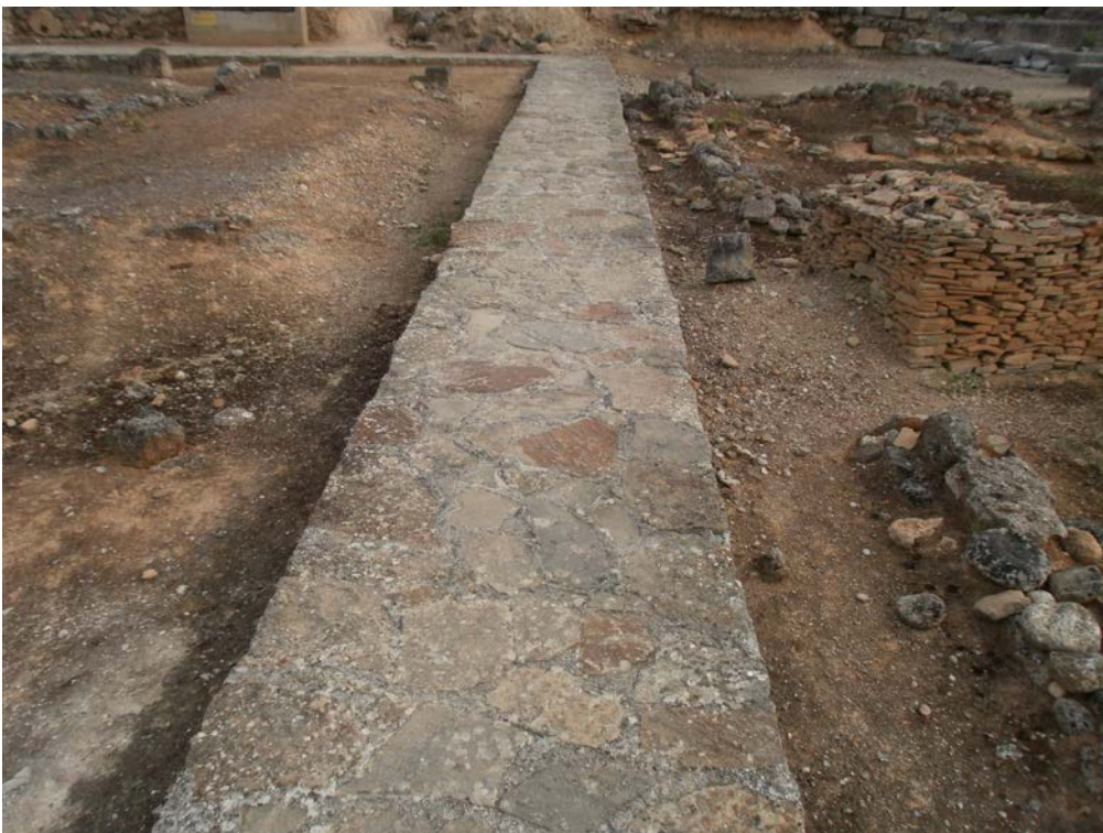
Εικ. 18: Άποψη του δρόμου που οδηγεί τον επισκέπτη από το Μουσείο στον αρχαιολογικό χώρο.