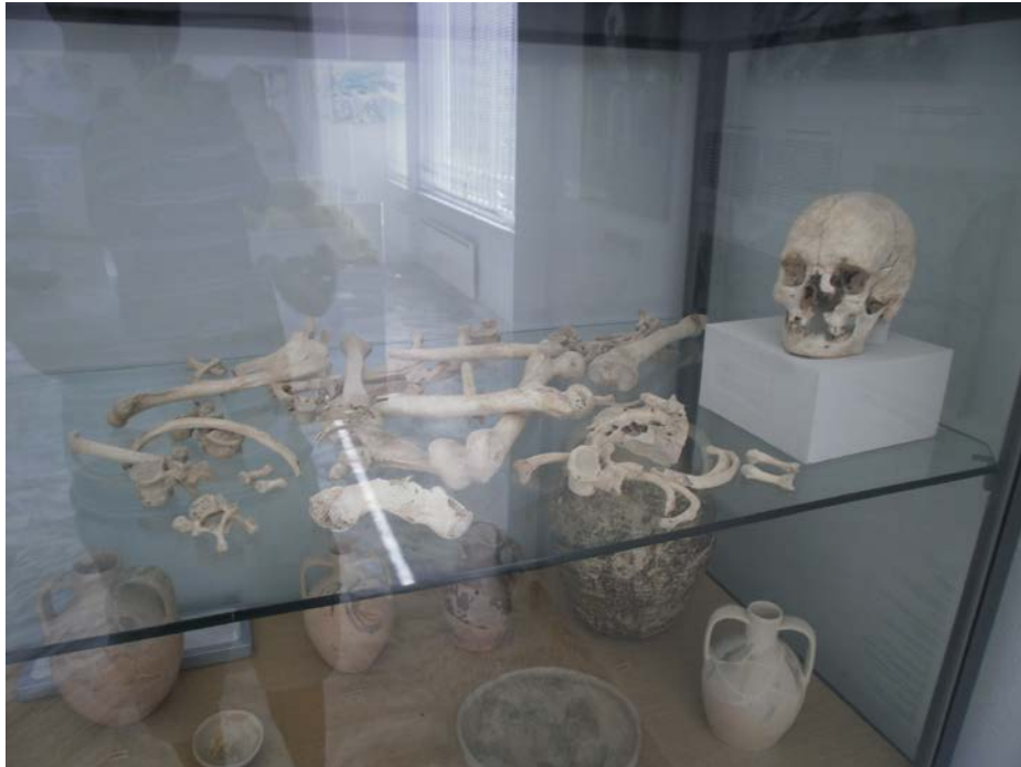
Εικ. 20: Προθήκη με τα οστά του «τελευταίου παλαιοχριστιανού».