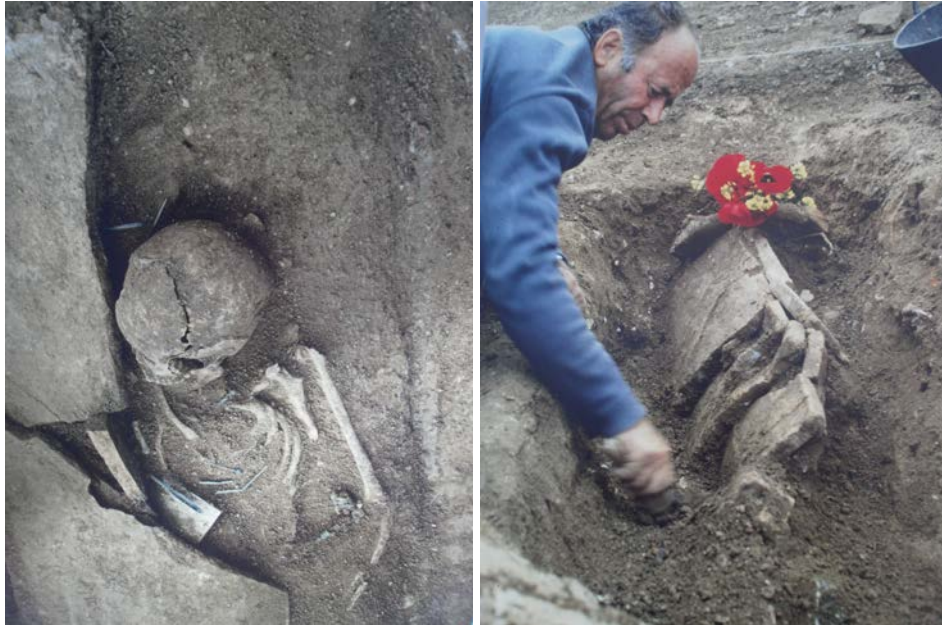
Εικ. 16: Φωτογραφίες κατά την διάρκεια των ανασκαφών. Εκταφή νεκρού.