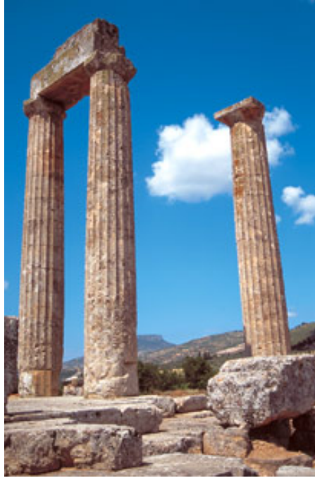
Εικ. 14: Ο ναός του Διός με τους τρεις κίονες πριν την αναστήλωση.