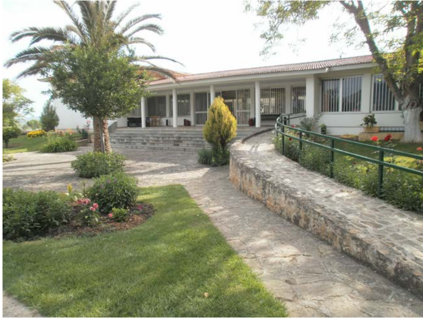
Εικ. 6: Άποψη από το εξωτερικό του μουσείου της Νεμέας.