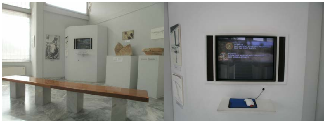
Εικ. 12: Χώρος προβολής οπτικο-ακουστικού υλικού με τη χρήση νέων τεχνολογιών για την περιοχή της Αρχαίας Νεμέας.