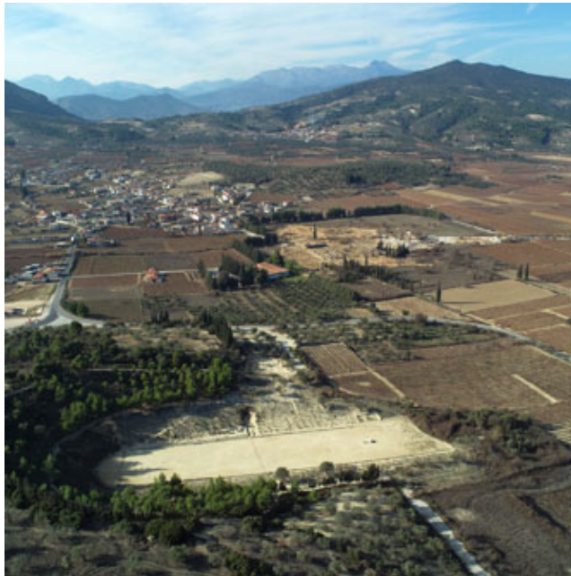
Εικ. 2.: Αεροφωτογραφία της Κοιλάδας της Αρχαίας Νεμέα από ανατολάς, με το Στάδιο. Σε πρώτο πλάνο στο κέντρο το Μουσείο (με την κόκκινη στέγη) και το Ιερό του Διός με τον Ναό δεξιά του.