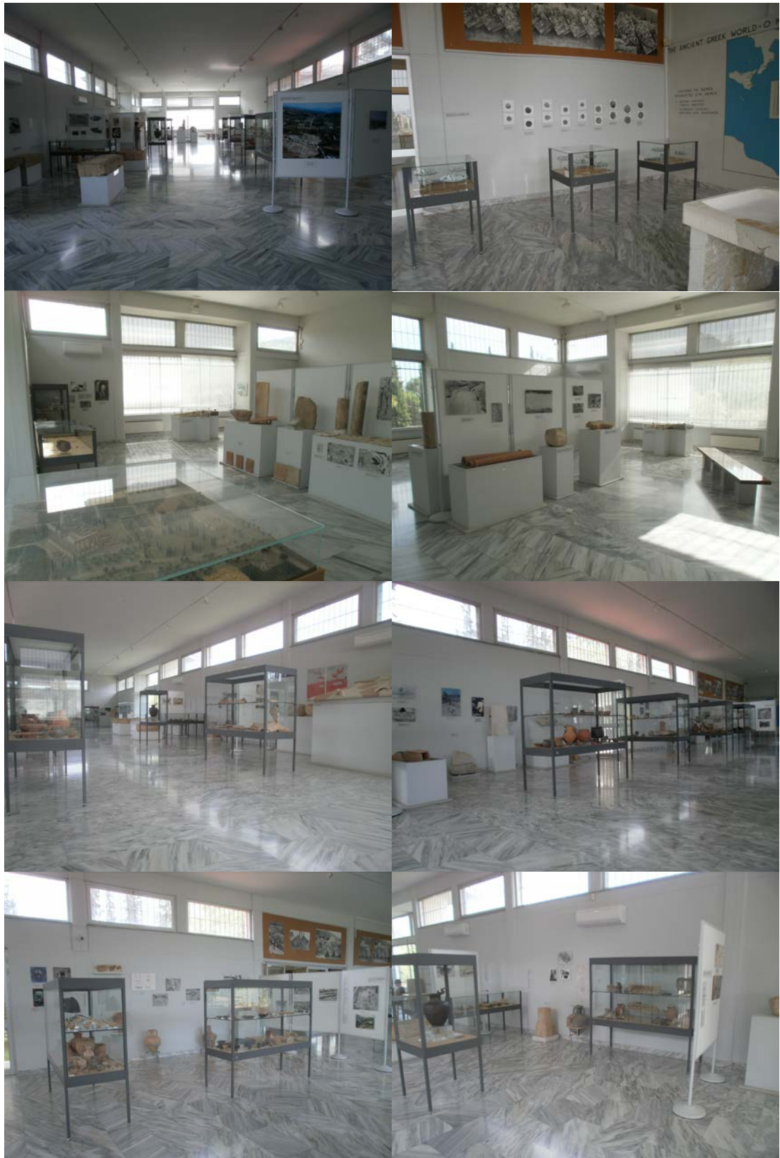
Εικ. 8: Φωτογραφίες από το εσωτερικό του Μουσείου με τα εκθέματα.