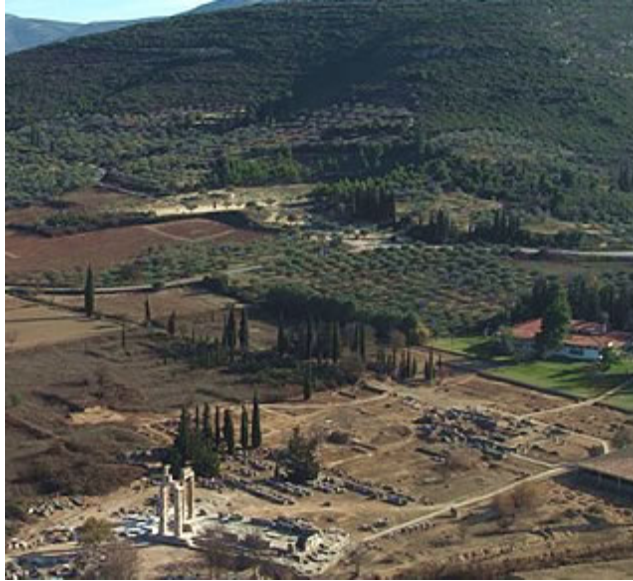
Εικ. 1: Εναέρια άποψη του αρχαιολογικού χώρου της αρχαίας Νεμέας. Κάτω αριστερά απεικονίζεται ο ναός του Διός και δεξιά με κόκκινη στέγη το Μουσείο.