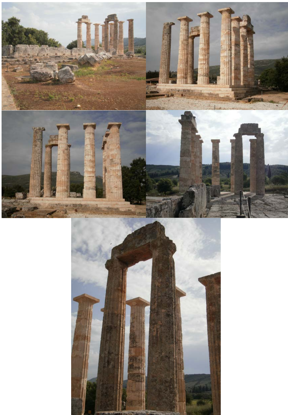
Εικ. 24. Ο ναός του Διός μετά την αναστήλωση. Διακρίνονται οι συμπληρώσεις με πιο ανοικτό χρώμα και οι αναστηλωμένοι κίονες.