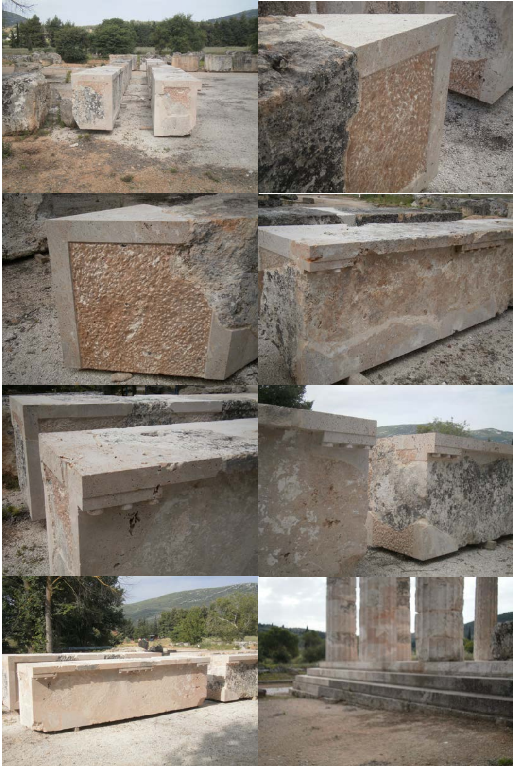
Εικ. 26: Φωτογραφίες από συμπληρωμένα αρχιτεκτονικά μέλη του ναού του Διός. Διακρίνονται με πιο ανοικτό χρώμα οι συμπληρώσεις.