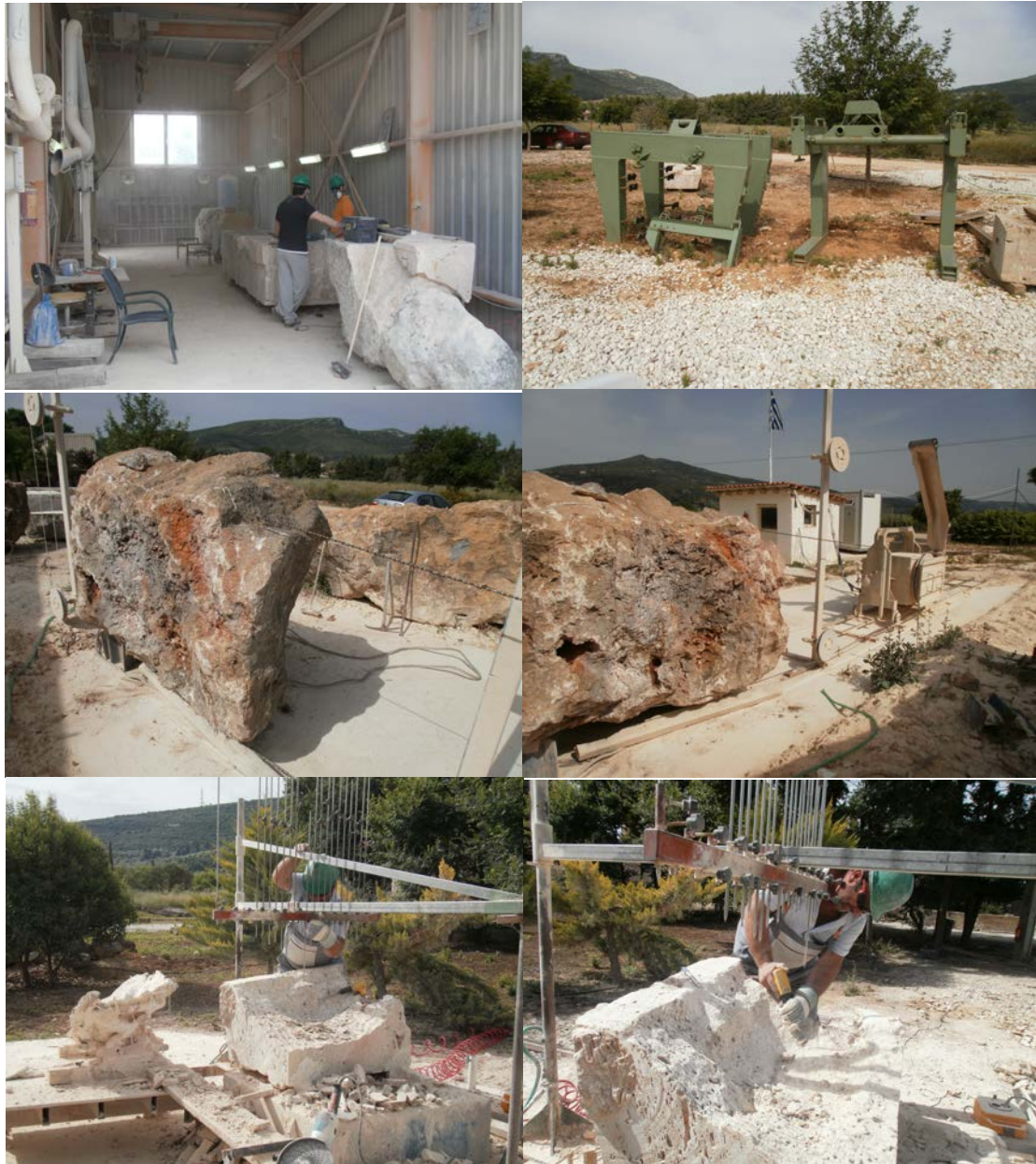
Εικ. 25: Φωτογραφίες από τον χώρο όπου γίνονται οι συμπληρώσεις και οι επικολήσεις των αρχιτεκτονικών μελών, εν ώρα εργασίας.