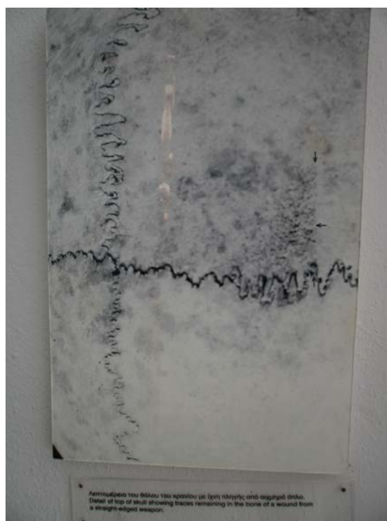
Εικ. 22: Λεπτομέρεια θόλου του κρανίου με ίχνη πληγής από αιχμηρό όπλο.