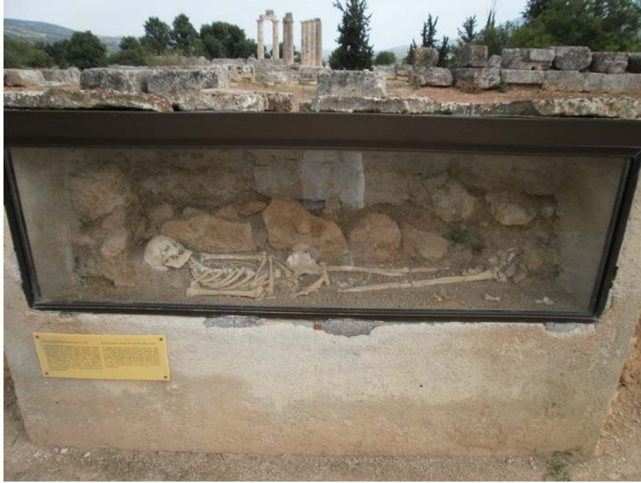
Εικ. 19: Προθήκη εκτός του αρχαιολογικού χώρου της Νεμέας. Παλαιοχριστιανικός τάφος του 6 ου αι. μΧ. Τυπική ταφή της περιόδου, με το σώμα τοποθετημένο με το κεφάλι προς δυσμάς, κοιτώντας ανατολικά, σε έναν τάφο κτισμένο από απλές λίθινες πλάκες.