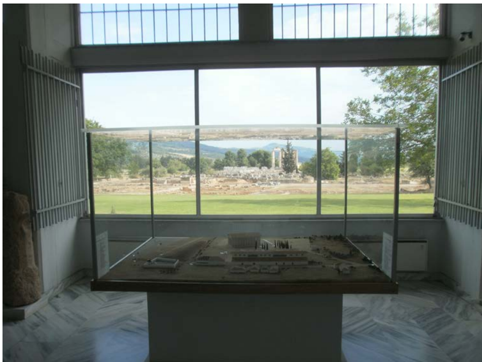
Εικ. 23: Παράθυρο από το εσωτερικό του Μουσείου με φόντο τον αρχαιολογικό χώρο της Νεμέας. Στο βάθος διακρίνεται ο Ναός του Διός. Μπροστά από το παράθυρο φαίνεται μακέτα αναπαράστασης του χώρου της Νεμέας κατά τα αρχαία χρόνια.