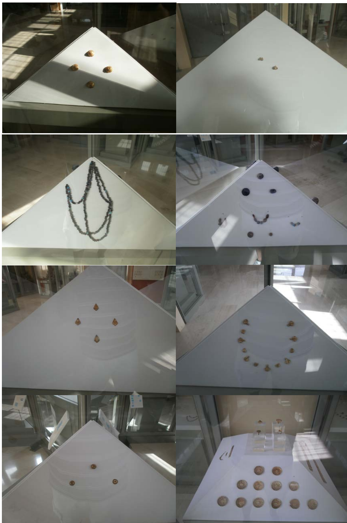
Εικ. 13: Φωτογραφίες των εκθεμάτων από τον Θησαυρό των Αηδονιών.