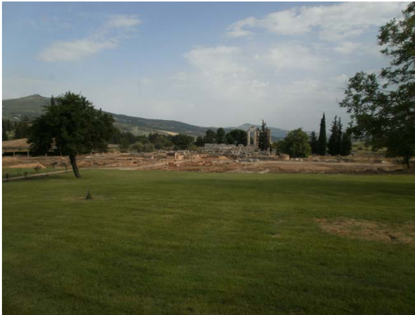
Εικ. 7: Άποψη του αρχαιολογικού χώρου της Νεμέας.