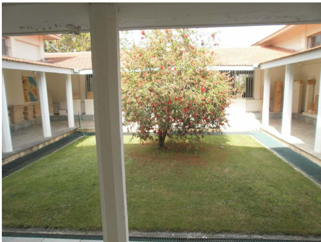
Εικ. 9: Αίθριο του Μουσείου. Περιμετρικά βρίσκονται τοποθετημένα αρχαία αρχιτεκτονικά μέλη.