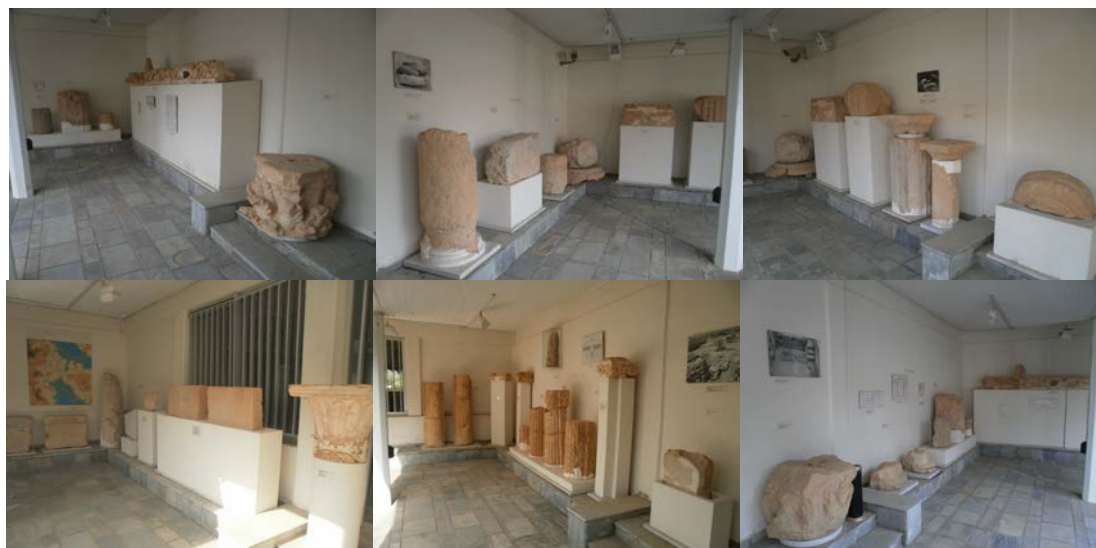
Εικ. 10: Αρχιτεκτονικά μέλη εκτιθέμενα στον αίθριο χώρο του Μουσείου. Επάνω στους τείχους διακρίνονται επεξηγηματικές πινακίδες και σχετικές φωτογραφίες.