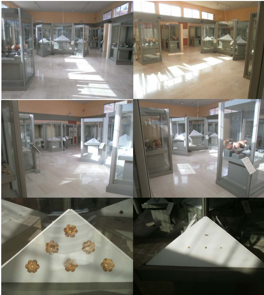
Εικ. 11: Φωτογραφίες από την αίθουσα όπου φυλάσσεται ο Θησαυρός των Αηδονιών.