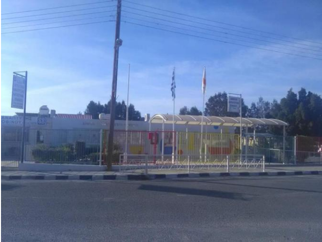
Εικόνα 3. Φωτογραφίες από την πλατεία της Κοφίνου