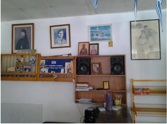
Εικόνα 7. Λαϊκές Οργανώσεις