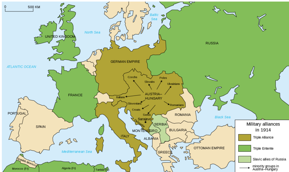
Χάρτης 4: Οι συμμαχίες κατά τον Α΄ Παγκόσμιο Πόλεμο: με σκούρο πράσινο χρώμα οι χώρες της Αντάντ· με ανοικτό πράσινο χρώμα οι σύμμαχοί τους στα Βαλκάνια· με καφέ χρώμα οι Κεντρικές Αυτοκρατορίες και οι σύμμαχοί τους