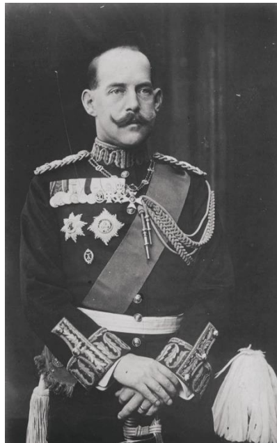
Εικόνα 2: Κωνσταντίνος Α΄, 1868-1923