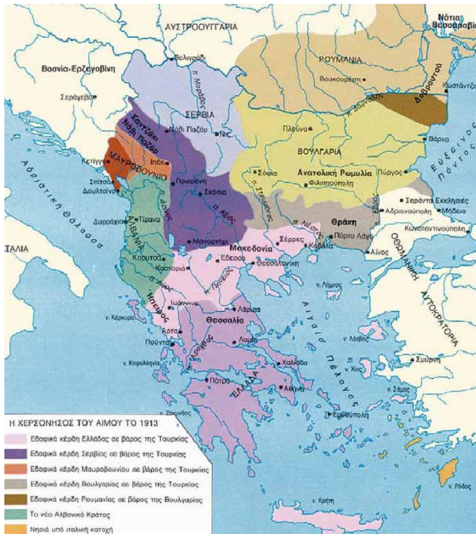
Χάρτης 3: Τα Βαλκάνια μετά τους Βαλκανικούς Πολέμους