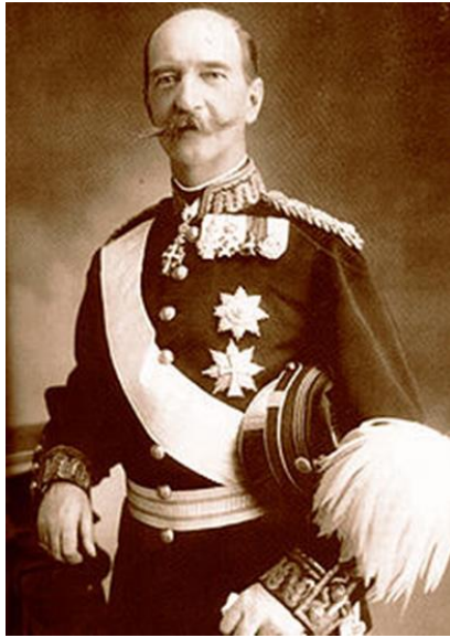
Εικόνα 3: Γεώργιος Α΄, 1845-1913