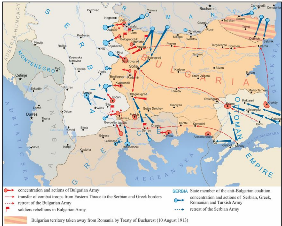
Χάρτης 2: Οι στρατιωτικές επιχειρήσεις κατά τον Β΄ Βαλκανικό Πόλεμο