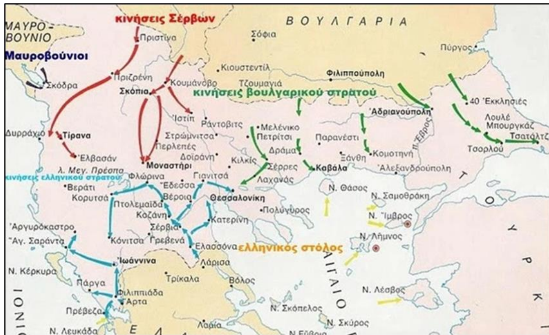
Χάρτης 1: Οι στρατιωτικές επιχειρήσεις κατά τον Α΄ Βαλκανικό Πόλεμο