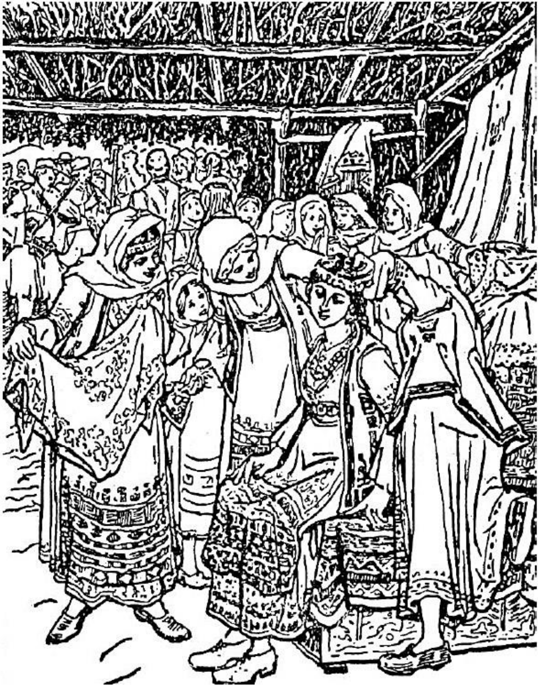
Εικόνα 4 416 : Οι γυναίκες ετοιμάζουν τη νύφη. Όλες οι γυναίκες βρίσκονται στον εσωτερικό χώρο της καλύβας, ενώ οι άντρες συνωστίζονται στον εξωτερικό χώρο 417 .