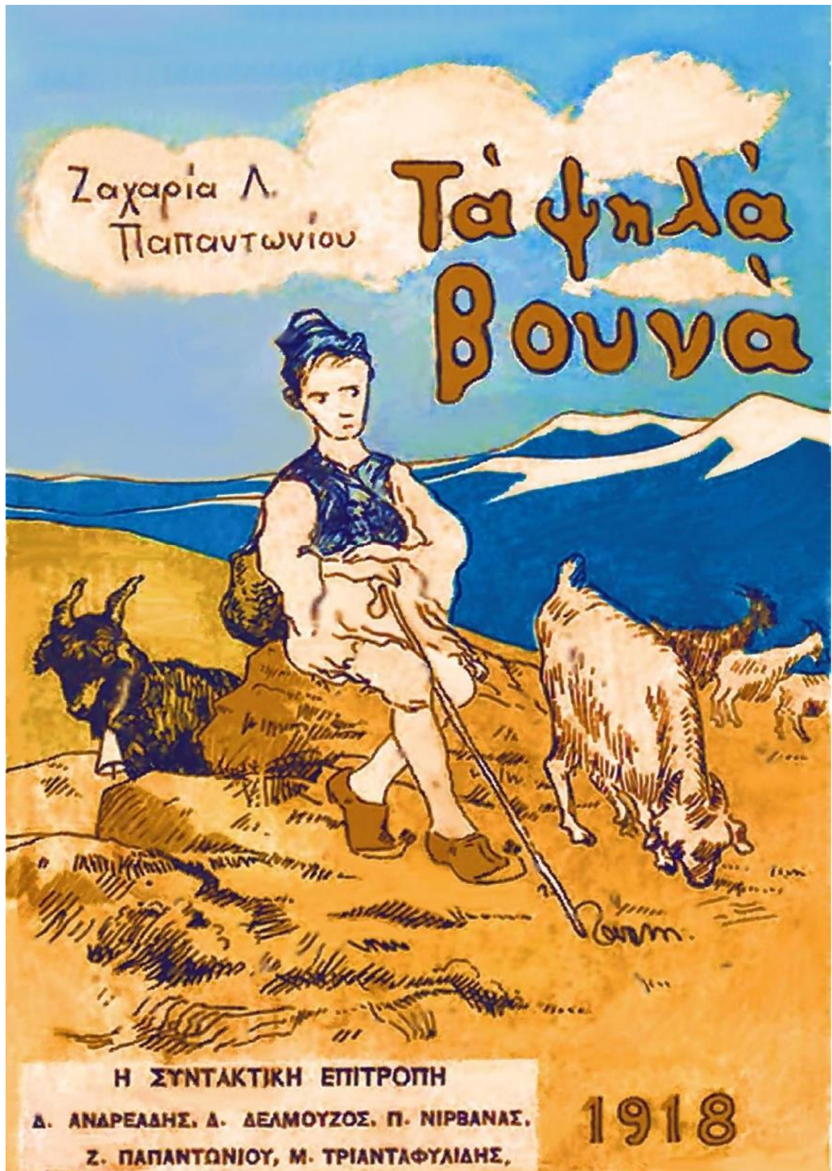
Εικόνα 1: Το εξώφυλλο της πρώτης έκδοσης (1918). Το βιβλίο εικονογράφησε ο Π. Ρούμπους, ενώ τα σχέδια είναι του Ζ. Παπαντωνίου.