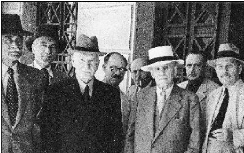
Εικόνα 4η : Οι εικονιζόμενοι στη πρώτη σειρά από τα αριστερά προς τα δεξιά: Νικόλαος Πλαστήρας, Θεμιστοκλής Σοφούλης, Γεώργιος Καφαντάρης και ο Δημήτριος Ρέντης.

http://assets.in.gr/AssetService/Data/D1999/D1111/1kn18c.gif