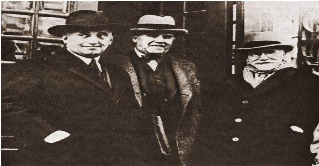
Εικόνα 2η : Οι εικονιζόμενοι από τα αριστερά προς τα δεξιά: Α. Παπαναστασίου, Γ. Καφαντάρης, Ε. Βενιζέλου.

https://upload.wikimedia.org/wikipedia/commons/6/66/Georgios_Kaphantaris.jpg