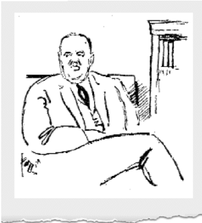
Εικόνα 3η : Ο Γεώργιος Καφαντάρης σε σχέδιο του Πρωτοπάτση