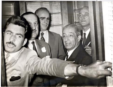
«Ο Κ. Καραμανλής προσέρχεται στην έκτακτη συνεδρίαση του υπουργικού συμβουλίου μετά Κανελλόπουλο, Κ. Τσάτσο και Ε. Αβέρωφ, 11 Ιουνίου 1963».

Ο κεντρικός χώρος, είχε ήδη χτίσει ενιαίο κομματικό φορέα, την Ένωση Κέντρου, που με αρχηγό τον Γεώργιο Παπανδρέου αναδείχθηκε προοδευτικά σε εναλλακτική πολιτική πρόταση, η οποία δεν ήταν άσχετη με την πτώση της τελευταίας κυβέρνησής του.