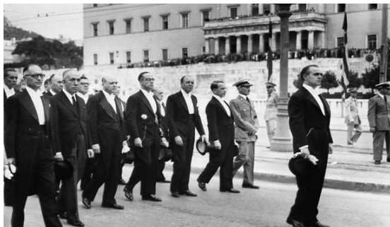
Ο Κωνσταντίνος Καραμανλής επικεφαλής του υπουργικού του συμβουλίου στην κηδεία του Αλέξανδρου Παπάγου, 6 Οκτωβρίου 1955 https://ikk.gr/chronologio/

Το γεγονός της αναλήψεως της πρωθυπουργίας από τον Καραμανλή σχολιάστηκε από τους «Times» της Νέας Υόρκης με τίτλο «Καραμανλής ένας μετριοπαθής», επίσης άλλες εφημερίδες του εξωτερικού τον ανέφεραν ως ένα επιτυχημένο πολιτικό. 48 Ο νέος πρωθυπουργός θα αξιώσει από την Άγκυρα άμεση ικανοποίηση για τις ανθελληνικές εκδηλώσεις του Σεπτεμβρίου στην Πόλη. Οι κυβερνήσεις Καραμανλή από τον Οκτώβριο του 1955 και για τα επόμενα τέσσερα αγωνίστηκαν με σθένος για την ανάδειξη των εθνικών δικαίων στην Κύπρο. 49