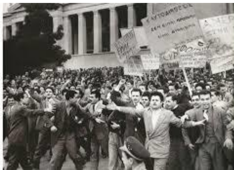
«Διαδήλωση στα Προπύλαια του Πανεπιστημίου Αθηνών στις 21 Δεκεμβρίου 1954 υπέρ της αυτοδιάθεσης της Κύπρου».

Η ανάμειξη του ΟΗΕ ως βασικού διαμεσολαβητή στο Κυπριακό χρονολογείται από τις δεκαετίες 1950-1960, όταν οι Ελληνοκύπριοι αποφάσισαν να διεκδικήσουν την ανεξαρτησία τους και προσέφυγαν στο νεόδμητο τότε οργανισμό για την υποστήριξη της Ελληνοκυπριακής κοινότητας. Αρχηγός του Κυπριακού Αγώνα ήταν ο Μακάριος. Μεγάλη πίεση άσκησε και το ΑΚΕΛ όπου τελικά με εμπνευστή τον Αρχιεπίσκοπο, συμφωνήθηκε και προγραμματίστηκε δημοψήφισμα για το υπέρ ή κατά στην ένωση. Το αποτέλεσμα ήταν ξεκάθαρα υπέρ από όλους σχεδόν του Ελληνοκυπρίου, δεν το έλαβαν όμως υπόψη τους οι Βρετανοί και ο κυβερνήτης της Κύπρου, Sir Andrew Wright δήλωσε ότι η τελική απόφαση είχε ληφθεί και η κατάσταση στο νησί θα συνεχιστεί ως έχει. Μετά από τρία χρόνια οι Ελληνοκύπριοι ζητούν από την Ελλάδα να υποβάλλει το αίτημα «Βούληση της Εθναρχίας», όπου απορρίπτεται ένα χρόνο μετά και το κυπριακό ανάγεται σε διεθνές ζήτημα. Από το 1954 η ανεξαρτησία τελεί υπό την αιγίδα των Ηνωμένων Εθνών και συνδέεται άρρηκτα με την αυτοδιάθεση που θα έχει ως επακόλουθο την ανεξαρτησία ή την ένωση με την Ελλάδα. 88