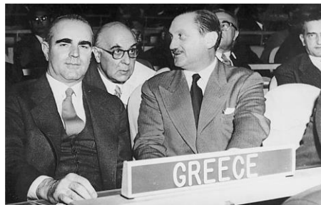
Ηνωμένα Έθνη 12 Νοεμβρίου 1956 έναρξη συζήτησης για το Κυπριακό. Ο πρωθυπουργός, Κ. Καραμανλής ο Ε. Αβέρωφ και ο Γ. Σεφέρης,

Συνέλευση με την ελληνική πλευρά να τοποθετείται υπέρ της αυτοδιάθεσης. 90 Η πρώτη προσφυγή υπεβλήθη στη Γενική Γραμματεία, του ΟΗΕ έξι μέρες πριν λήξει η προθεσμία, 16 Αυγούστου. 91 Την τελευταία μέρα της προθεσμίας, στις 22 Αυγούστου 1954, κατατέθηκε επεξηγηματικό υπόμνημα καθώς και υποστηρικτική επιστολή του Αρχιεπισκόπου Μακαρίου. 92 Τα δεδομένα εκείνη την εποχή δεν ήταν όπως σήμερα, που υπάρχει η ποσοτική υπεροχή των χωρών του Τρίτου Κόσμου, ενώ και η δεδομένη αρνητική στάση των ΗΠΑ, που ήλεγχε τον Οργανισμό, προδιάγραφε το αποτέλεσμα της ψηφοφορίας. Η αγγλική πλευρά μεταχειρίστηκε έναν ελιγμό. Στις 14 Δεκεμβρίου η Ελλάδα κατέθεσε επίσημα προσχέδιο ψηφίσματος με το οποίο υποστηριζόταν το αίτημα για αυτοδιάθεση. Την ίδια ημέρα, η Νέα Ζηλανδία, ύστερα από συνεννόηση με το Λονδίνο, υπέβαλε προσχέδιο ψηφίσματος με το οποίο επιχειρείτο η μη περαιτέρω εξέταση του θέματος, έτσι μετά και από νεοζηλανδική παρέμβαση, υιοθετήθηκε ένα Ψήφισμα στο οποίο αναφερόταν, πως εφόσον δεν διαφαίνεται κάποια λύση για το Κυπριακό ζήτημα, δε ασχολήθηκε περαιτέρω με το θέμα. Βέβαια εκτός από την αρνητική στάση έναντι της Κύπρου, και η κυβέρνηση της Ελλάδας αντέδρασε χαλαρά. 93 Ο κυπριακός ελληνισμός και ο ελληνισμός γενικότερα, γεύτηκε διεθνή αποτυχία. Στην Αθήνα, ο πρωθυπουργός Παπάγος δήλωσε πως το θέμα θα επανερχόταν εντονότερο και με «μείζονος ελπίδας επιτυχίας» στην επόμενη, Γενική Συνέλευση στα τέλη του 1955. 94