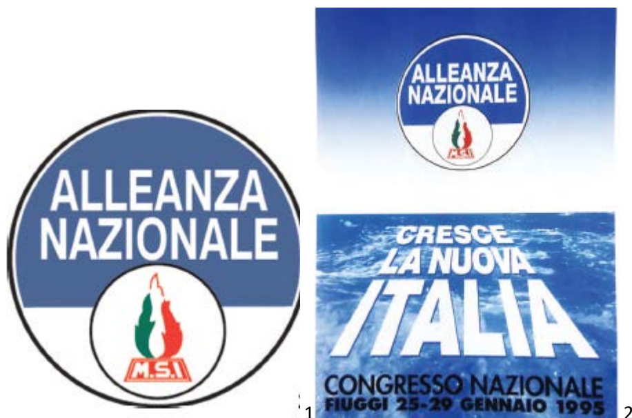
Εικόνα 1: Λογότυπο της AN (1994-2009)