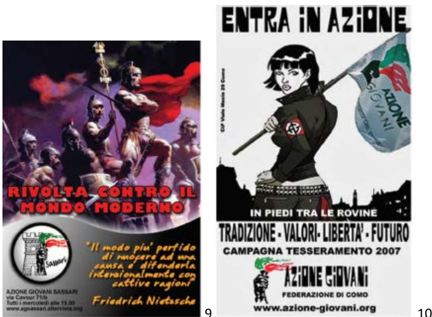
Εικόνα 9: « Επανάσταση ενάντια στο μοντέρνο κόσμο». Υπάρχει ομώνυμο βιβλίο του Julius Evola από το 1934. Αφίσα της νεολαίας της AN το 2008.