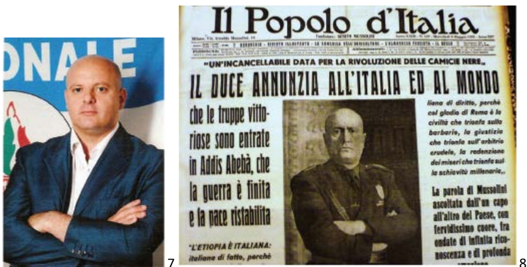
Εικόνα 7: Πορτρέτο του γερουσιαστή της AN Achille Totaro από τον προσωπικό του ιστότοπο (2006).