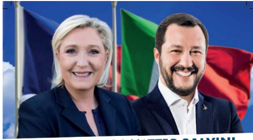
MARINE LE PEN & MATTEO SALVINI