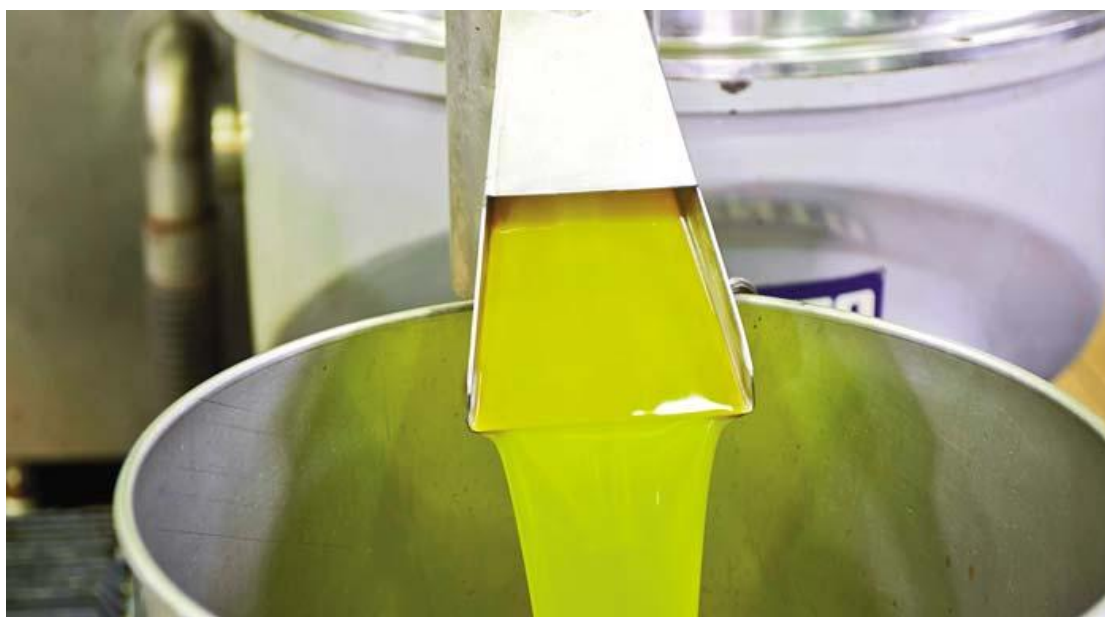
Εικόνα 9 - Στάδιο 4 - τελικό προϊόν

Ακολουθεί η φυγοκέντριση, κατά την οποία με τη χρήση του φυγοκεντρικού εξαγωγέα απομακρύνονται όλα τα υπολείμματα νερού από το ελαιόλαδο, και το τελικό προϊόν ελαιολάδου είναι έτοιμο.