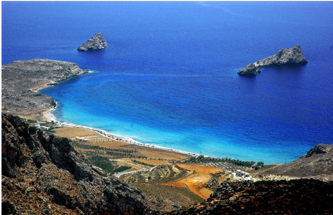
Εικόνα 16 - Ξερόκαμπος Ζήρου Σητείας