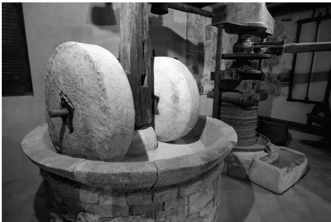
Εικόνα 12 - Ελαιοτριβείο με μολόπετρες

δημιουργήθηκαν υδραυλικά πιεστήρια κ.α., οι μέθοδοι αυτοί εγκαταλείφθηκαν.