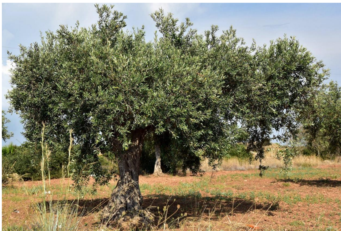
Εικόνα 5 - Ελαιόδεντρο

από ήπιους χειμώνες, θερμά καλοκαίρια και ηλιοφάνεια χωρίς έντονη υγρασία. Φυσικά και άλλες περιοχές εκτός μεσογείου έχουν επιχειρήσει να καλλιεργήσουν ελαιόδεντρα, όπως η Ασία, η Αυστραλία, η Αμερική κ.α., χωρίς ενθαρρυντικά αποτελέσματα. Στην Ελλάδα μπορούμε να συναντήσουμε ελαιόδεντρα που παράγουν καρπό είτε για ελαιόλαδο, είτε για επιτραπέζιες ελιές. Σε πολλές περιοχές, όπως στη Σητεία, η ελιά είναι μονοκαλλιέργεια, και υπολογίζεται ότι στο νησί της Κρήτης καλλιεργούνται πάνω από 35.000.000 ελαιόδεντρα (Ψιλάκης & Ψιλάκη, 2003). Σε παγκόσμια κλίμακα, η συνολική επιφάνεια που καταλαμβάνει η καλλιέργεια της ελιάς, υπολογίζεται σε περίπου 100 εκατομμύρια στρέμματα, παράγονται σχεδόν 10 εκατομμύρια τόνοι καρπού, με πιο σημαντικές παραγωγικές χώρες να είναι η Ισπανία, η Ιταλία και η Ελλάδα (Καρατάσιου & Κάλφας, 2018).