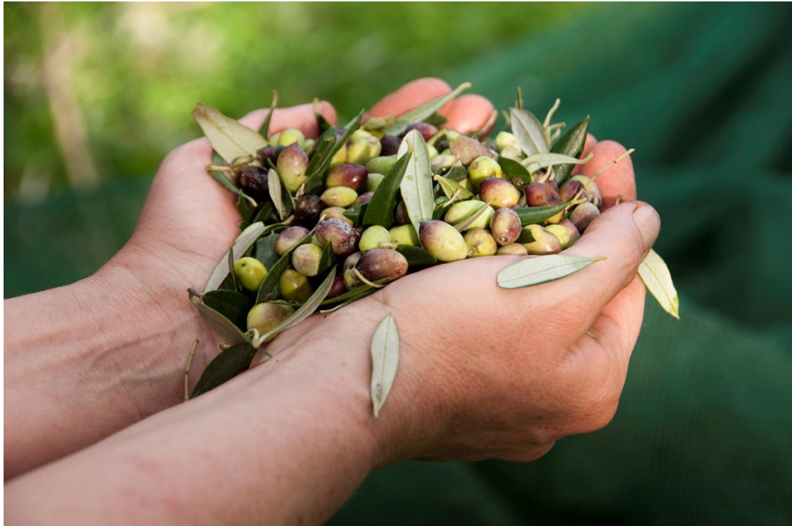
Εικόνα 13 - Ελαιόκαρπος