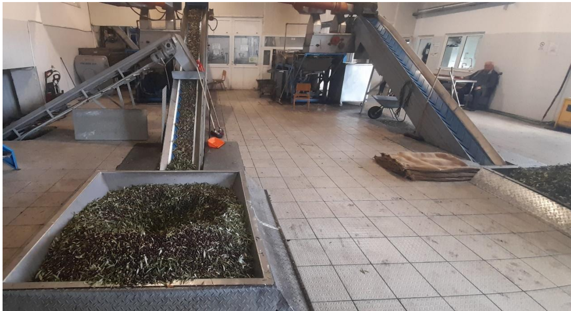
Εικόνα 6 - Στάδιο 1 - καθαρισμός

Στη συνέχεια οι καρποί χύνονται στην κοφινίδα, μια κεντρική σκάφη, όπου με τη βοήθεια μιας κυλιόμενης ταινίας, περνάνε από το στάδιο της απομάκρυνσης των φύλλων και λοιπών περιττών υλών, και εν συνεχεία πλένονται.