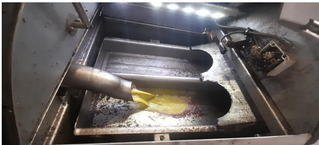
Εικόνα 8 - Στάδιο 3 - διαχωρισμός

(κουκούτσι) της ελιά και τα υπόλοιπα απόβλητα - παραπροϊόντα.