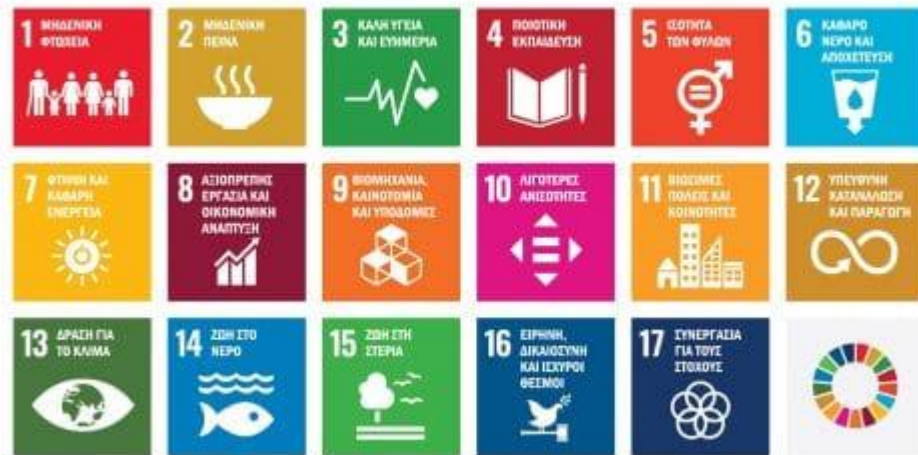
Εικόνα 2 – Στόχοι Βιώσιμης Ανάπτυξης

Αναπτυγμένες και αναπτυσσόμενες χώρες έχουν δεσμευτεί για την υλοποίηση των 17 στόχων για τη Βιώσιμη Ανάπτυξη, προκειμένου να εξαλειφθεί η φτώχεια, να μειωθούν οι ανισότητες, να αντιμετωπιστεί η κλιματική αλλαγή και να προστατευτεί η βιοποικιλότητα, να υπάρξει οικονομική ανάπτυξη, να έχουν όλοι ποιοτική εκπαίδευση, καθαρό νερό και αποχέτευση, φτηνή και καθαρή ενέργεια, να υπάρξει ισότητα μεταξύ των δύο φύλων, κ.α., βάζοντας χρονικό ορίζοντα το έτος 2030 (Hellenic Aid, 2019).