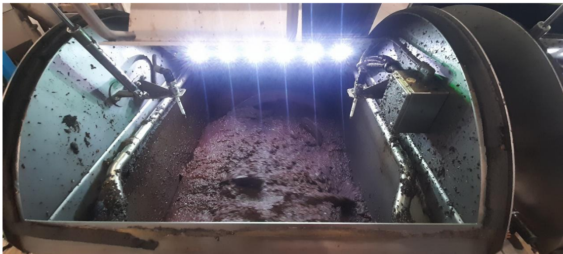
Εικόνα 7 - Στάδιο 2 - μάλαξη

Έπειτα ο καρπός συνθλίβεται με τη βοήθεια ειδικών μηχανών, και μετά ζυμώνεται ώσπου να γίνει μια ομοιόμορφη πάστα. Κατά τη ζύμωση ή μάλαξη η πάστα θερμαίνεται αλλά σε σχετικά χαμηλή θερμοκρασία, με χρήση ζεστού νερού.