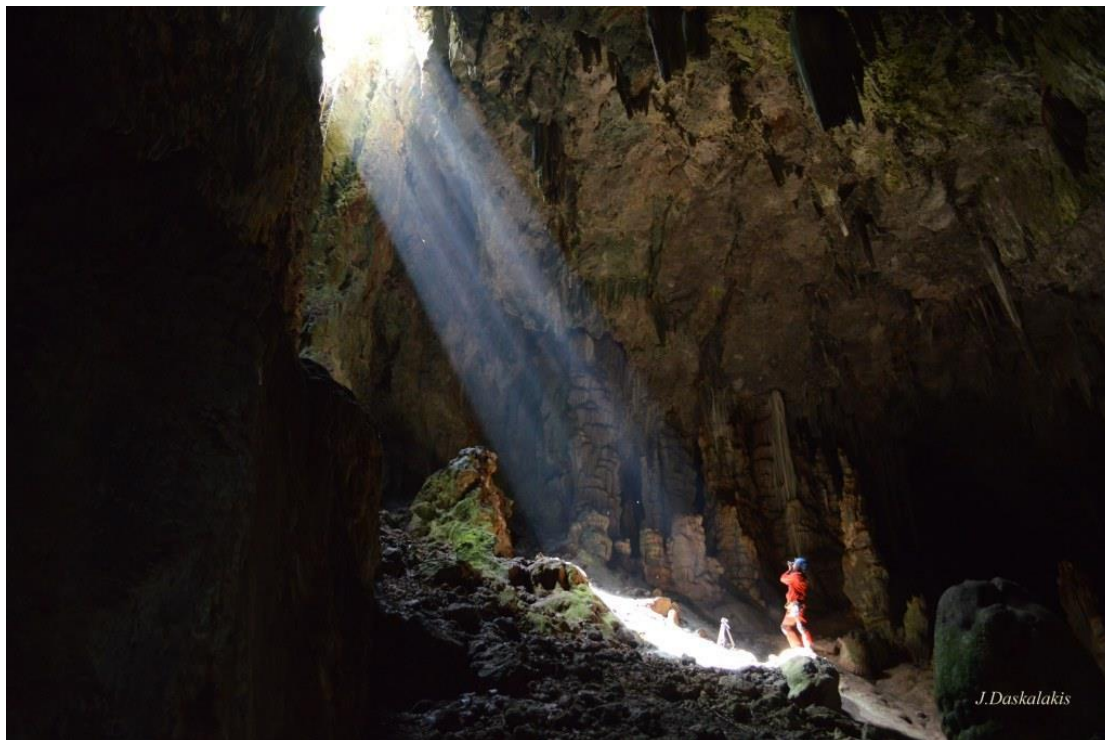
Εικόνα 17 - Σπήλαιο στο Γεωπάρκο Σητείας

Γεωλογικά, το Φυσικό Πάρκο Σητείας παρουσιάζει ιδιαίτερο ενδιαφέρον, καθώς στην πλούσια γεωκληρονομιά του περιλαμβάνονται μοναδικά πετρώματα, ιδιαίτερων σχηματισμών, πλήθος απολιθωμάτων, καθώς και ιζηματογενείς σειρές από αλπικές και μεταλπικές ενότητες, με πετρώματα από την πλειστοκαινο εποχή.