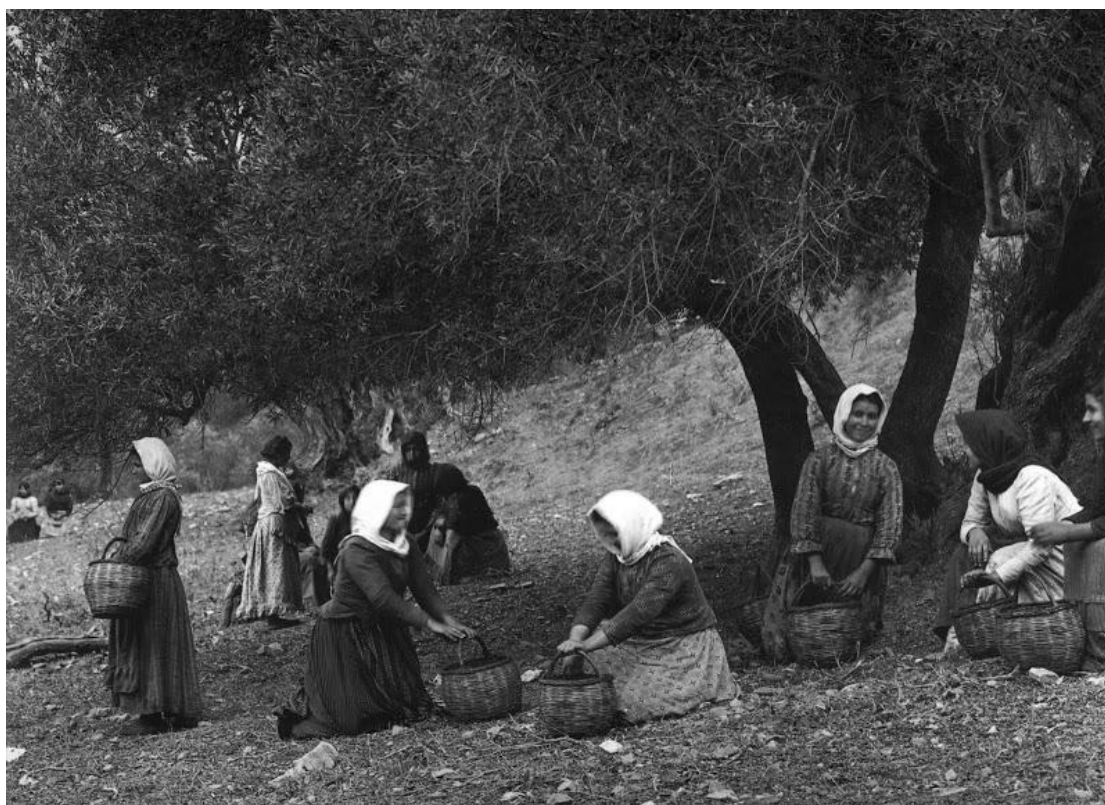
Εικόνα 10 - Το μάζεμα της ελιάς στην Πρέβελη Κρήτης, 1911.

Στη συνέχεια τον μετέφεραν στο σπίτι, όπου τον αποθήκευαν για αρκετές μέρες, μέχρι να μαζευτεί μια ικανοποιητική ποσότητα καρπού, και να τον πάνε στο ελαιοτριβείο. Ήταν μια ιδιαίτερα χρονοβόρα και επίπονη διαδικασία, και η παρατεταμένη αποθήκευση του καρπού, επέφερε κακές ποιότητες ελαιολάδου. Με το πέρασμα των ετών ανακαλύφθηκαν τα ελαιόπανα, ή «παλέτσες», ειδικά υφάσματα που τα άπλωναν κάτω από τα δέντρα και συσώρευαν τον καρπό ευκολότερα και γρηγορότερα. Παράλληλα χτυπούσαν τις ελιές με ξύλινα ραβδιά, ρίχνοντας τον καρπό μαζί με αρκετά φύλλα και κλαδιά, πάνω στις παλέτσες. Λόγω των πολλών κλαδιών και φύλλων, και δεδομένου ότι δεν υπήρχε τότε η δυνατότητα αυτόματης απομάκρυνσης από τα μηχανήματα του εργοστασίου, έπρεπε να τα απομακρύνουν πριν τα πάνε στο ελαιοτριβείο. Έτσι λοιπόν η επόμενη διαδικασία ήταν το «λίχνισμα». Με τη βοήθεια ενός πιάτου, πετούσαν τις ελιές στον αέρα, με προσοχή να συγκεντρωθούν σε ένα σωρό σε απόσταση περίπου τριών – τεσσάρων μέτρων. Η παρουσία του αέρα σε αυτή τη διαδικασία ήταν απαραίτητη, καθώς σύμφωνα με το νόμο της βαρύτητας, ο ελαιόκαρπος ως πιο βαρύς, με το πέταγμα έφτανε ως την απέναντι μεριά, τα φύλλα όμως όχι. Στη συνέχεια τοποθετούσαν τον καρπό σε τσουβάλια, και τον αποθήκευαν στα σπίτια τους οι αγρότες, έως ότου μαζευτεί