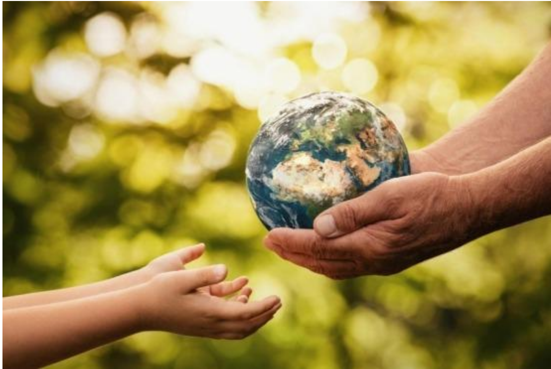
Εικόνα 1 Βιώσιμη ανάπτυξη