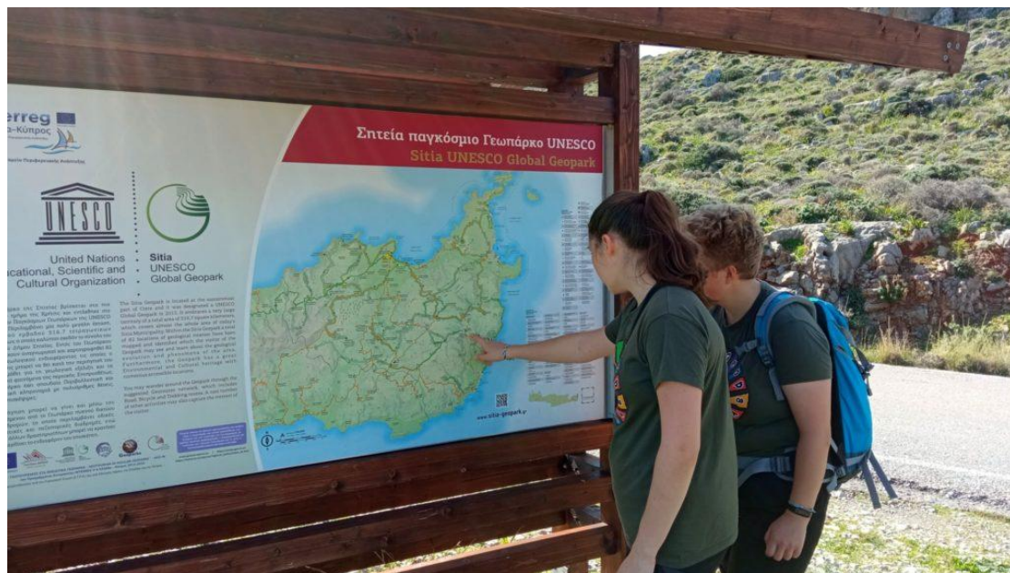
Εικόνα 15 - Χάρτης Γεωπάρκου Σητείας

και όλες τις παράκτιες περιοχές από το Βορά έως το Νότο.