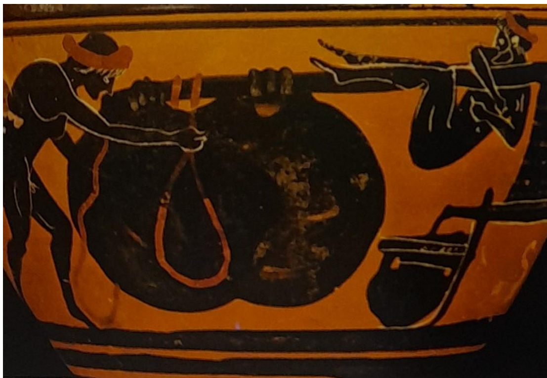
Εικόνα 11 - Ελαιοτριβείο με μοχλούς, 6ος αιώνας π.Χ.

το λάδι που παρήγαγαν έρεε σε δοχεία αποθήκευσης (Ψιλάκης & Ψιλάκη, 2003).