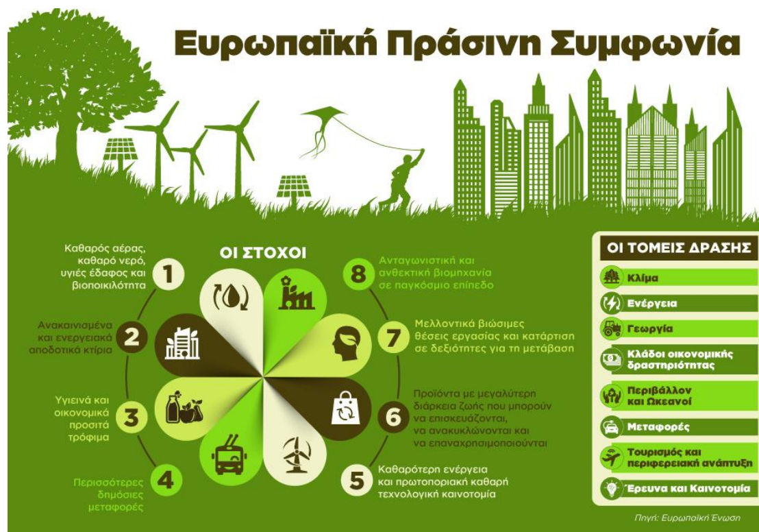
Εικόνα 4 –Ευρωπαϊκή Πράσινη Συμφωνία

Σχολιάζοντας περί βιώσιμης ανάπτυξης στην Ευρωπαϊκή Ένωση, δε μπορούμε να μην αναφερθούμε στην Ευρωπαϊκή Πράσινη Συμφωνία. Η εν λόγω Συμφωνία αποτελεί μια δέσμευση της Ε.Ε. προκειμένου να αντιμετωπιστεί η κλιματική αλλαγή, και οι γενικότερες περιβαλλοντικές προκλήσεις. Αποτελεί μέρος της στρατηγικής της Ευρωπαϊκής Επιτροπής για την εφαρμογή του Θεματολογίου της Ατζέντας 2030 του ΟΗΕ. Αποσκοπεί στην κοινωνική ευημερία, στην αειφορία, την υγιή οικονομική ανάπτυξη με την ορθή χρήση των πόρων, με στόχο ως το 2050 να έχουν μηδενιστεί οι εκπομπές αερίων του θερμοκηπίου και να επιτευχθεί η κλιματική ουδετερότητα (Ευρωπαϊκή Επιτροπή, Η Ευρωπαϊκή Πράσινη Συμφωνία, 2019). Πρόκειται ξεκάθαρα για μια στρατηγική βιώσιμης ανάπτυξης, αφού προωθεί την ανάπτυξη με γνώμονα την ευημερία της κοινωνίας, την προστασία του περιβάλλοντος και την οικονομία.