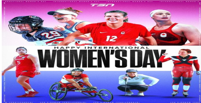
Εικόνα 1. Η γιορτή της γυναίκας

Ενώ η βιβλιογραφία αναφέρεται στη χειραφέτηση των γυναικών και τις θετικές αλλαγές που έχουν επιτευχθεί στην κοινωνική και επαγγελματική πρόοδο των γυναικών σε πολλές χώρες παγκοσμίως και στη χώρα μας, εντούτοις η παρούσα έρευνα έδειξε ότι: