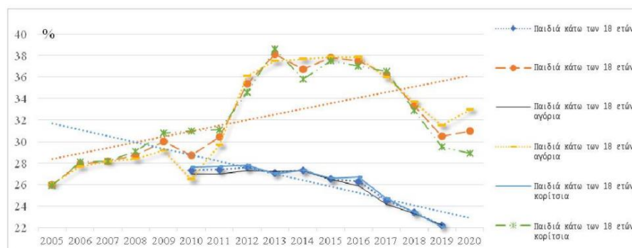
Διάγραμμα 2: Ποσοστό παιδιών που διατρέχουν κίνδυνο φτώχειας ή κοινωνικού αποκλεισμού, κάτω των 18 ετών, ανά φύλο, Ελλάδα και ΕΕ - 2027, 2005 - 2019 / 20203

Πηγή: Eurostat. Ανάπτυξη Συντακτών από EU-SILC, (ILC_PEPS01)