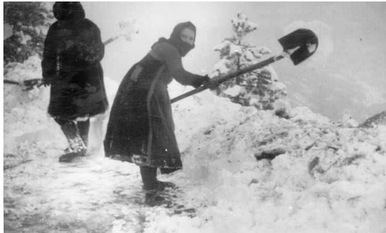
Εικόνα 1: Γυναίκες το 1940 ανοίγουν τον δρόμο από τα χιόνια.

Πηγή: https://www.lavart.gr/o-rolos-ton-gynaikon-to-1940/