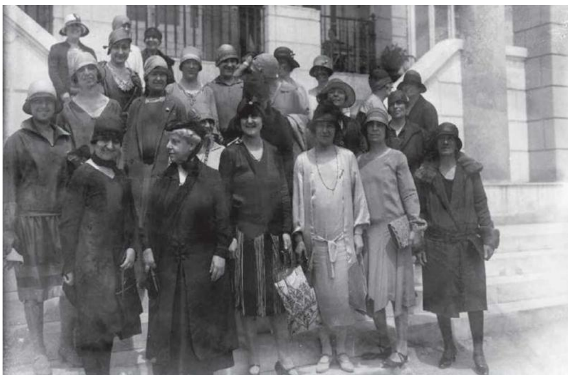
Εικόνα 24: Γυναίκες-μέλη του Λυκείου Ελληνίδων.