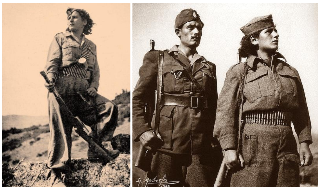
Εικόνα 13: Η αντάρτισσα Τιτίκα Γκέλντη Παναγιωτίδου έγινε σύμβολο της Εθνικής Αντίστασης.

https://el.wikipedia.org/wiki/%CE%9C%CE%B1%CF%81%CE%AF%CE%B1_%CE%94%CE%B7%CE%BC%CE%AC%CE%B4%CE%B7