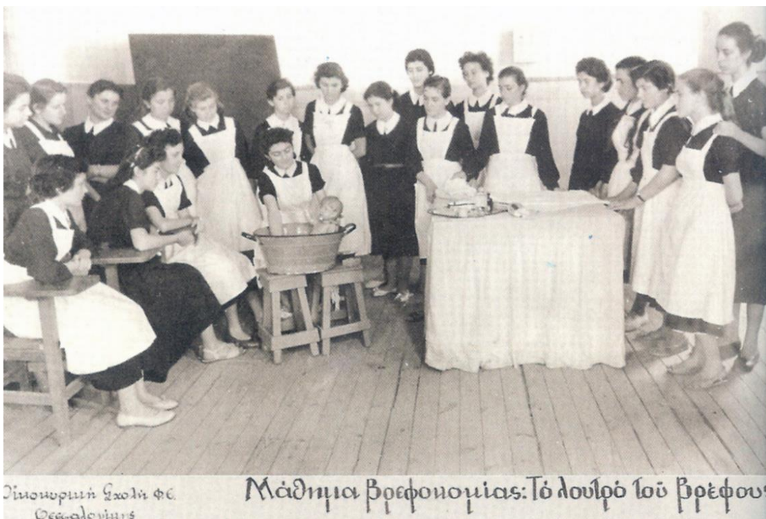
Εικόνα 20: Μάθημα βρεφοκομίας στην Αρσάκειο Οικοκυρική Σχολή Θεσσαλονίκης. Το λουτρό του βρέφους.