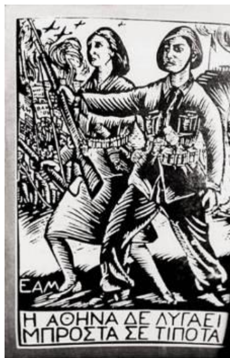
Εικόνα 19: Αντάρτισσα και αντάρτης του ΕΑΜ στη διαδήλωση της 5 ης Μαρτίου 1943.