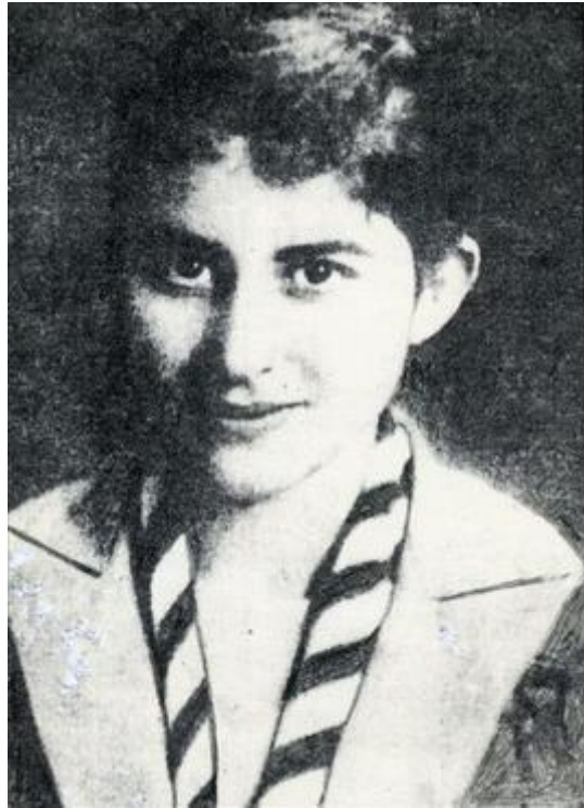
Εικόνα 10: Η ηρώίδα της Αντίστασης, Ηρώ Κωνσταντοπούλου.