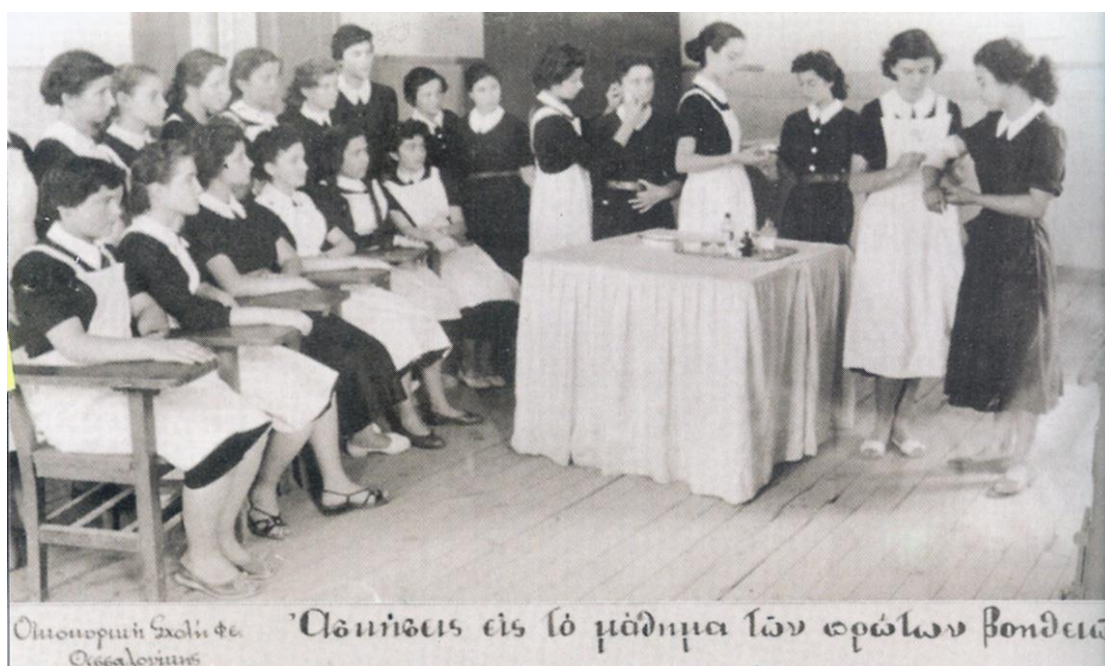
Εικόνα 22: Μάθημα πρώτων βοηθειών στην Αρσάκειο Οικοκυρική Σχολή Θεσσαλονίκης.