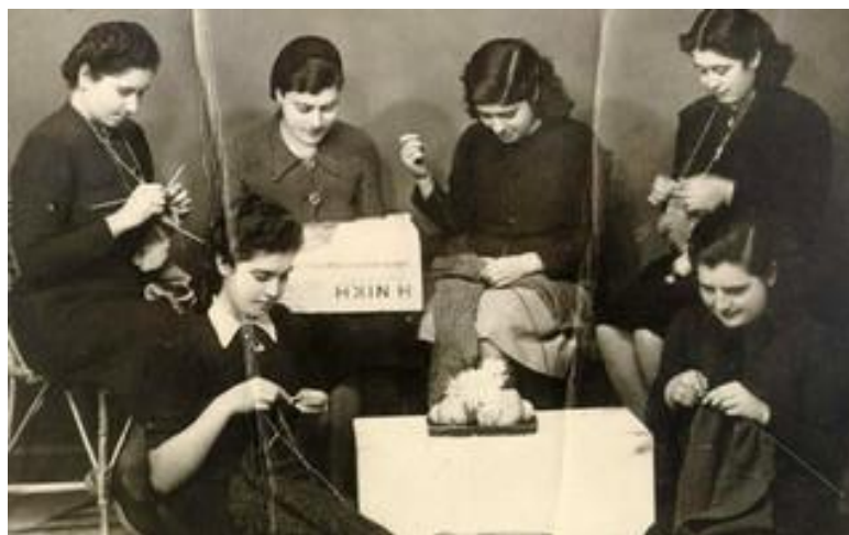
Εικόνα 2: Γυναίκες το 1940 πλέκουν για τους αγωνιστές στο μέτωπο.