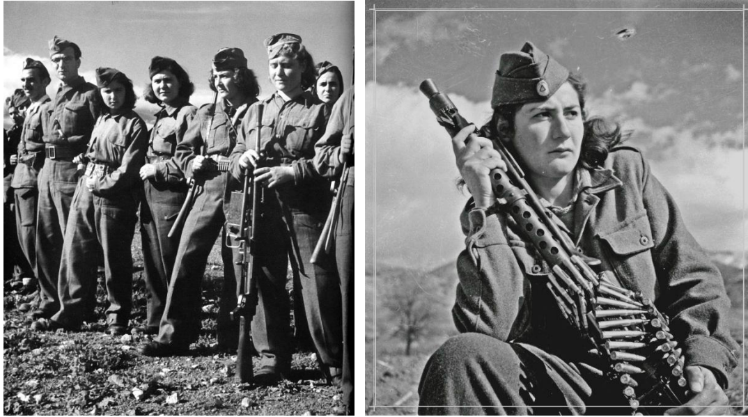
Εικόνα 3: Γυναίκες στην Αντίσταση.