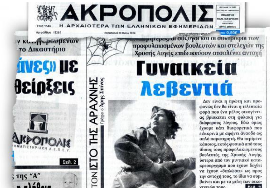
Εικόνα 17: Η Τιτίκα Γκελντή Παναγιωτίδου σε πρωτοσέλιδο της εφημερίδας «ΑΚΡΟΠΟΛΙΣ» ως παράδειγμα «Γυναικείας λεβεντιάς».