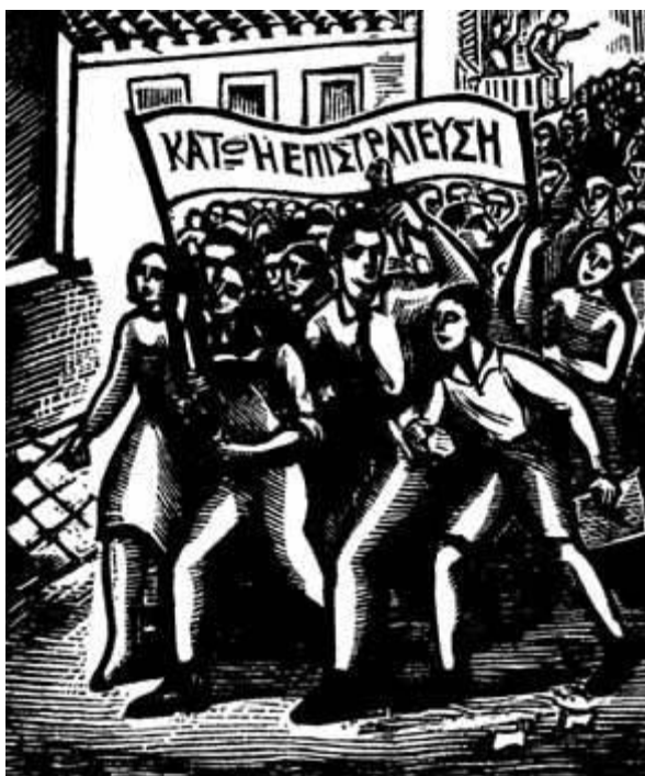
Εικόνα 18: Χαρακτικό που απεικονίζει τη διαδήλωση της 5 ης Μαρτίου 1943.