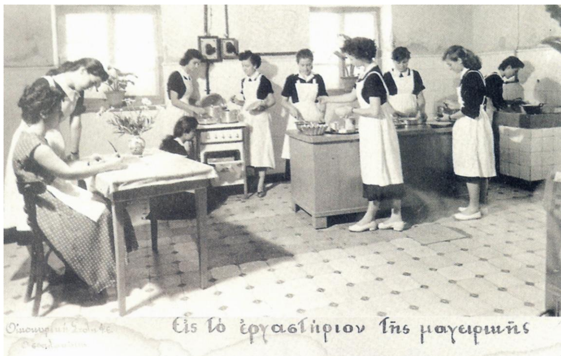
Εικόνα 21: Μάθημα μαγειρικής στο εργαστήριο της Αρσάκειου Οικοκυρικής Σχολής Θεσσαλονίκης.