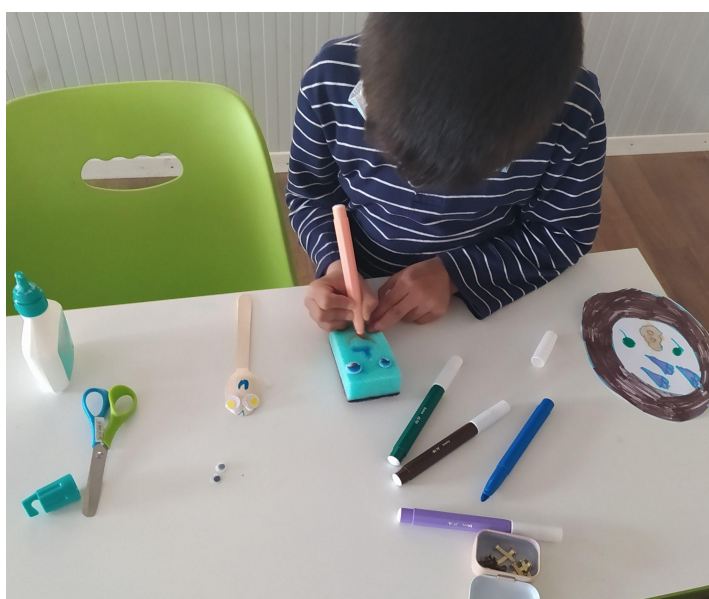
Εικ.11 Ο Σ2 συγκεντρωμένος στη δημιουργία του δίνοντας έμπνευση στα υπόλοιπα παιδιά