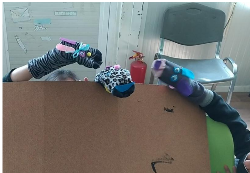
Εικ.14 Αλληλεπιδρώντας πρώτη φορά με άλλα παιδιά μέσα από την γαντόκουκλα