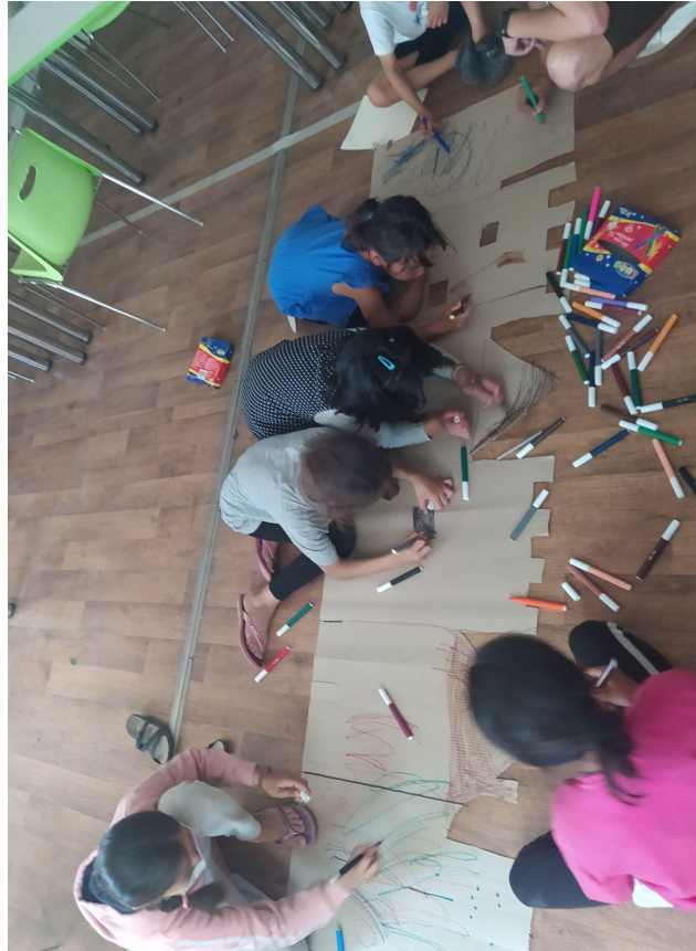
Εικ.13 Επιμέλεια σκηνικού έπειτα από δίκαιο διαχωρισμό πεδίου εργασίας