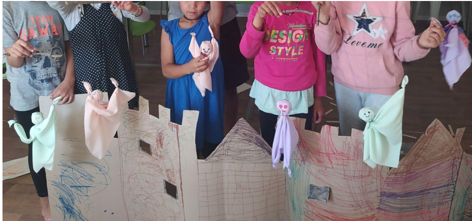
Εικ.1. Φαντάσματα που χορεύουν στο κάστρο τους