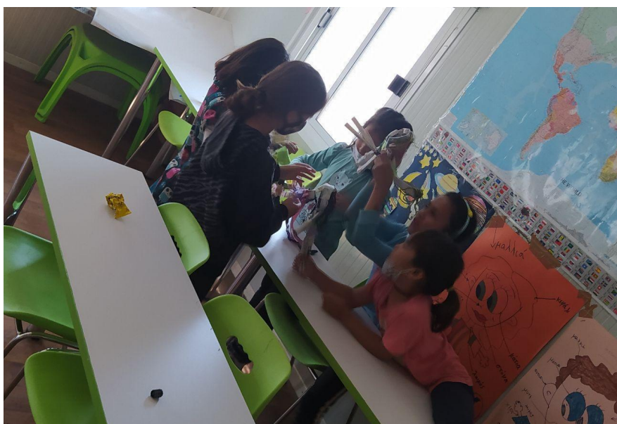
Εικ.9 Συζήτηση συμμετεχόντων για την καλύτερη διαμόρφωση των κουκλών τους