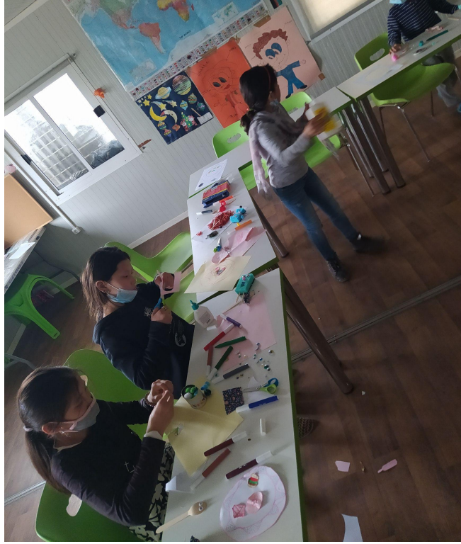
Εικ.15 Ανταλλαγή ιδεών και υλικών