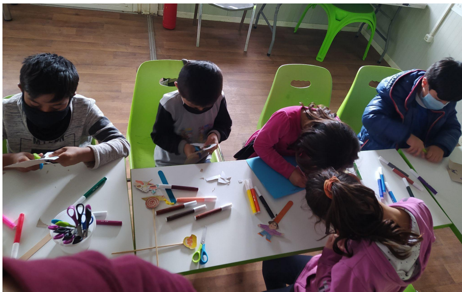
Εικ.2 Το παιδί και το σαλιγκάρι. Δισδιάστατες χάρτινες κούκλες