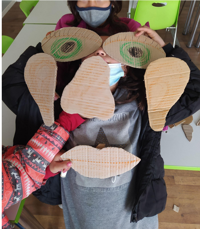
Εικ.12 Συνεργασία με σκοπό τα μέλη να μουν σωστά και να εμφυχωθεί το πρόσωπο