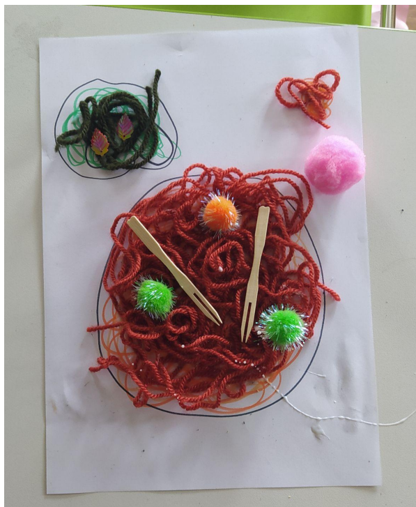
Εικ.7 Δημιουργία σκηνικού Μακαρόνια με κεφτεδάκια