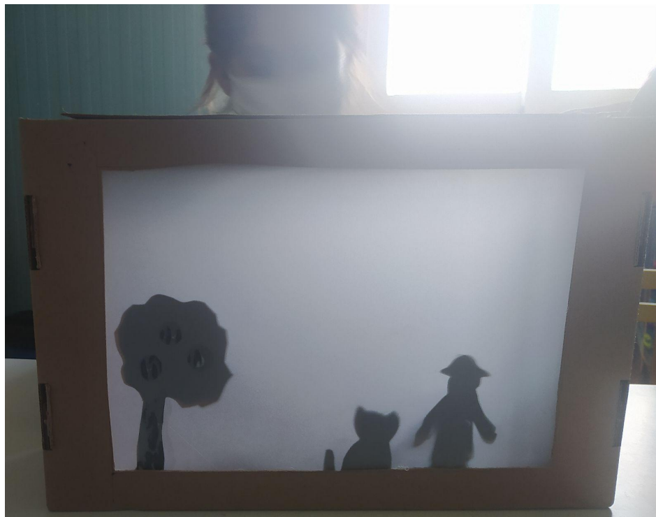
Εικ.4 Εμπυχώνοντας τις φιγούρες του θεάτρου σκιών που έφτιαξαν τα παιδιά