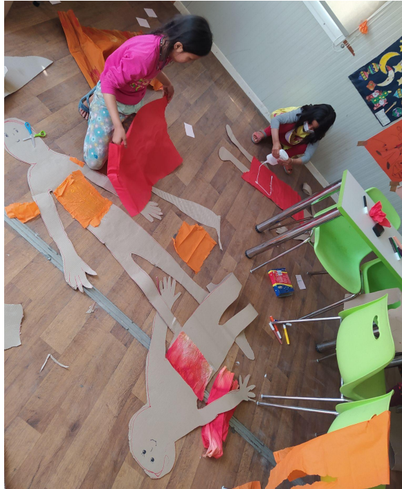
Εικ.16 Φτιάχνοντας κούκλες με καλούπι το σώμα μας