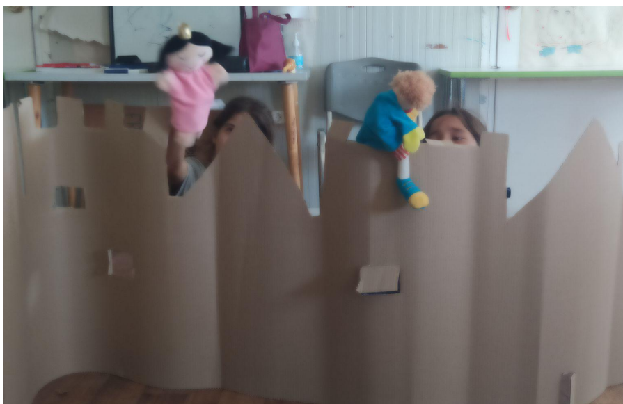
Εικ.10 Συνομιλώντας με τις γαντόκουκλες