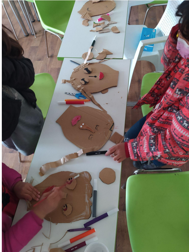
Εικ.5 Το πρόσωπο. Μάσκες από χαρτόκουτα