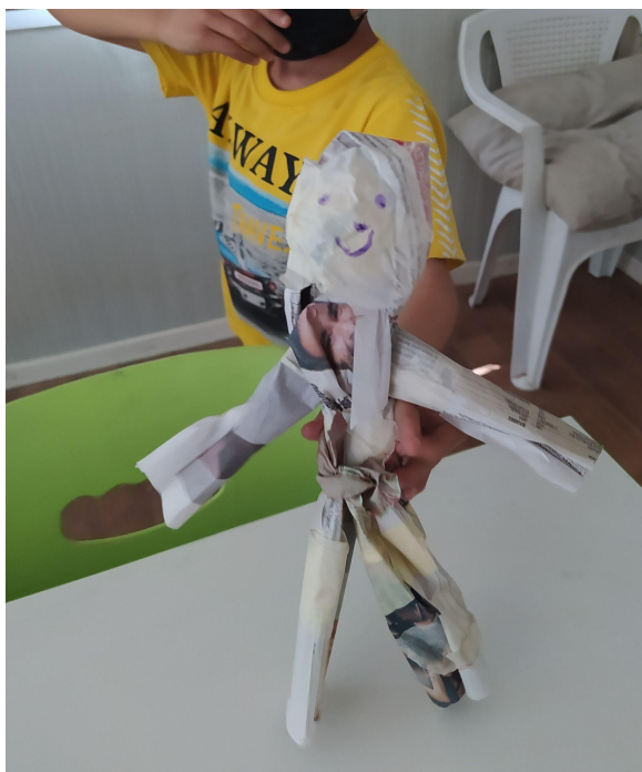
Εικ.8 Μια χαρούμενη εφημεριδόκουκλα