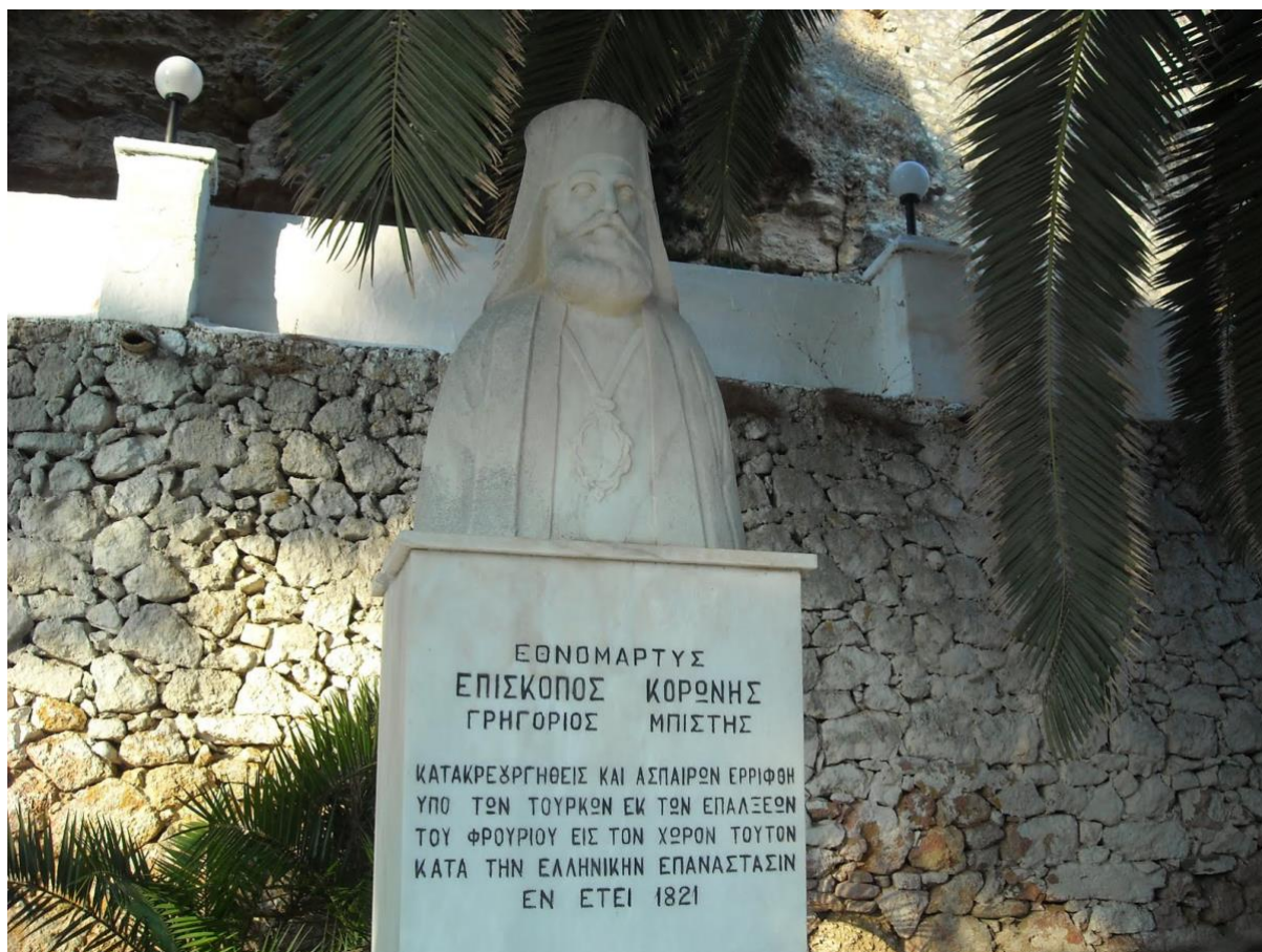
Μνημείο του Επισκόπου Κορώνης Γρηγορίου Μπίστη στο χώρο του μαρτυρίου του.