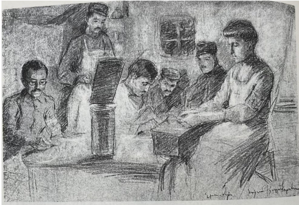
Ο Πολύβιος Κορύλλος στο μέτωπο της Ηπείρου στους Βαλκανικούς Πολέμους