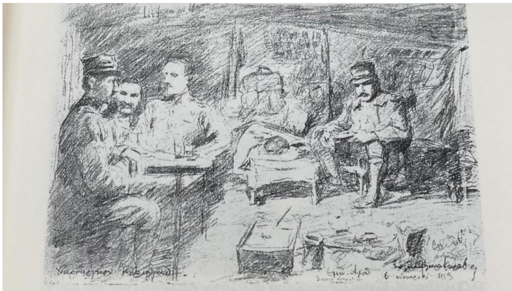
Ο Πολύβιος Κορύλλος στο 11 ο Πεδινό Χειρουργείο.