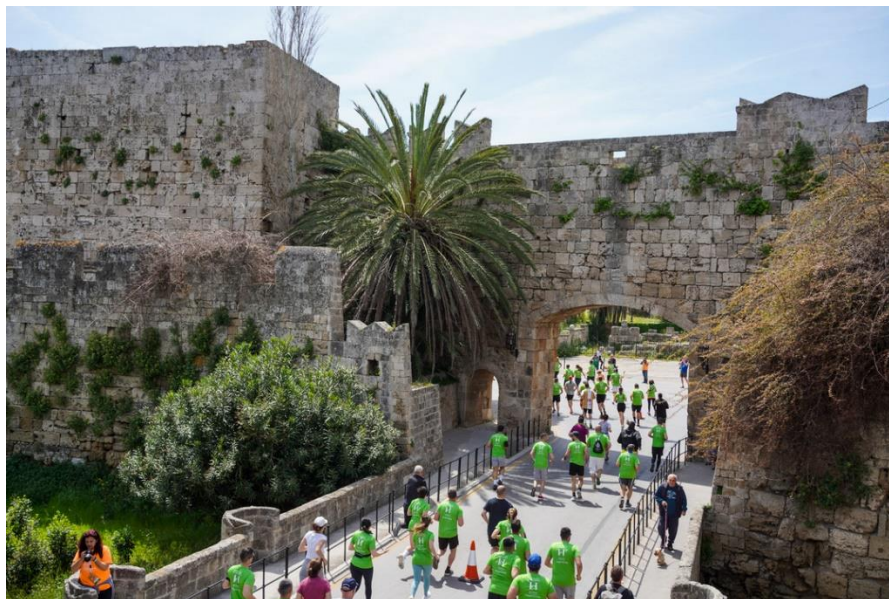
Εικόνα 8. Στιγμιότυπο από το 7 ο Διεθνές Μαραθώνιο Δρόμο της Ρόδου

Ελληνοαμερικανός ομογενής με καταγωγή από τη Ρόδο. Μαζί με τη Μαριέτα Παπαβασιλείου, πρόεδρο της Οργανωτικής Επιτροπής και τον Αμερικάνο Υπεραθλητή και συγγραφέα WayneKurtz σχεδίασε μια μαραθώνια διαδρομή που αποτελεί πλέον σημείο αναφοράς για την παγκόσμια δρομική κοινότητα. Πρόκειται για μια παραθαλάσσια διαδρομή δίπλα στα τείχη της Μεσαιωνικής Πόλης με θέα το Αιγαίο, 42.195 μέτρα δίπλα στο απέραντο γαλάζιο, μία ξεχωριστή εμπειρία για τον κάθε δρομέα (rhodesmarathon.gr, 2022).