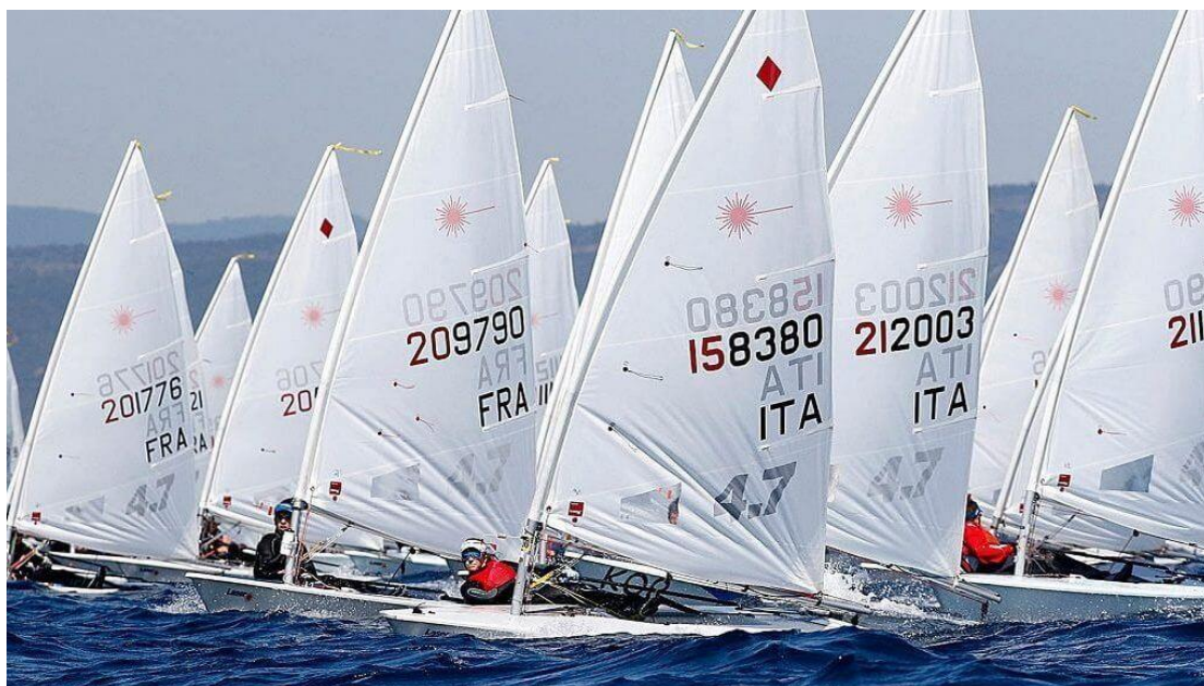
Εικόνα 4. Το νησί έχει τις προϋποθέσεις για τη διοργάνωση αγώνων ιστιοπλοΐας διεθνούς βεληνεκούς

ε) Κολύμβηση: Μεγάλη εντύπωση προκαλεί το γεγονός ότι ένα νησί, όπως η Ρόδος, δεν έχει ποντάρει αρκετά στη διοργάνωση διεθνών αγώνων κολύμβησης. Ελάχιστα είναι τα παραδείγματα τέτοιων που έχουν καταγραφεί στο παρελθόν, όπως αυτό του κολυμβητικού αγώνα 6 χιλιομέτρων στη Ρόδο, που έλαβε χώρα τον Οκτώβριο του 2011 και ήταν όμως σε τοπικό επίπεδο. Επρόκειτο για μία προσπάθεια προώθησης του αθλήματος στη Ρόδο και στα γύρω νησιά από το νεοσύστατο σύλλογο Απόλλων Ρόδου (apostolidisdive.gr, 2011). Ομοίως, τα προηγούμενα χρόνια διεξάγονταν το Rhodes Penguins Cup στο κολυμβητήριο του Κολλεγίου Ρόδου, που σκοπό είχε να ενώσει τα κολυμβητικά σωματεία της Δωδεκανήσου (kalymnos-news.gr, 2019).