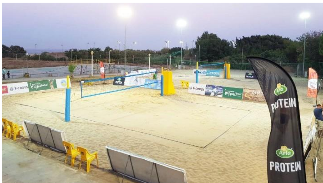
Εικόνα 10. Το γήπεδο μπιτς βόλεϊ στη Ρόδο

κ) Τρίαθλο: Το 2022 ήταν ένα έτος ιδιαίτερα σημαντικό εν γένει για τον τουρισμό της Ρόδου, αλλά και πιο ειδικά για τον αθλητικό τουρισμό. Συγκεκριμένα, το τρίαθλο επανασυστήθηκε στο νησί, μετά από τέσσερα χρόνια απουσίας, με έναν σημαντικό αγώνα που έλαβε χώρα τον Οκτώβριο, εκκινώντας και τερματίζοντας στην πόλη, ενώ περιελάμβανε την ολυμπιακή απόσταση, δηλαδή 1,5χλμ. κολύμπι, 40χλμ. ποδηλασία και 10χλμ. τρέξιμο.