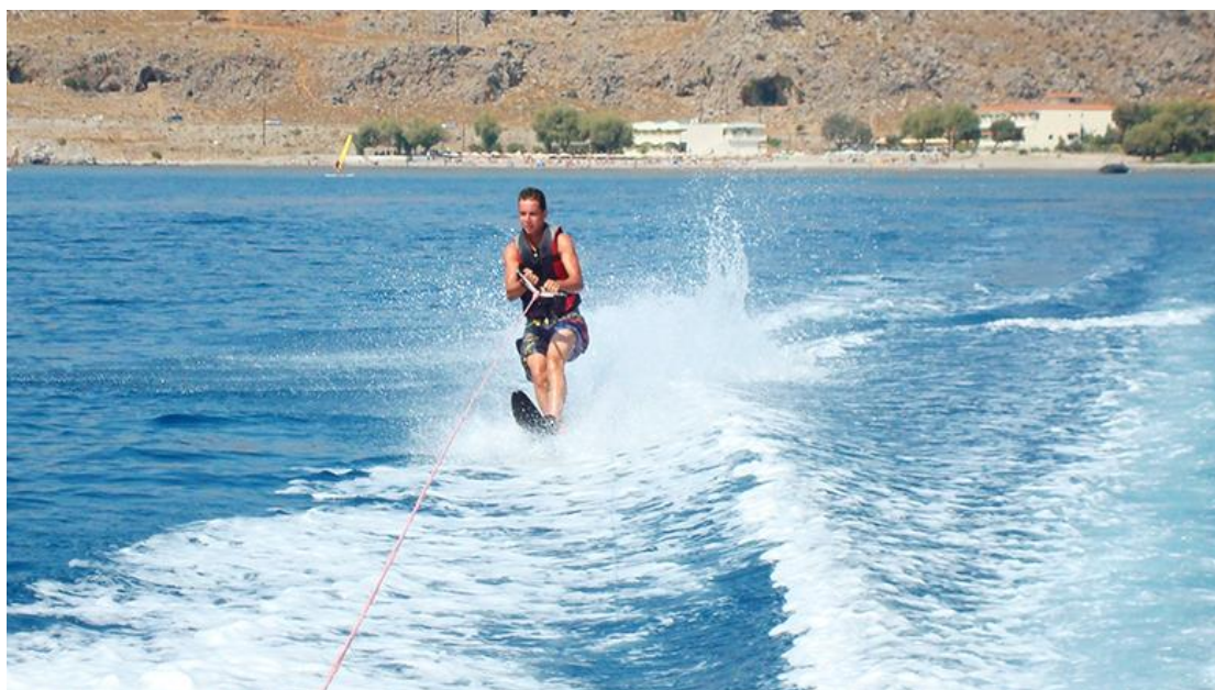
Εικόνα 2. Στιγμιότυπο από δραστηριότητα σε μία καταγάλανη παραλία της Ρόδου

γ) Κανόε καγιάκ: Η θαλάσσια περιοχή του νησιού προσφέρει στους λάτρεις του κανόε καγιάκ την ευκαιρία να εξασκηθούν σε αυτό στη λίμνη της Απολάκκιας, της οποίας το μήκος φτάνει τα 1.750 μέτρα και τα 200 μέτρα πλάτος. Ο Ναυτικός Όμιλος Ρόδου διαθέτει σκάφη διαφόρων τύπων για εκπαίδευση 1 .