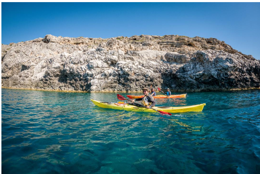
Εικόνα 3. Με το κανόε καγιάκ οι επισκέπτες μπορούν να εξερευνήσουν δυσπρόσιτα μέρη του νησιού

δ) Ιστιοπλοΐα: Για 25 η χρονιά διεξήχθη τον Ιούλιο του 2022 στη Ρόδο το διεθνές RodosCup (Ρόδος Καπ), το οποίο συνδιοργάνωσαν ο Αθλητικός Σύλλογος Ιστιοπλόων Ανοικτής Θάλασσας Ρόδου (ΑΣΙΑΘΡ) και η Περιφέρεια Νοτίου Αιγαίου. Χαρακτηριστικά σε αυτό έλαβαν μέρος 400 περίπου ιστιοπλόοι και συνοδοί από διάφορες χώρες του πλανήτη, που συνδύασαν τη συμμετοχή τους στο κορυφαίο ιστιοπλοϊκό γεγονός του Αιγαίου με διακοπές στο πανέμορφο νησί. Να σημειωθεί ότι το Ρόδος Καπ άνοιξε για πρώτη φορά τα πανιά του το 1996, με την ονομασία τότε «Ιστιοπλοϊκή Εβδομάδα Δωδεκανήσου», ενώ από το 2001 μετονομάστηκε σε Ρόδος Καπ. Η μοναδική φορά που δεν διεξήχθη ήταν το 2020 λόγω της πανδημίας (news12.gr, 2022).