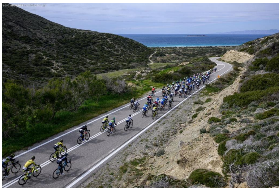
Εικόνα 7. Ποδηλάτες απ' όλο τον κόσμο συμμετέχουν στον Διεθνή Ποδηλατικό Αγώνα της Ρόδου

Ενδεικτικά είναι τα νούμερα που αφορούν στο 2021, σύμφωνα με τα οποία στο νησί λόγω του διεθνούς ποδηλατικού αγώνα (International RhodesGrandPrix) - το οποίο λαμβάνει χώρα από το 2017 - φιλοξενήθηκαν τον μήνα Απρίλιο 176 ποδηλάτες από 18 χώρες του κόσμου. Η διοργάνωση αυτή έδωσε το έναυσμα για την έναρξη της τουριστικής περιόδου εκείνης της χρονιάς (bankingnews.gr, 2021), με τα νούμερα που κατέγραψε να κρίνονται σημαντικά εάν αναλογιστεί κανείς ότι ήταν η δεύτερη χρονιά της πανδημίας. Αντίστοιχα ήταν και τα νούμερα του 2022, καθώς τον περασμένο Μάρτιο φιλοξενήθηκαν στο νησί 150 ποδηλάτες από 24 διαφορετικά μέρη απ' όλο τον κόσμο (dimokratiki.gr, 2022b).