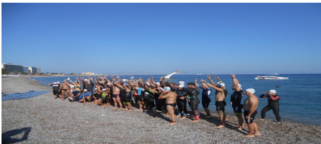
Εικόνα 11. Στιγμιότυπο από τον αγώνα τριάθλου του 2022

λ) Μπάσκετ: Μετρημένες είναι μέχρι στιγμής οι προσπάθειες που έχουν γίνει στο άθλημα του μπάσκετ, ώστε αυτό να αποτελέσει πόλο έλξης στο νησί, ιδίως τους θερινούς μήνες με τη διοργάνωση summerscamps. Χαρακτηριστική είναι η διοργάνωση του «GalísBasketball 3on3», που έλαβε χώρα τον Ιούνιο του 2019 στο νησί και μετέπειτα έπεσε θύμα του κορονοϊού. Συγκεκριμένα, η Ρόδος υποδέχθηκε τον Νίκο Γκάλη στον τόπο καταγωγής του (ο πατέρας του ήταν από τον Άγιο Ισίδωρο της Ρόδου), σε ένα φαντασμαγορικό μπασκετικόevent. Για τις ανάγκες του camp, η πλατεία δημαρχείου μεταμορφώθηκε σε ναό του μπάσκετ, με ένα ειδικά διαμορφωμένο γήπεδο εγκεκριμένο από τη FIBA, ενώ πλήθος κόσμου έπευσε να θαυμάσει από κοντά τον Νίκο Γκάλη και τους ξεχωριστούς καλεσμένους που ήρθαν για να τον τιμήσουν! Στο τουρνουά πραγματοποιήθηκαν πάνω από 100 αγώνες 3on3 6 .