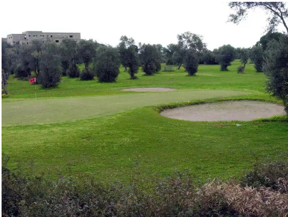
Εικόνα 6. Το γήπεδο γκολφ στην περιοχή της Αφάντου

κτιριακές εγκαταστάσεις προς εξυπηρέτηση των πελατών – παιχτών, σε παραλιακή έκταση εμβαδού περίπου 1.500 στρεμμάτων (ethnos.gr, 2019).