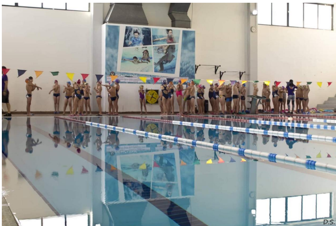
Εικόνα 5. Παιδιά κάθε ηλικίας συμμετείχαν στο RhodesPenquinsCup

Πέραν, όμως, των αθλημάτων που σχετίζονται με τη θάλασσα και γνωρίζουν μεγάλη ανάπτυξη στο «νησί των ιπποτών», τα τελευταία χρόνια κοντά σε αυτά διεκδικούν μία περίοπτη θέση και άλλα αθλήματα, όπως τα παρακάτω: