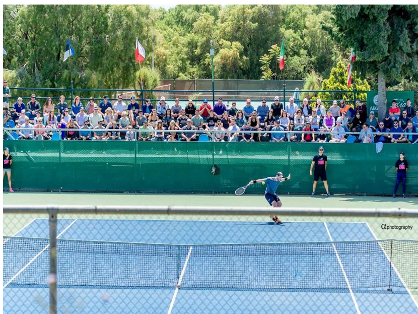
Εικόνα 9. Στιγμιότυπο από τους αγώνες ITF SENIOR «RHODES OPEN» τον Μάιο του 2019