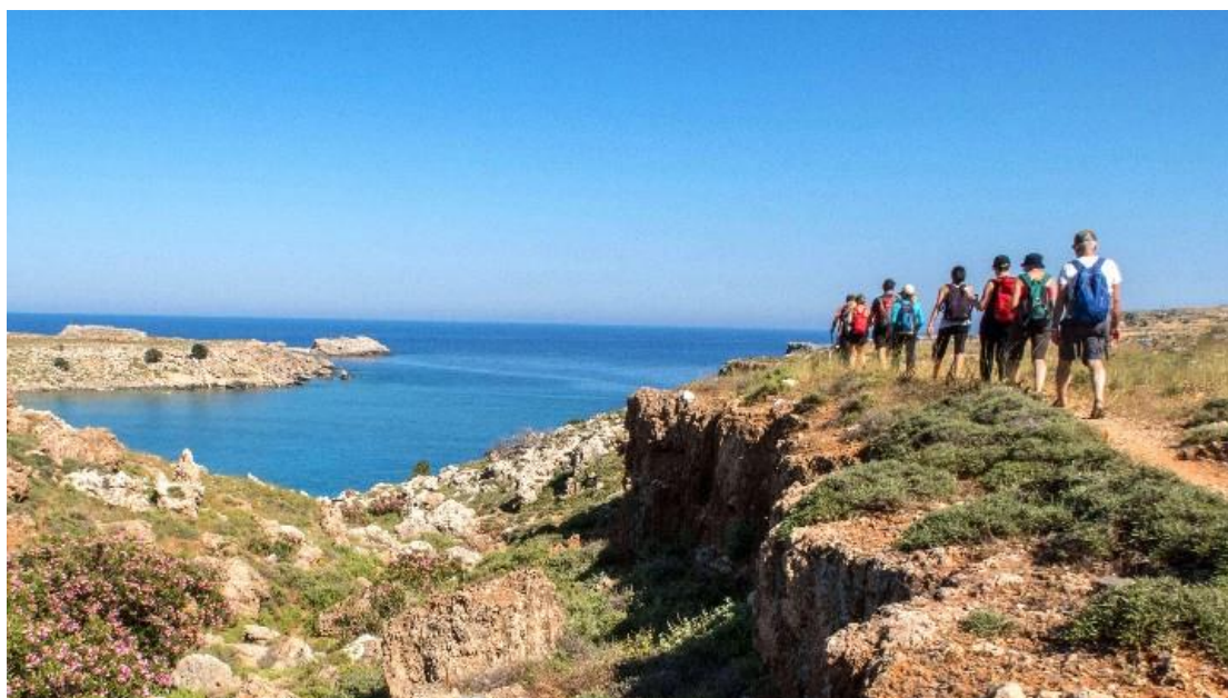
Εικόνα 13. Υπό ανάπτυξη βρίσκεται ο περιπατητικός τουρισμός στη Ρόδο