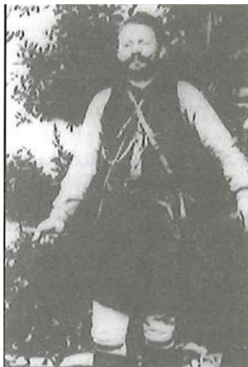
Εικόνα 5. Ο Καπετάν Βαγγέλης ο μακεδονομάχος Πηγή: Ι. Κουτσοκώστας, Οι Σαρακατσάνοι στους αγώνες , ό. π, σελ. 413