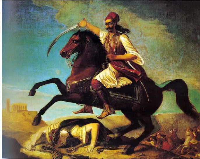
Εικόνα 1. Ο Γεώργιος Καραϊσκάκης εφορμά στην Ακρόπολη, έργο του Γεωργίου Μαργαρίτη, 1844.