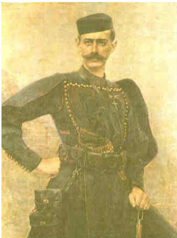
Εικόνα 3. Παύλος Μελάς.