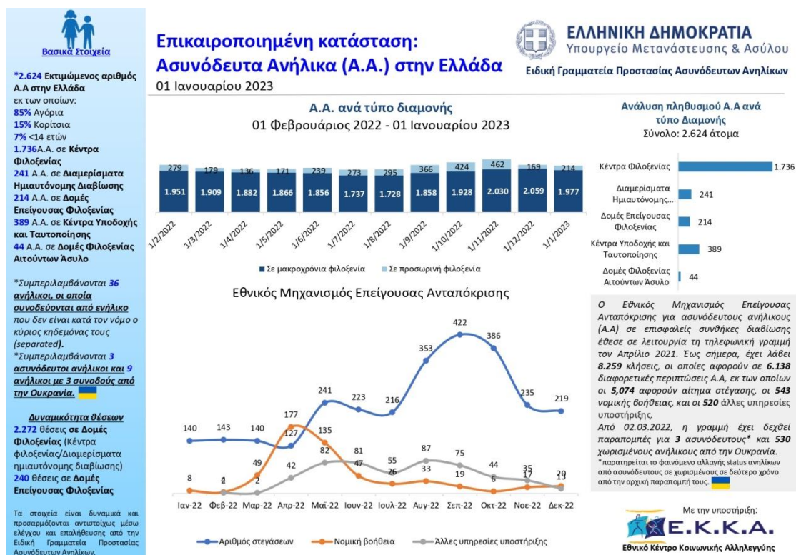
Στατιστικός Πίνακας ΑΑ Φεβρουάριος 2022-Ιανουάριος 2023 Ε.Κ.Κ.Α.