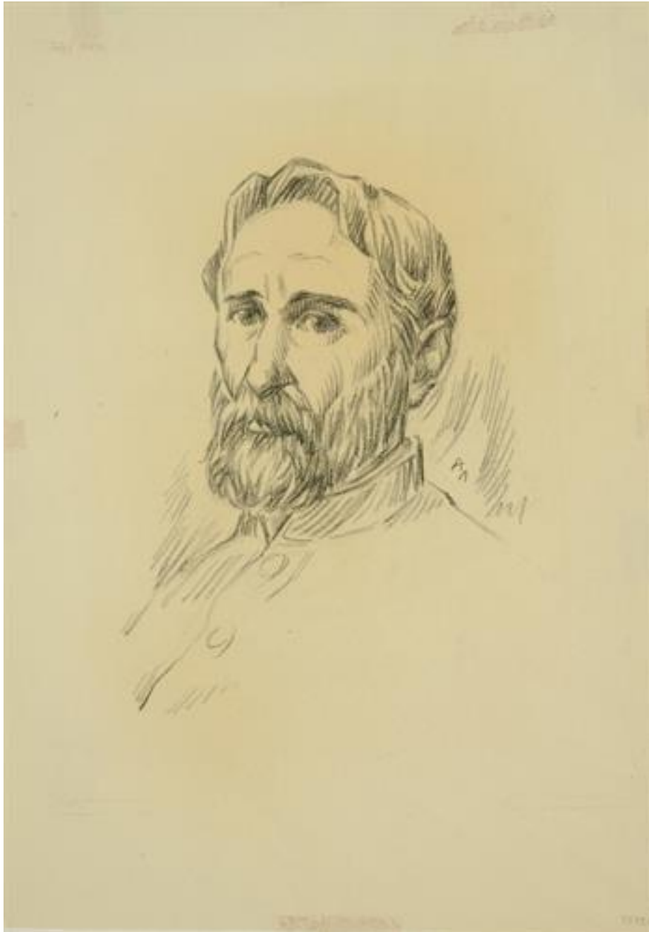
Προσωπογραφία Αθανάσιου Ιατρίδη-Εθνικό Ιστορικό Μουσείο