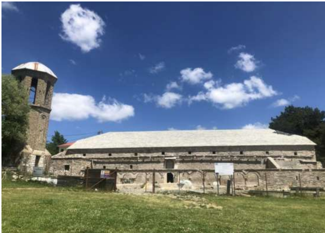
Εικόνα 9 Ιερός Ναός Κοιμήσεως της Θεοτόκου Σαμαρίνας

Τα τελευταία χρόνια υλοποιείται το έργο αποκατάστασης του ναού της Παναγίας μέσω του Περιφερειακού Επιχειρησιακού Προγράμματος Δυτικής Μακεδονίας ΕΣΠΑ 2014-2020. Το έργο χρηματοδοτείται από το Επιχειρησιακό Πρόγραμμα Δυτικής Μακεδονίας 2014-2020, με συνολικό προϋπολογισμό 3.153.645 ευρώ (με Φ.Π.Α.). Δικαιούχος είναι το Τμήμα Αναστήλωσης Βυζαντινών και Μεταβυζαντινών Μνημείων του Υπουργείου Πολιτισμού. Παράλληλα, υλοποιούνται υποέργα από τη Διεύθυνση Συντήρησης του Υπ. Πολιτισμού και από την ΕΦΑ Γρεβενών που αφορούν στη συντήρηση τοιχογραφιών, λίθινων αρχιτεκτονικών μελών και ξυλόγλυπτων.