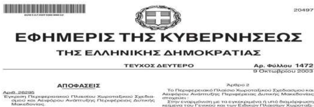
Εικόνα 2 ΦΕΚ- Απόφαση Έγκρισης Π.Π.Χ.Σ. Δυτικής Μακεδονίας