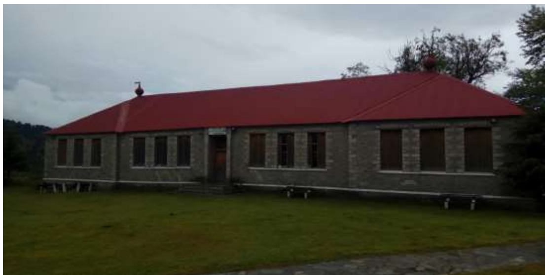
Εικόνα 10 Δημοτικό Σχολείο Σαμαρίνας

ήταν τέτοιος έτσι ώστε να μπορεί να μετριάξει τους ανέμους με ελαφρά επικλινές κατασκευαστικό μοτίβο και κάποιες μούρες ορθογονοποίησης του.