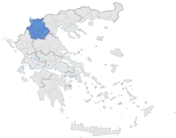
Εικόνα 4 Η θέση της Δυτικής Μακεδονίας στο χάρτη

Καταλαμβάνει αρκετά μεγάλη έκταση περίπου 9.400 τετραγωνικά χιλιόμετρα και ο πληθυσμός της ανέρχεται σύμφωνα με την τελευταία απογραφή του 2021 και στοιχεία της ΕΛΣΤΑΤ σε 254.595 κατοίκους. Χαρακτηρίζεται ως «ενεργειακή καρδιά» καθώς το μεγαλύτερο μέρος της ηλεκτρικής ενέργειας όλης της χώρας παράγεται στα εδάφη της. Είναι περιφέρεια ορεινή και η μόνη που δεν βρέχεται από θάλασσα. Νοτιανατολικά της Περιφέρειας τα όρια της εντοπίζονται στη γραμμή του συγκροτήματος της Πίνδου. Τα βουνά Γράμμος από την πλευρά της Καστοριάς και των Ιωαννίνων, Σμόλικας από την πλευρά των Γρεβενών, και Τύμφη από την πλευρά των Ιωαννίνων στα δυτικά όρια της περιφέρειας σχηματίζουν την πρώτη σειρά βουνών που χωρίζουν γεωγραφικά την περιφέρεια από την Ήπειρο.