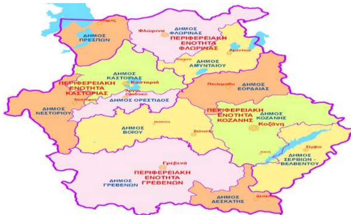
Εικόνα 3Χάρτης Περιοχών Δυτικής Μακεδονίας

Το σχέδιο περιφερειακής και χωροταξικής ανάπτυξης της Περιφέρειας Δυτικής Μακεδονίας εκπονήθηκε βάσει των διατάξεων του νόμου 2742/1999 ενώ έλαβε ΦΕΚ στις 9 Οκτωβρίου 2003 (ΦΕΚ Α1472). Η Περιφέρεια αυτή έλαβε τη διοικητική της υπόσταση με το νόμο 3852/2010 , γνωστός και ως νόμος «Καλλικράτης». Αποτελείται από τις Περιφερειακές Ενότητες Γρεβενών, Καστοριάς, Κοζάνης και Φλώρινας.