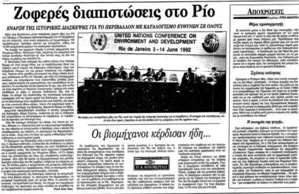
Εικόνα 1 Διακήρυξη Ρίο- Δημοσίευμα Εφημερίδα Καθημερινή, 1992

Συγκεκριμένα, στη Διάσκεψη τονίστηκε πώς διάφοροι παράγοντες κοινωνικής, οικονομικής και περιβαλλοντικές φύσεως και υπόστασης έχουν άμεση αλληλεξάρτηση και συνεξέλιξη. Η επιτυχία δεν είναι μονοδιάστατος παράγοντας και απαιτείται κοινή δράση για να έχει υπόσταση με την πάροδο των χρόνων. Αυτό το συμπέρασμα είναι και σήμερα η πηγή της δράσης. (Εφημερίδα Καθημερινή, 1992)