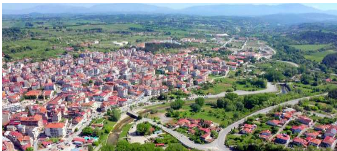
Εικόνα 8 Αεροφωτογραφία Πόλης Γρεβενών

Η πόλη των Γρεβενών παίζει το ρόλο του περιφερειακού και τοπικού κέντρου καλύπτοντας εξυπηρετήσεις και υποδομές και των δύο διοικητικών επιπέδων. Όλες οι υπόλοιπες δημοτικές ενότητες εξαρτώνται από την πόλη στο πιο μεγάλο μέρος των βασικών αναγκών. Η υπερσυγκέντρωση πληθυσμού που παρατηρείται στο κέντρο έρχεται σε αντίθεση με τη διασπορά που παρατηρείται στο υπόλοιπο μέρος. Το κέντρο της πόλης ρυμοτομικά έχει αναπτυχθεί με πολλαπλότητα αποσπασματικών πολεοδομικών ρυθμίσεων που δημιουργούν άναρχη δόμηση και προβληματικούς αστικούς θύλακες. Η έλλειψη σαφούς πολεοδομικού και ρυμοτομικού σχεδίου δημιουργεί άναρχες κατασκευές, συγκέντρωση των προβλημάτων στις τεχνικές υποδομές καθώς και πλήρη υποβάθμιση του αστικού περιβάλλοντος. Ενδεικτικό της κατάστασης είναι ότι αεροφωτογραφικά η αποτύπωση της πόλης, δεν δημιουργεί ευθείες ρυμοτομικές γραμμές.