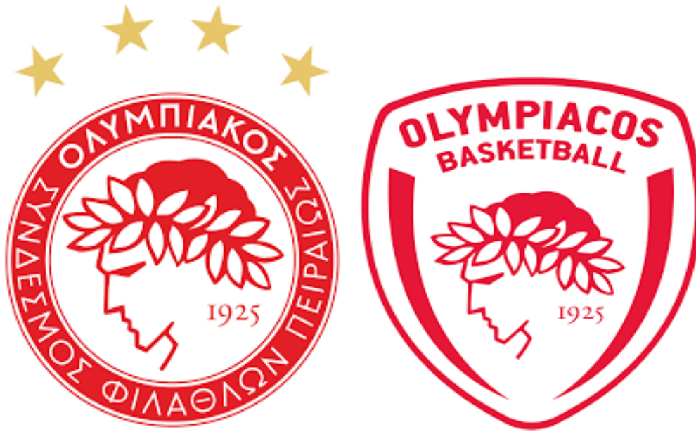
Εικόνα 5 Olympiacos FC & Olympiacos BC.