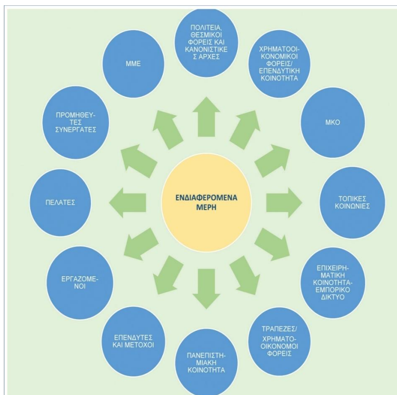
Εικόνα 4 Τα ενδιαφερόμενα μέρη (Stakeholders), Freeman, 1984

Ο προσδιορισμός των ενδιαφερομένων μερών αποτελεί ένα περίπλοκο ζήτημα. Ένας απλός τρόπος εντοπισμού των ενδιαφερομένων μερών, είναι η δημιουργία μιας λίστας με όλους τους βασικούς παράγοντες μέσα και γύρω από μια επιχείρηση. Έτσι θα μπορούσαμε να πούμε πως στα ενδιαφερόμενα μέρη ανήκουν οι καταναλωτές, οι πιστωτές, οι προμηθευτές, οι κυβερνήσεις, οι εργαζόμενοι, τα συνδικάτα των εργαζομένων, η διοίκηση, οι Μη Κυβερνητικές Οργανώσεις (ΜΚΟ), η κοινωνία κλπ. Η λίστα αυτή καταδεικνύει την δυσκολία ενός τέτοιου εγχειρήματος (Vos, 2003).