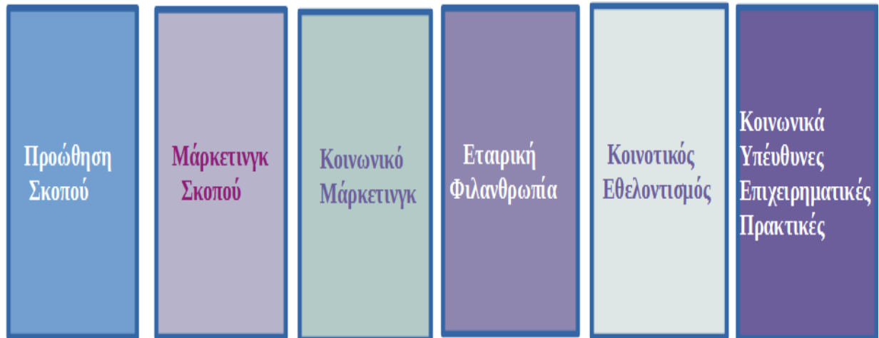
Εικόνα 3 Τα μοντέλα ΕΚΕ, Kotler & Lee, 2005.