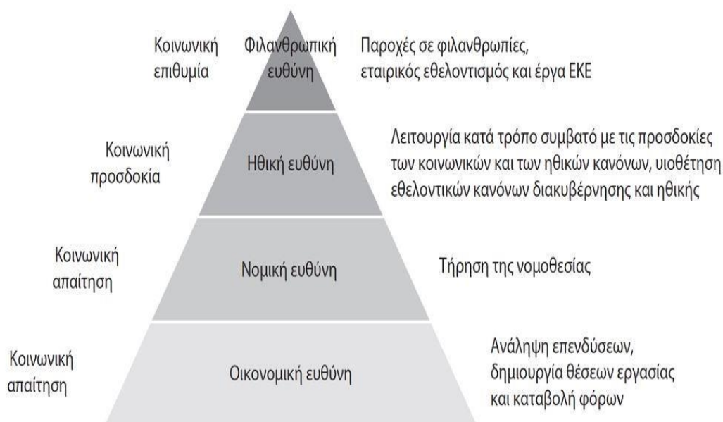
Εικόνα 1 Το πυραμοειδές μοντέλο των τεσσάρων διαστάσεων ΕΚΕ του Carroll 1991