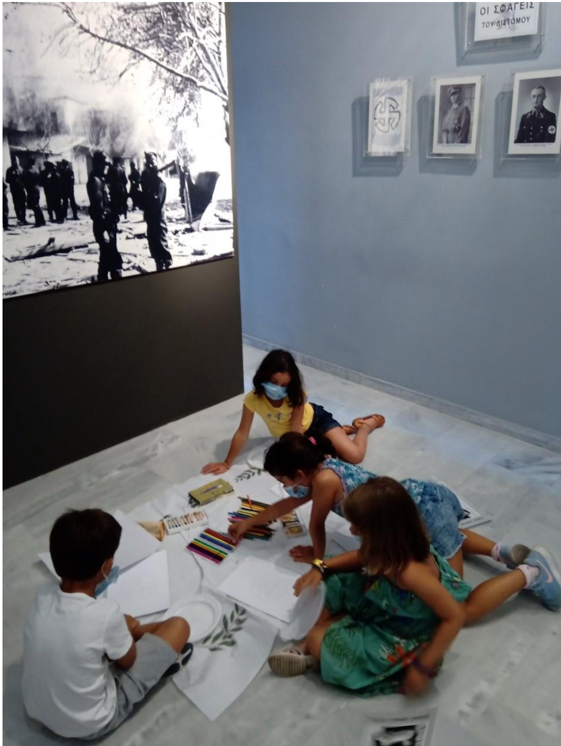
Εικόνα 4.3 Μουσείο-Παιδωγωγική. Τα παιδιά, ταξίδεψαν μέσω της βιοματικής προσέγγισης της Ιστορίας, αποτυπώνοντάς το με εικόνες και λέξεις