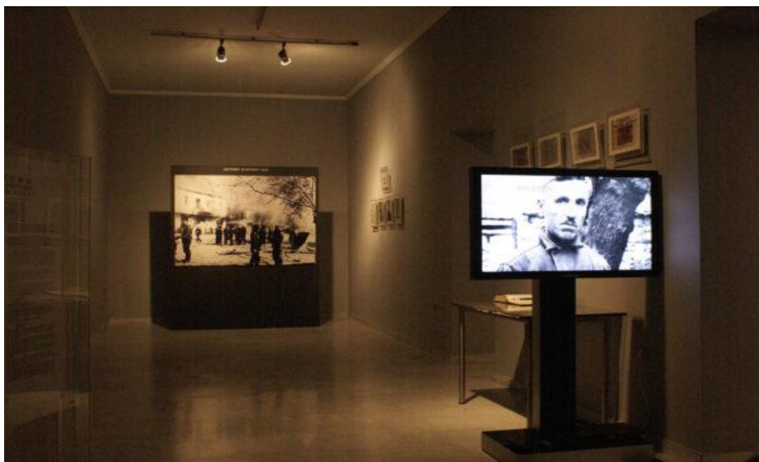
Εικόνα 2.5 Πρώτος όροφος του Μουσείου, ένδειξης λειτουργίας οπτικοακουστικών μέσων.