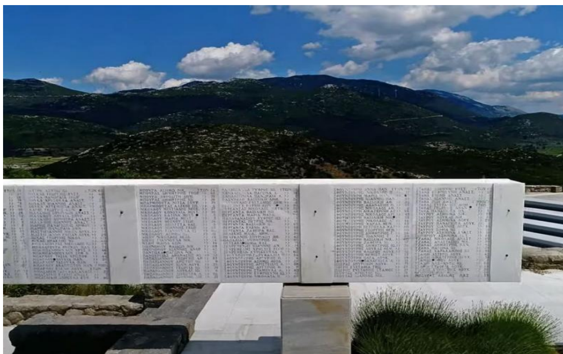
Εικόνα 2.2 Πλάκες πάνω στις οποίες αναγράφονται τα ονόματα των σφραγισθέντων, οι οποίες οδηγούν τον επισκέπτη διαβάζοντάς τες, στον ιερό χώρο του Μαυσωλείου.