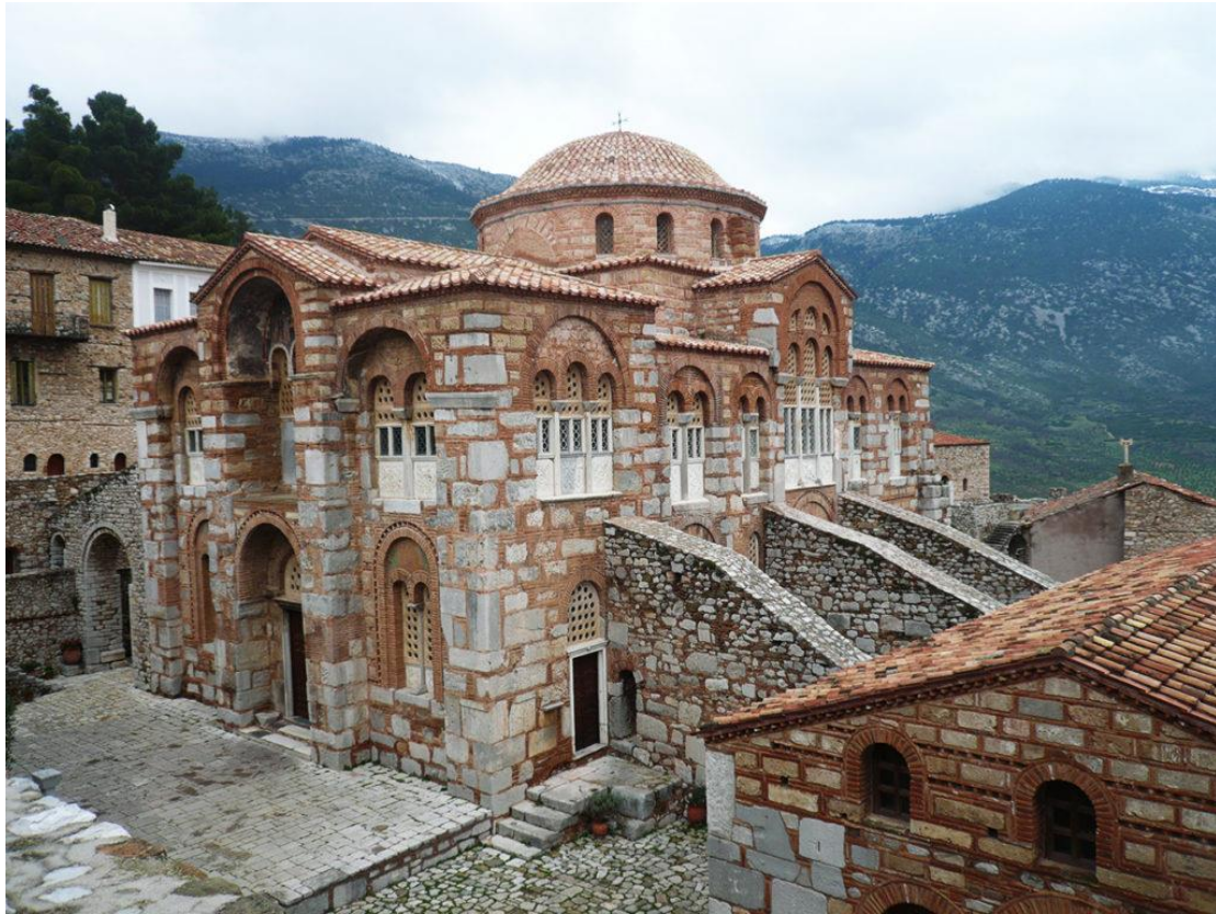
Εικόνα 3.3 Ιστορική Μονή Οσίου Λουκά