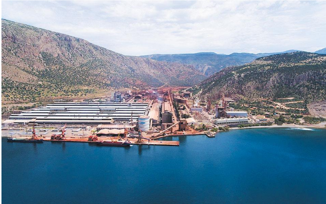
Εικόνα 3.1 Αλουμίνιο της Ελλάδας

μυχό γραφικό κόλπο της Αντίκυρας, στη Παραλία Διστόμου, ή αλλιώς `Διστομίτικα`, δημιουργήθηκαν τα Άσπρα Σπίτια Διστόμου, ένας οικισμός χτισμένος, σύμφωνα με τα ευρωπαϊκά πρότυπα, φιλοξενούσε την εργατική κοινότητα, η οποία αποτελούνταν από τις οικογένειες των εργαζομένων, κάτι το οποίο, έχει εδραιωθεί μέχρι και σήμερα. Το εργοστάσιο, το οποίο από το 2005, ανήκει στην εταιρεία MYTILINEOS, απασχολεί ένα μεγάλο ποσοστό ανθρώπινου δυναμικού της περιοχής.