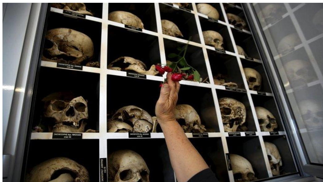
Εικόνα 2.3 Φωτογραφικό υλικό από το Μαυσωλείο του Διστόμου. Απεικόνιση των οστών των θυμάτων της σφαγής. Πολλά κρανία φέρουν τρύπες από σφαίρες, γεγονός που υποδηλώνει τη θηριωδία της αποφράδας ημέρας, της 10 ης Ιουνίου 1944.