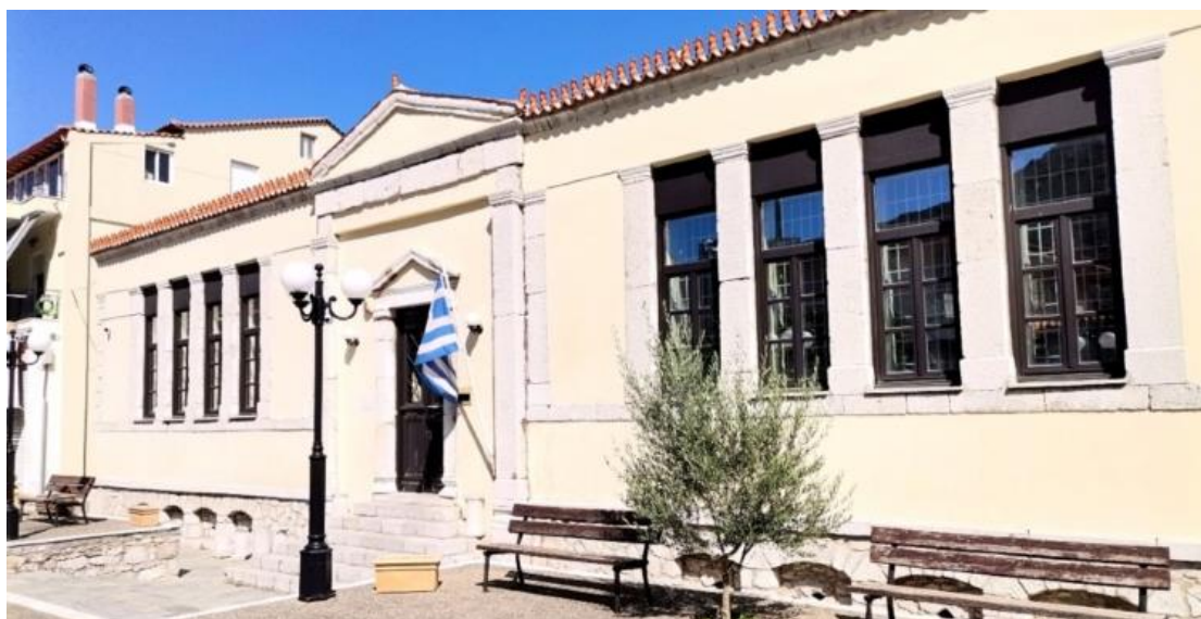
Εικόνα 4.1 Πρόσοψη Οικίας Αργύρη Σφουντούρη