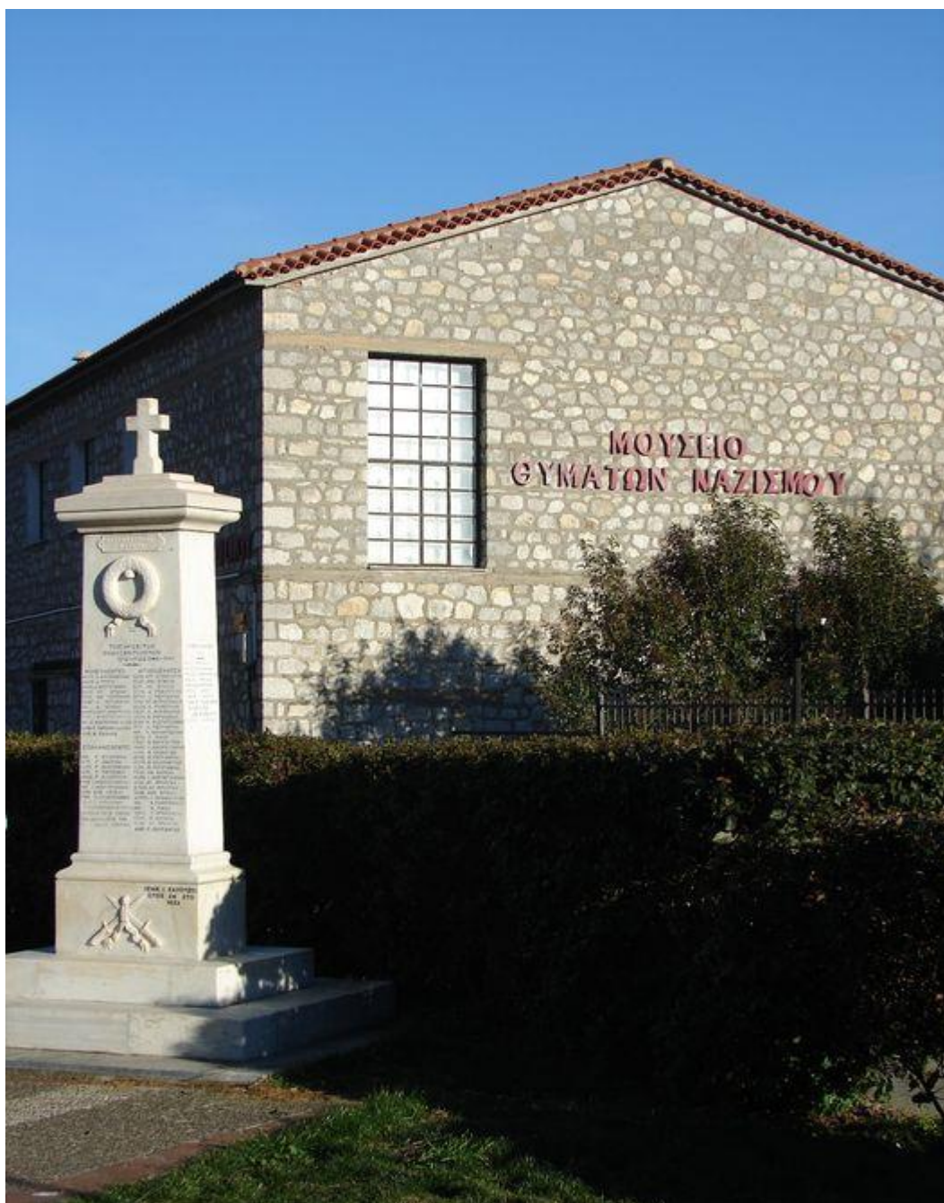
Εικόνα 2.4 Εξωτερική πρόσοψη του Μουσείου Θυμάτων Ναζισμού, στο Δίστομο.