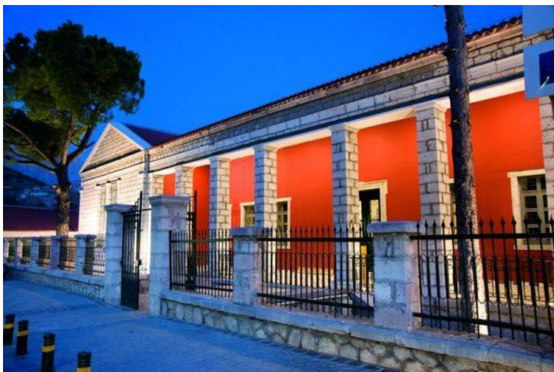
Εικόνα 3.5 Λαογραφικό Μουσείο Αράχωβας