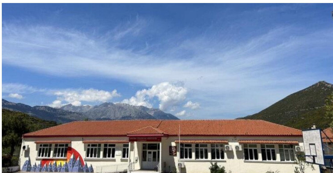
Εικόνα 3.4 Ataxia School, Δημοκρατικό Σχολείο του Βουνού

δέκα εκπαιδευτικοί, για την κάλυψη του προγράμματος μαθημάτων και δραστηριοτήτων. Να σημειωθεί, πως το συγκεκριμένο κτήριο, ήταν δημοτικό και παρέμενε κλειστό και ανεκμετάλλευτο, για παραπάνω από μια δεκαετία, λόγω μετακίνησης του πληθυσμού προς τα αστικά κέντρα.