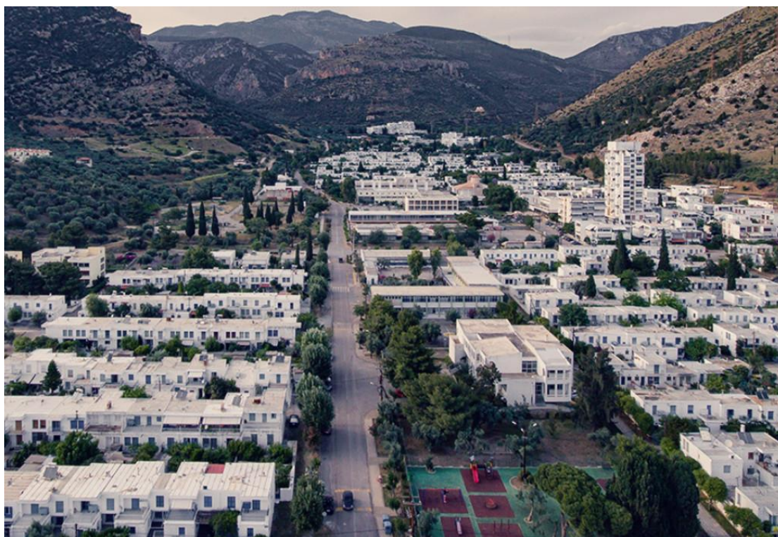
Εικόνα 3.2 Εργατικές Κατοικίες Παραλίας Διστόμου, Άσπρα Σπίτια