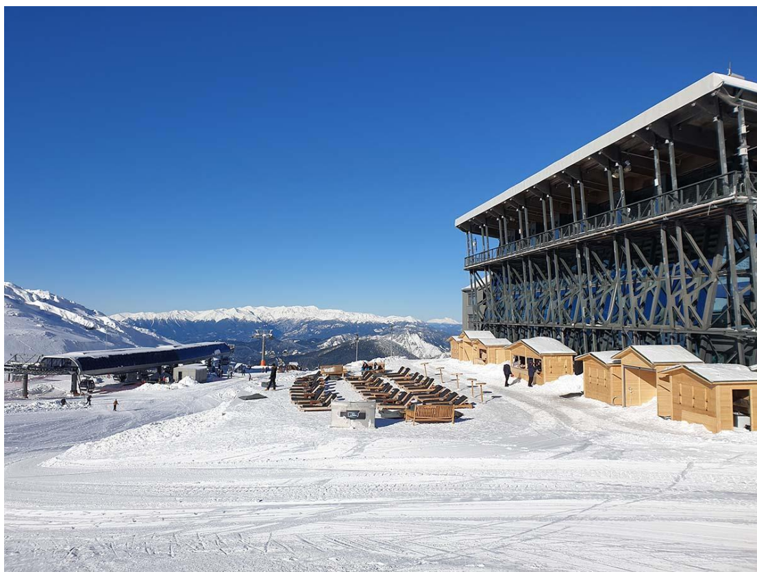
Εικόνα 3.7 Χιονοδρομικό Κέντρο Παρνασσού