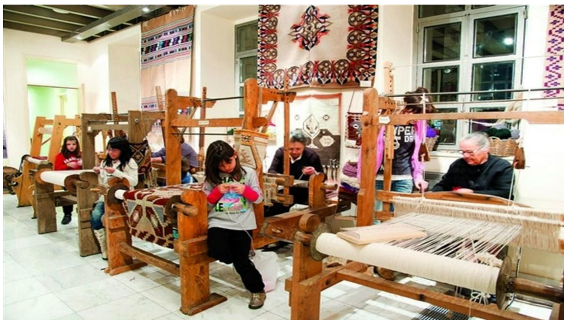
Εικόνα 3.6 Βιωματική Μάθηση στο Εργαστήρι Παραδοσιακών Τεχνών του Λαογραφικού Μουσείου Αράχωβας