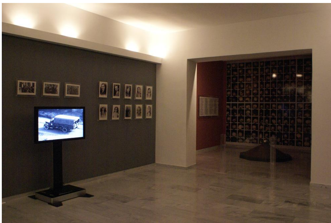
Εικόνα 2.6 Συλλογή με τις φωτογραφίες των θυμάτων της σφαγής