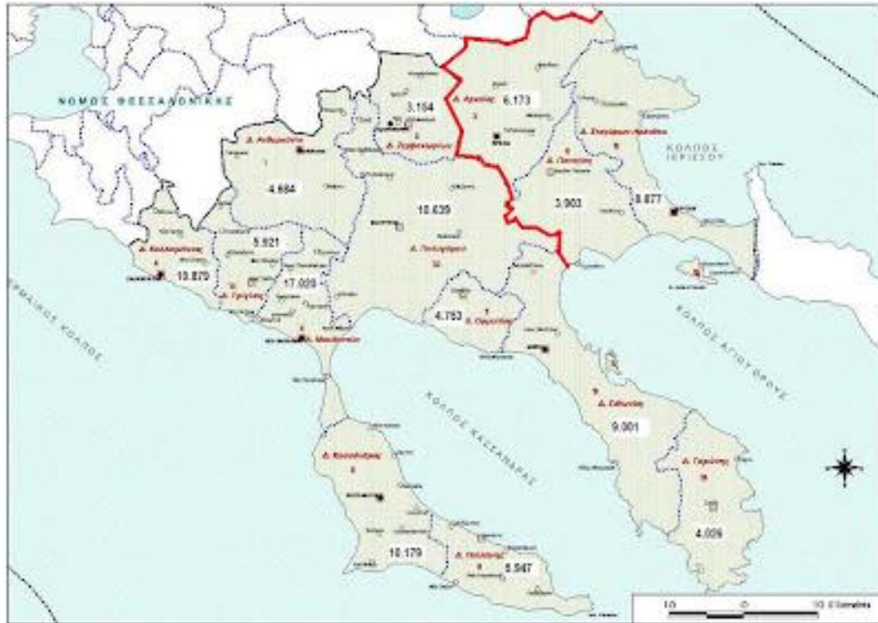
Εικόνα 3. Χάρτης του Δήμου Αριστοτέλη.

Ο Δήμος Αριστοτέλη αποτελείται από τις εξής Κοινότητες :