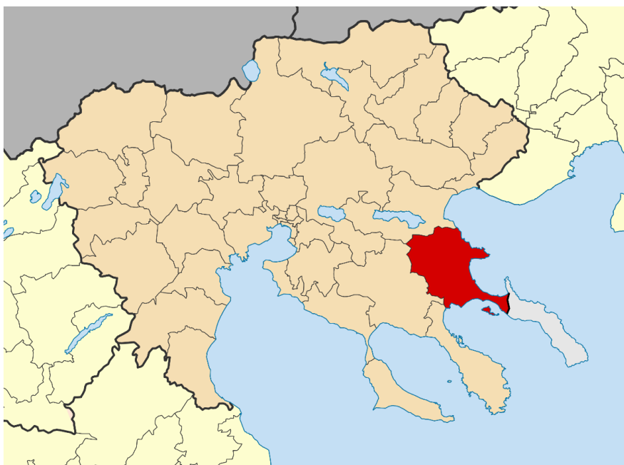
Εικόνα 2. Χάρτης με τη θέση του Δήμου Αριστοτέλη στην Περιφέρεια Κεντρικής Μακεδονίας

Ο Δήμος Αριστοτέλη είναι δήμος της Π.Ε. Χαλκιδικής στην Περιφέρεια Κεντρικής Μακεδονίας, στη Βορειοανατολική περιοχή της Χαλκιδικής, με έδρα την Ιερισσό, όπως φαίνεται και στον παρακάτω χάρτη.