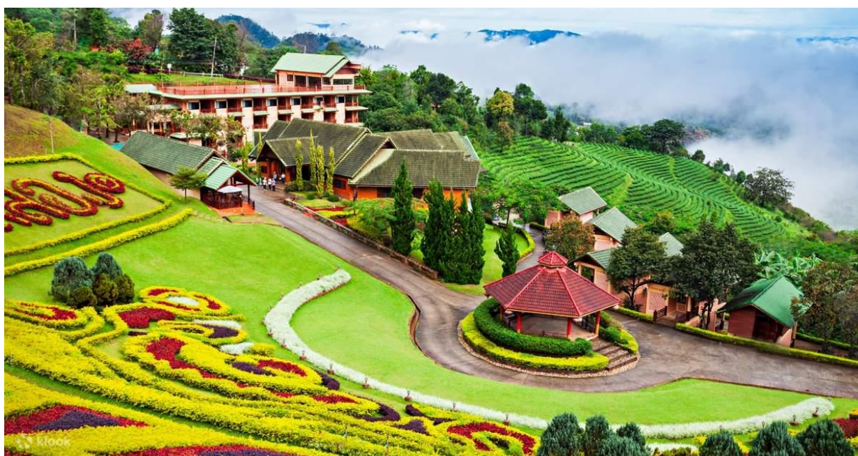
Εικόνα 1. Doi Tung Royal Villa και ο κήπος Mae Fah Luang

Το έργο εστιάζει στη μείωση της φτώχειας και στη βελτίωση της ποιότητας ζωής του τοπικού πληθυσμού. Αυτό επιτυγχάνεται μέσω της δημιουργίας βιώσιμων θέσεων εργασίας και δραστηριοτήτων που παράγουν εισόδημα, οι οποίες συχνά συνδέονται με τον αιεφόρο τουρισμό. Η περιοχή Doi Tung είναι πλέον δημοφιλής τουριστικός προορισμός, γνωστή για τα όμορφα τοπία και την πολιτιστική της ποικιλομορφία. Το έργο έχει αναπτύξει τουριστική υποδομή και προσφέρει μια σειρά από αξιοθέατα, όπως η Doi Tung Royal Villa, ο κήπος Mae Fah Luang και οι τοπικές αγορές χειροτεχνίας. Το έργο δίνει μεγάλη έμφαση στις πρακτικές διατήρησης του περιβάλλοντος, αναδάσωσης και αιεφόρου χρήσης γης και αυτό συνέβαλε στην αποκατάσταση και προστασία της φυσικής ομορφιάς της περιοχής.