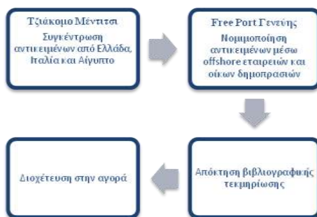
Πίν. 1 Το χρονικό του κυκλώματος στην Ιταλία. (Επιμ. Πίνακα: Ι. Π. Κακούρος)

Η μεγαλύτερη επιτυχία των ιταλικών αρχών πραγματοποιήθηκε το 1995 με επικεφαλής της επιχείρησης τον στρατηγό Ρομπέρτο Κονφόρτι. Με δικαστική απόφαση του εισαγγελέα Παολοτζότζιο Φέρρι ανοίχτηκαν αποθήκες στο Free Port της Γενεύης. Οι αποθήκες ανήκαν στον Τζιάκομο Μέντιτσι, έναν από τους μεγάλους αρχαιοπώλες – αρχαιοκάπηλους στην Ιταλία. Στο χώρο αυτό βρέθηκαν και κατασχέθηκαν πάνω από 10.000 αρχαιότητες, τοποθετημένες μέσα σε 3 αίθουσες. Βρέθηκε ακόμη και ένα εργαστήριο συντήρησης και αποκατάστασης αρχαιολογικών αντικειμένων. Έτσι, ο χώρος λειτουργούσε ως χώρος αποθήκευσης, συντήρησης και προώθησης των αντικειμένων στην αγορά 154 .