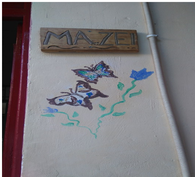
Εικόνα 2. – ΚΟΙΝΣΕΠ «ΜΑ...ΖΕΙ», ΕΛΛΑΔΑ