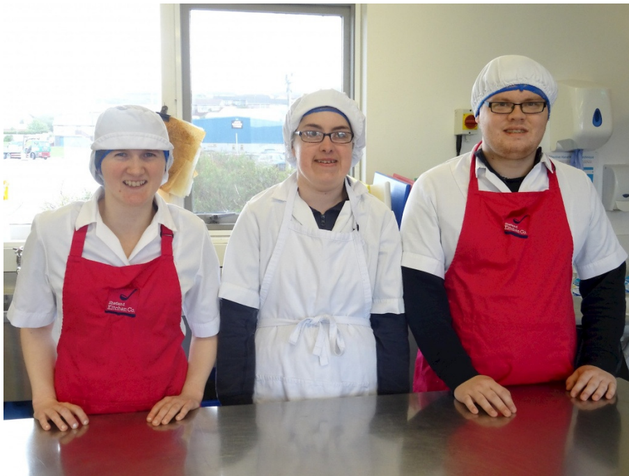
Εικόνα 10. – COPE LTD, SHETLAND ΣΚΩΤΙΑ