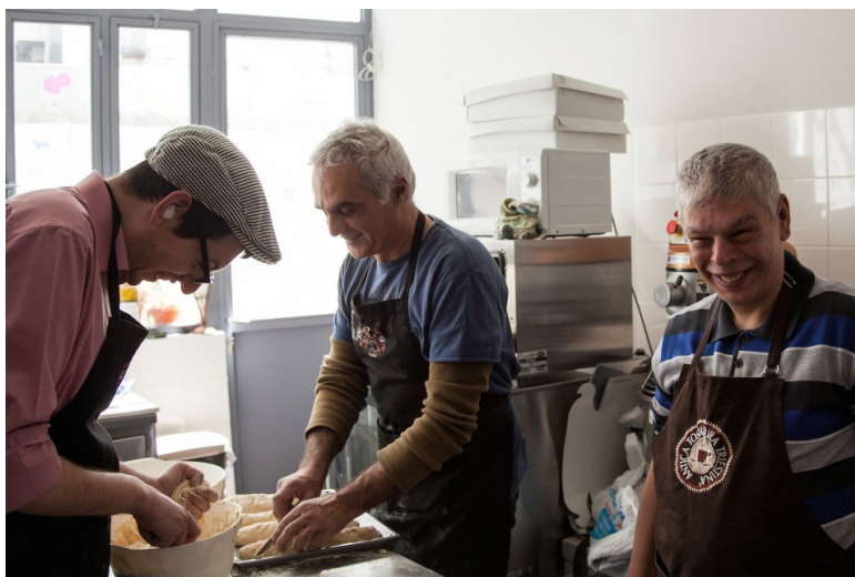
Εικόνα 4. – ΚΟΙΝΣΕΠ «ΜΥΡΤΙΛΛΟ CAFE» , ΕΛΛΑΔΑ