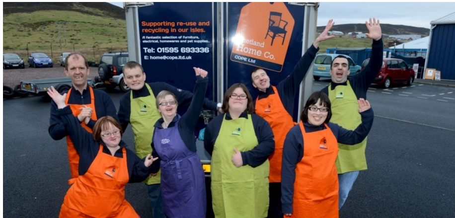
Εικόνα 12. – COPE LTD, SHETLAND ΣΚΩΤΙΑ