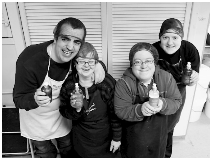
Εικόνα 13. – COPE LTD, SHETLAND ΣΚΩΤΙΑ